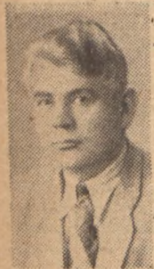
B A K J A N Kielce

Pochodzenia robotniczego. Od 17 roku życia bierze udział w życiu polityczno-społecznym. Okres wojny przeżył w obozie jeńców wojennych w Murnau. W 1945 r. wraca do kraju i bezpośrednio wstępuje do pracy politycznej w Stronnictwie Ludowym. W roku 1948 zostaje powołany na przewodniczącego WRN w Kielcach, które to stanowisko pełni do ostatnich wyborów. Jednocześnie piastuje mandat członka Naczelnej Rady ZSL i I wiceprzewodniczącego Woj. Kom. Wyk. ZSL.