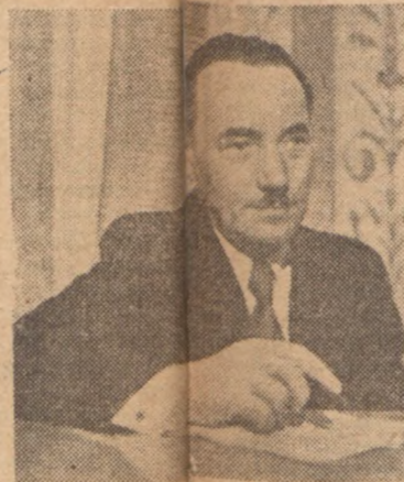
Warszawa wolna. Rząd polski, nie patrząc na olbrzymie zniszczenia, przenosi się do Stolicy. Tam też obraduje Krajowa Rada Narodowa.

ZADANIEM PARTII I PAŃSTWA JEST POGŁĘBIENIE TEGO HISTORYCZNEGO PROCESU PRZEOBRZENIA, KTÓRY ZAPOCZĄTKOWAŁ 5 LAT TEMU ZDOBYCIE WŁADZY LUDOWEJ. W TYM KIERUNKU WINNO ROZWIJAĆ SIĘ NASZE USTAWODAWSTWO PAŃSTWOWE I NASZ WYBIEK, ZMIENIAJĄCY WARTOŚCI ŻYCIA SPOŁECZNEGO W TAKI SPOSÓB, ABY WZMOCNIŁ AKTYWNOŚĆ MASY PRACUJĄCYCH ZNAJDUJĄC NAJPEŁNIEJSZE UJŚCIE DO NOWEJ FAZY ROZWOJU. TAKI CEL POSTAWIŁA PRZED SOBĄ NOWA DONIOSŁA REFORMA, KTÓREJ WYRAZEM JEST UCHWAŁONA PRZEZ SEJM USTAWA O TERENOWYCH ORGANACH JEDNOLITEJ WŁADZY PAŃSTWOWEJ. ORGANAMI WŁADZY STANĄ SIĘ NASZE RADY NARODOWE (B. BIERUT).