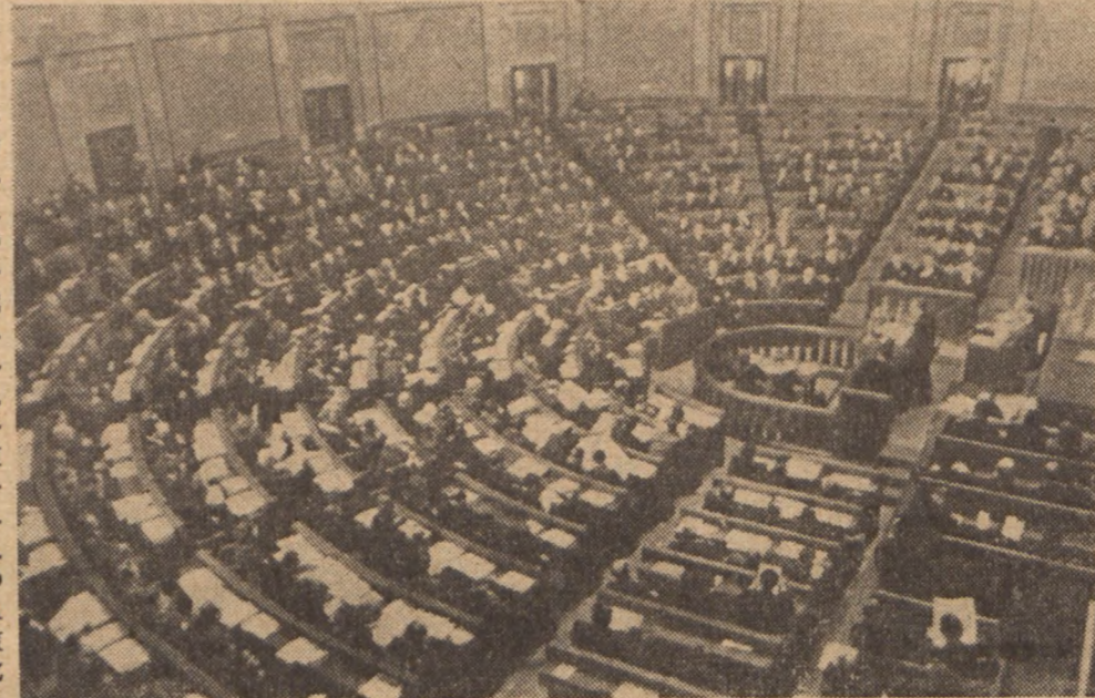
Dnia 5 lutego 1947 r. odbyło się pierwsze posiedzenie Sejmu, który jednogłośnie wybrał Prezydentem Rzeczypospolitej Polski dotychczasowego Prezydenta KRN — BOLESŁAWA BIERUTA.

ZADANIEM PARTII I PAŃSTWA JEST POGŁĘBIENIE TEGO HISTORYCZNEGO PROCESU PRZEOBRZENIA, KTÓRY ZAPOCZĄTKOWAŁ 5 LAT TEMU ZDOBYCIE WŁADZY LUDOWEJ. W TYM KIERUNKU WINNO ROZWIJAĆ SIĘ NASZE USTAWODAWSTWO PAŃSTWOWE I NASZ WYBIEK, ZMIENIAJĄCY WARTOŚCI ŻYCIA SPOŁECZNEGO W TAKI SPOSÓB, ABY WZMOCNIŁ AKTYWNOŚĆ MASY PRACUJĄCYCH ZNAJDUJĄC NAJPEŁNIEJSZE UJŚCIE DO NOWEJ FAZY ROZWOJU. TAKI CEL POSTAWIŁA PRZED SOBĄ NOWA DONIOSŁA REFORMA, KTÓREJ WYRAZEM JEST UCHWAŁONA PRZEZ SEJM USTAWA O TERENOWYCH ORGANACH JEDNOLITEJ WŁADZY PAŃSTWOWEJ. ORGANAMI WŁADZY STANĄ SIĘ NASZE RADY NARODOWE (B. BIERUT).