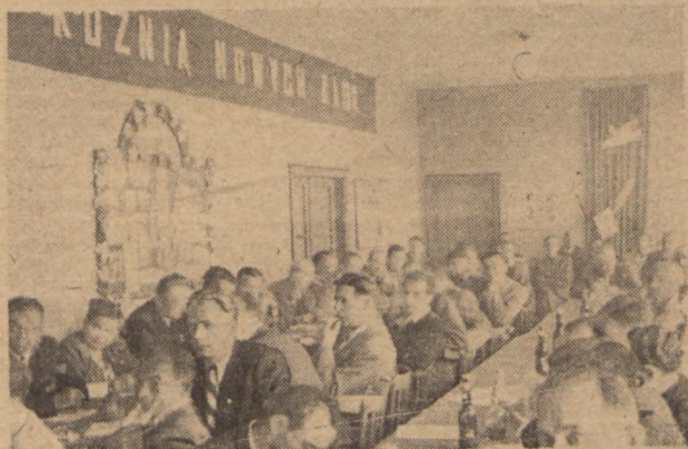
Ogólny widok sali obrad.