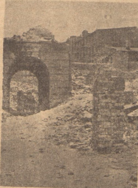
Ruiny domu przy ul. Twardej w Warszawie — gdzie odbyło się historyczne posiedzenie K. R. N.