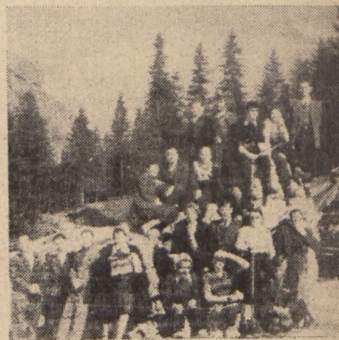
Pierwszy etap wycieczki ukończony. Laureaci w otoczeniu grupy wczasowiczów w Dolinie Strążyskiej.