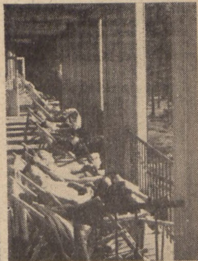
Wszędzie dobrze, ale w „domu” najlepiej. Teraz odpoczynek na tarasie „Bristolu”. A jutro znowu droga w nieznaną — po nowe wrażenia.