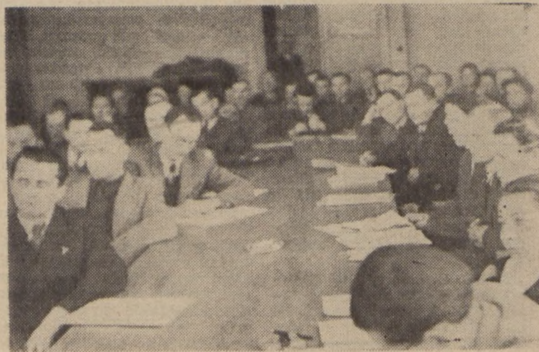
Na zdjęciu widok sali obrad.

Obrazy przeszły pod znakiem krytyki i samokrytyki w myśli wytycznych III Plenum CRZZ.