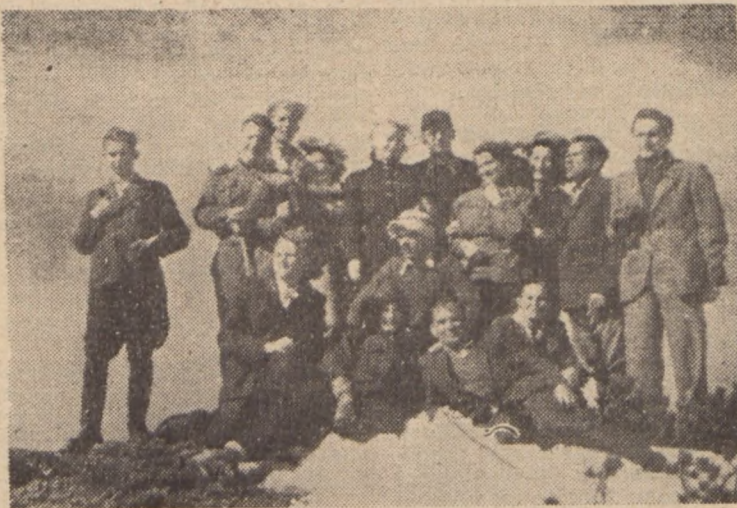
Na szczycie Małej Świnicy (1336 m) wieje silny wiatr. Przyjemnie jest zdobyć szczyt.