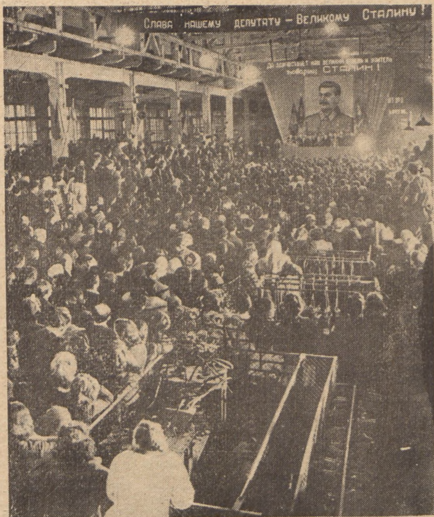
Przedwyborcze zebrania robotników i pracowników moskiewskiej fabryki artykułów elektrycznych, poświęcone wytypowaniu kandydata na posła Najwyższej Rady ZSRR. Zebrani jednogłośnie wysunęli kandydaturę JÓZEFA STALINA. Zebranie zmieniło się w żywiołą manifestację przywiązania ludu radzieckiego do wielkiego Stalina.