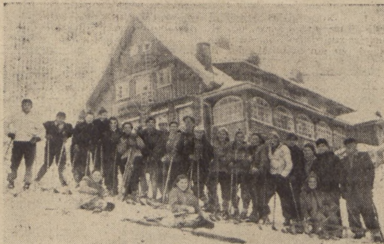
Uczestnicy kursu narciarskiego K. S. „Ogniwo” w Świeradowie Zdroju.

Pierwsze kroki nowego Zarządu Koła Sportowego „Ogniwo” i wszystkich współpracujących pozwalają sądzić, że ich dalsza działalność będzie owocna dla sportu i życia kulturalnego w Polsce Ludowej.