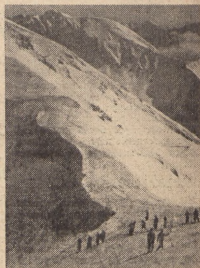
Pięknie było na Kasprowym — a dzisiaj...