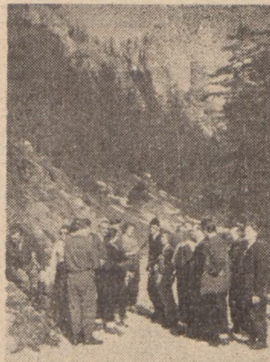
Co za piękny krajobraz. Nie poznajecie? To „Trzy Kominy”.