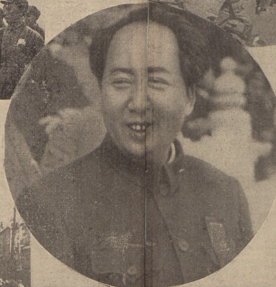
Wódz chińskiego i chińskiej klasy robotniczej, Prezydent Centralnego Rządu Narodowego Chińskiej Republiki Ludowej Mao - tsz - Tung.