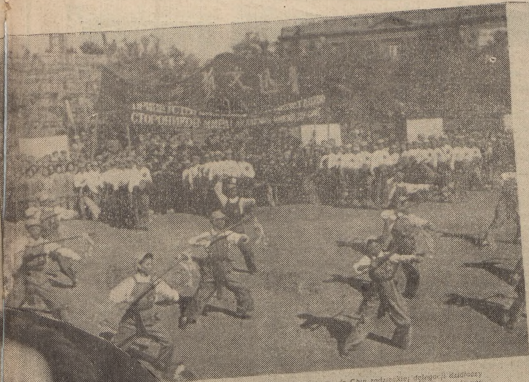
Mukden. Z okazji przybycia do Chin radzieckiej delegacji kulturalnej na głównym placu odbył się obchodowy występ naradowego chińskiego zespołu tańca i muzyki.