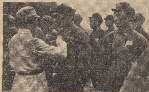
Chwila dekoracji zasłużonych żołnierzy o wolność swego narodu.