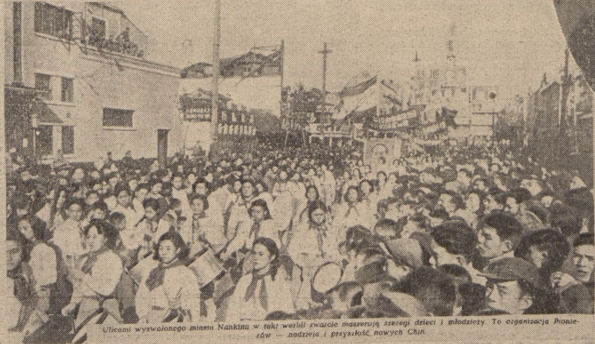
Ulicami wyzwalonego miasta Nankinu w takt wzięli szereg dzieci i młodzieży. To organizacja Pionierów – nadzieja i przyszłość nowych Chin.