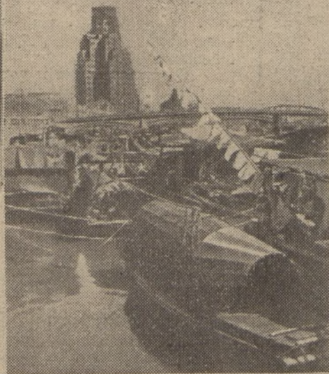
Typowy przykład wyzysku kolonialno-kapitałistycznego, epityfami w Chinach niemalże, na każdym mieście. Ludzie domy, na których w najbardziej wyczerpanych okolicach siedzi się rodzimi robotników – i wspaniały luksusowy pałac drapieżny chmur dla przywódców imperialistycznych.