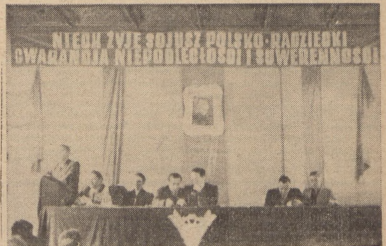
Prezydium Zebrania Plenarnego Okręgu Krakowskiego.

b) dążyć do poszerzenia aktywności i wciągnięcia do pracy związkowej szerokich rzesz bezpartyjnych towarzyszy,