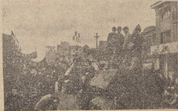
Wyzwolenemu armia Chin Ludowych witana była na całym terenie z entuzjazmem i miłością. Na zdjęciu: fragmenty z życia Armii Narodowo-Wyzwoleńczej. Żołnierze wkładają do miasta przed chwilą oswobodzonego. Na chodnikach radośnie tańczą. Ludność wywitała razem z wojskiem obywatela anta państwa.

Chcemy w tym krótkim fotomontażu zapoznać naszych czytelników, chociażby bardzo pobieżnie, z walką i życiem NOWYCH CHIN.