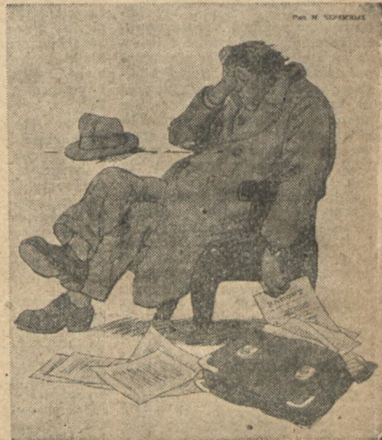
A PRZECIEŻ TO TAKIE PROSTE . . .

Ależ ze mnie gapa! Zameldowałem ministrowi o wykonaniu czternastu punktów okólnika, a ich w rzeczywistości było osiem.