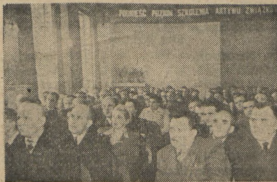
Do ostatniego miejsca wypełnili członkowie CRZZ i centralny aktyw związkowy salę obrad w czasie ostatniego plenum. (Na zdjęciu ogólny widok sali.)