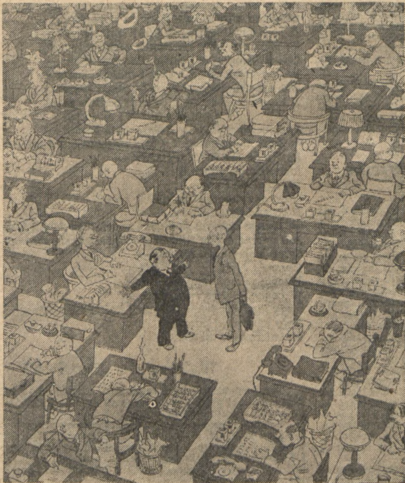
IŁOŚĆ NIE PRZECHODZĄCA W JAKOŚĆ

— W żaden sposób pojąć tego nie mogę! pracuje u nas około pięćdziesięciu ekonomistów, a praca w dalszym ciągu jest nie ekonomiczna.