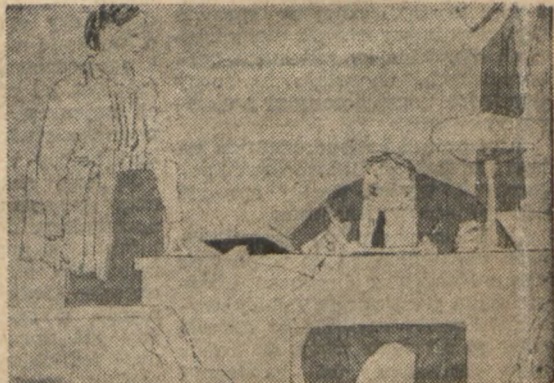
KRÓTKO i JASNO

— U was z tajnymi papierami wszystko w porządku? — O tak! tajne papiery są schowane w tej kasie, a do niej żaden klucz nie pasuje. No to jak wy otwieracie? Ja? Gwoździem.