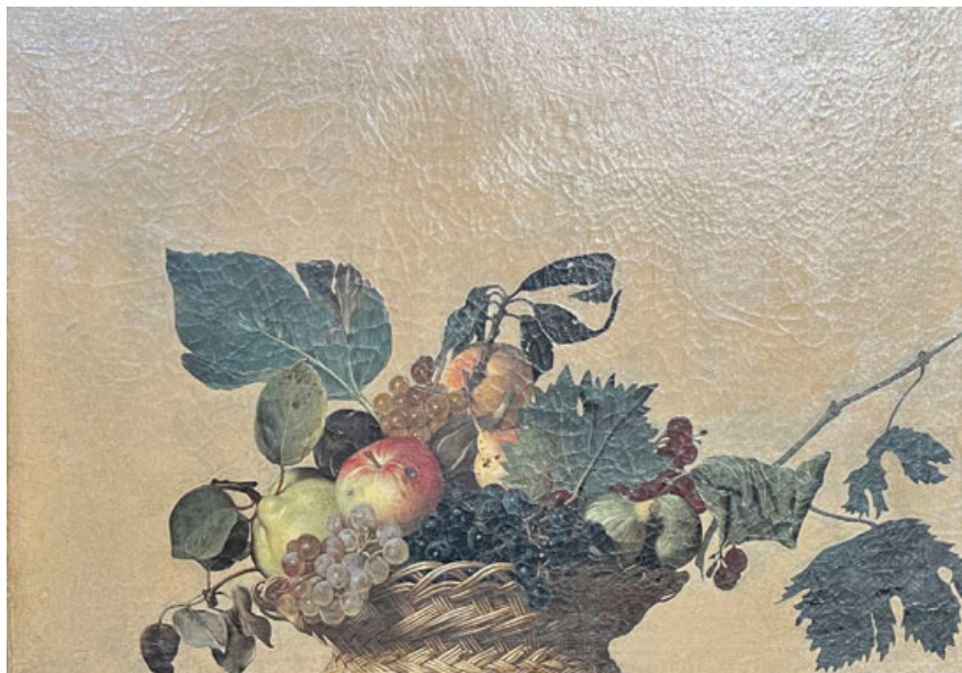
Ryc. 1. Caravaggio, Kosz z owocami, Ambrosiana, Mediolan