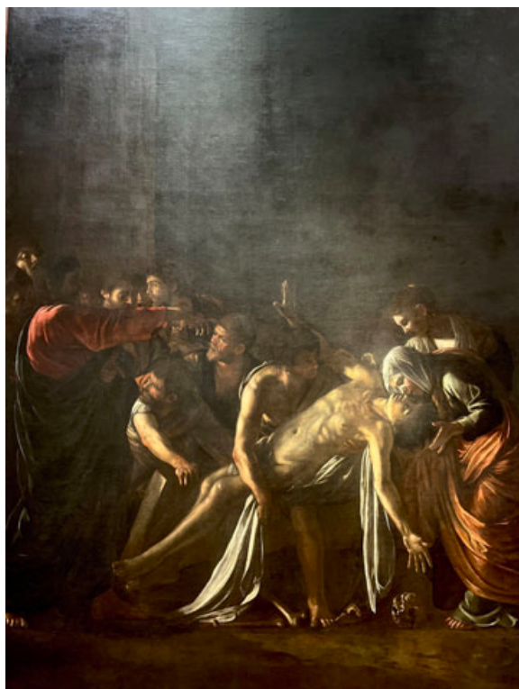
Ryc. 4. Caravaggio, Wskrzeszenie Łazarza , muzeum regionalne w Mesynie (zdjęcie z prywatnej kolekcji autorki)

Niedługo po namalowaniu Pogrzebu św. Łucji – być może autor nie doczekał nawet do momentu jego oficjalnego umieszczenia w ołtarzu, planowanego najprawdopodobniej na dzień św. Łucji (który na początku XVII wieku obchodzono nie 13 grudnia, lecz w czasie zimowego przesilenia, w najkrótszy dzień roku) – Caravaggio opuścił Syrakuzy i udał się do Mesyny. Zdobył tam zamówienie na ołtarzowy obraz przedstawiający wskrzeszenie Łazarza do kaplicy kościoła ojców Crociferi, opiekujących się chorymi (Langdon 2003: 388). Współcześnie znane Wskrzeszenie Łazarza może nie być pierwszą wersją obrazu, która prawdopodobnie została zniszczona przez samego autora pod wpływem emocji wywołanych uwagami pierwszych odbiorców na temat dzieła. Jest jednak z pewnością dziełem Caravaggia i nawiązuje do historii znanej z Ewangelii św. Jana.