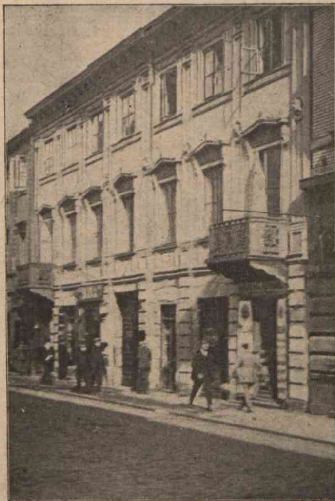
Polski Bank Komunalny.

Powołanie do życia Banku Komunalnego, jako samorządowej placówki finansowej, było doniosłym aktem