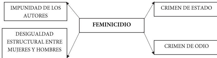
Gráfico 1. La definición gráfica de feminicidio según Marcela Lagarde y de los Ríos

Sobre la base de esta descripción de feminicidio se puede elaborar una definición general del concepto, la cual consta de cuatro elementos: es un crimen basado en odio; se produce en las condiciones de la desigualdad social, cultural, económica, jurídica y política entre las mujeres y hombres; se caracteriza por el hecho de que la mayoría de los autores siguen siendo impunes; y por fin, este crimen ocurre cuando el Estado no actúa debidamente en su contra, es decir los mecanismos básicos de la protección de víctimas y la justicia o no funcionan o están a servicios del crimen organizado.