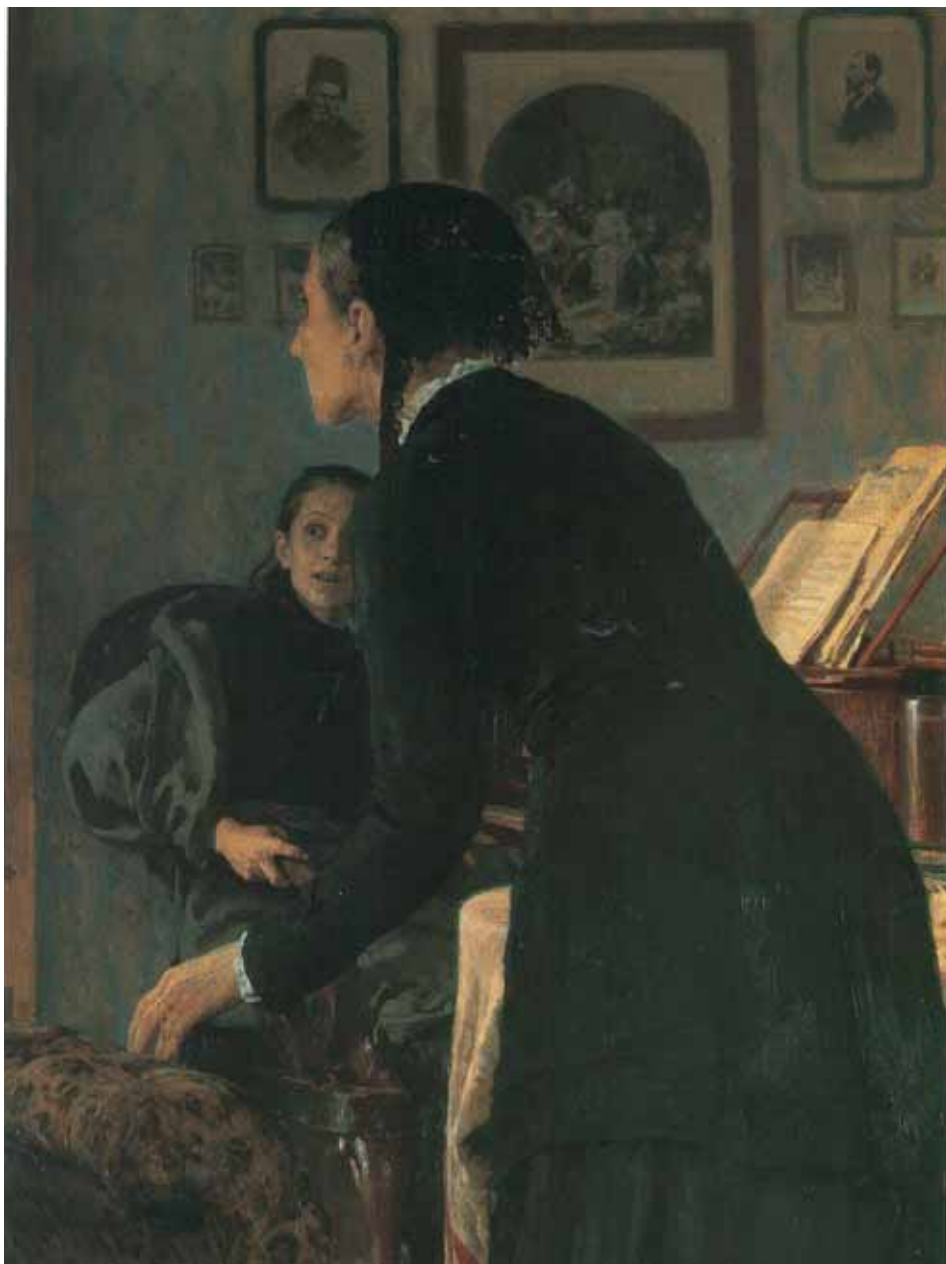
Ilustracja 3. Ilya Riepin, Nie zdali , fragment.