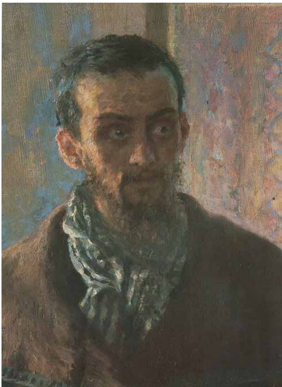
Ilustracja 2. Ilja Riepin, Nie żdali , fragment.