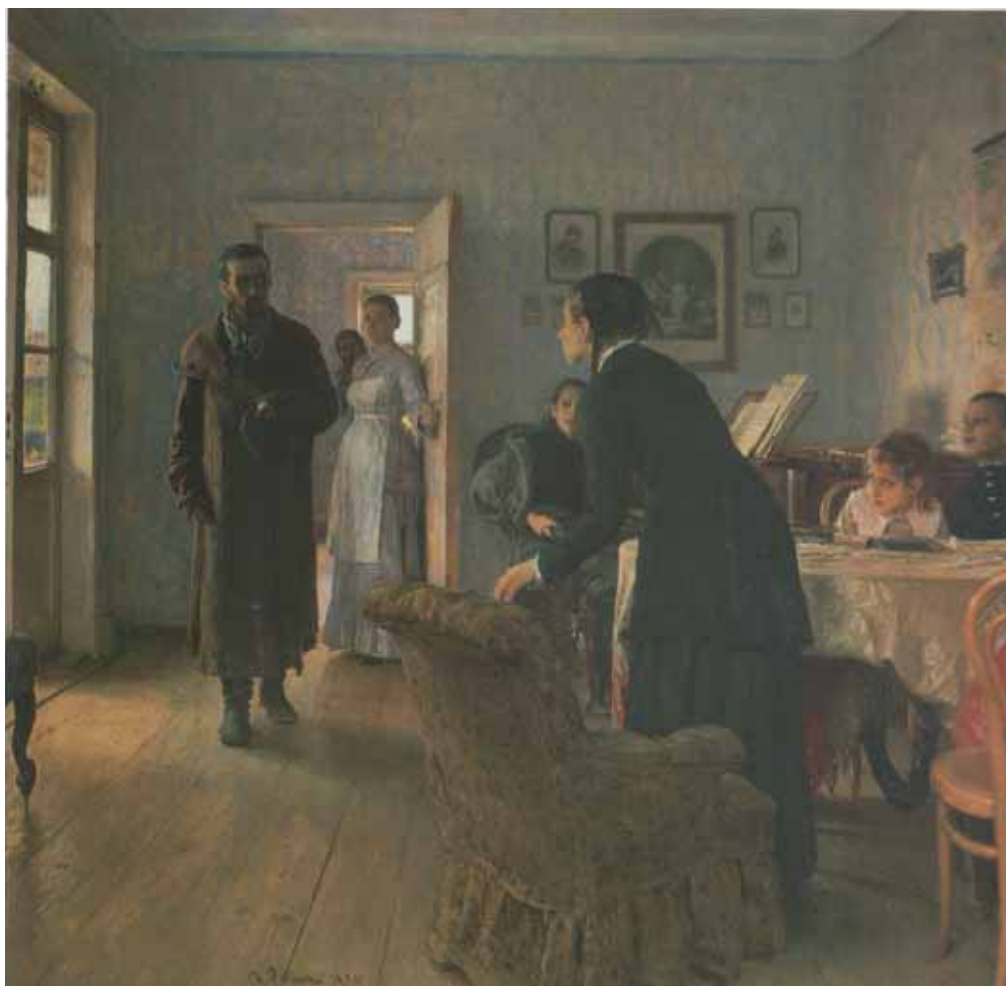
Ilustracja 1. Ilja Riepin, Nie żdali , 1884-1888, olej na płótnie, 160,5cm x 167,5cm.