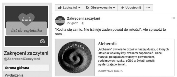
Rycina 2. Post „Kocha się za nic. Nie istnieje żaden powód do miłości. Ale sprawdź to sam...” zamieszczony na fan page’u „Zakręcenii zacytani” 47 .