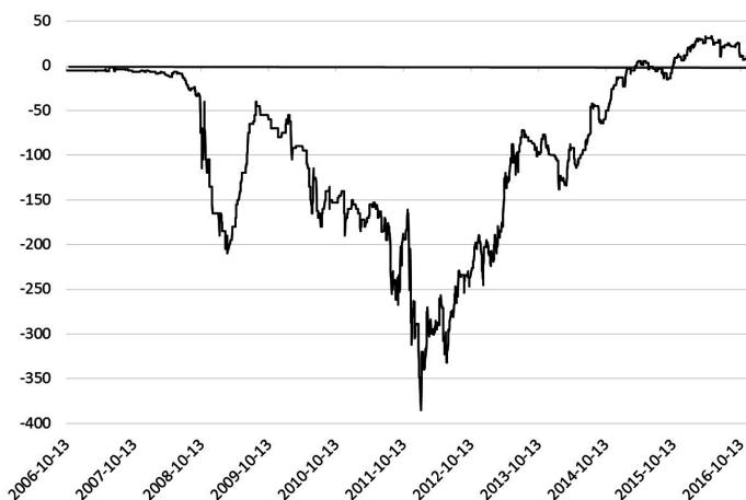
Rys. 2. Spread bazowy dla pary EUR/HUF (CCBS 5Y)

Operacje przewalutowania miały jednak wpływ na rynek swapów walutowych. Zmienność cen dla swapa bazowego EUR/HUF została przedstawiona na rys. 2.