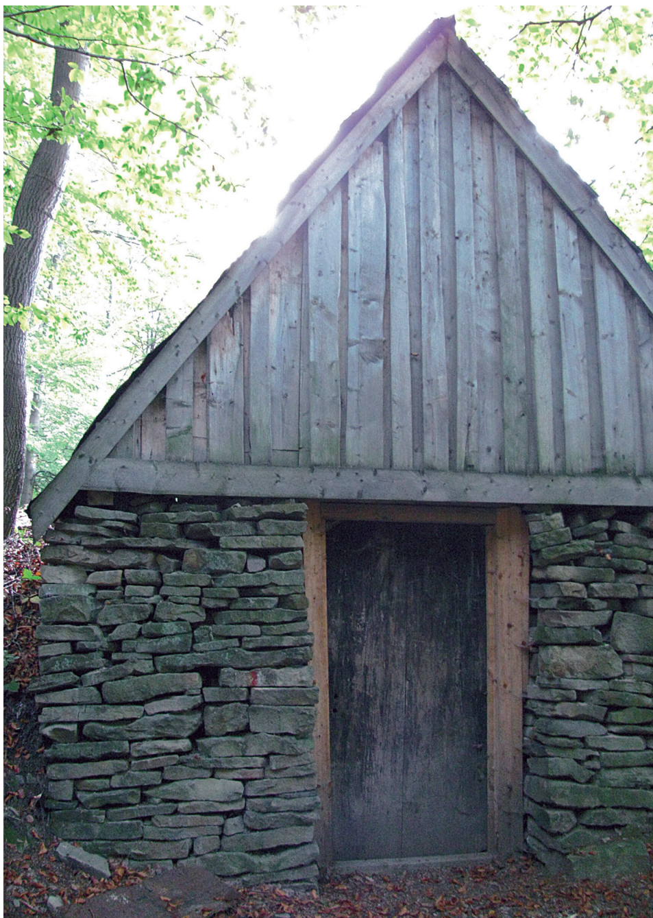
Fot. 1. Szopa kamienna na Cinalkowej Polanie w paśmie góry Żar

Photo 1. A stone hut on the Cinalkowa meadow