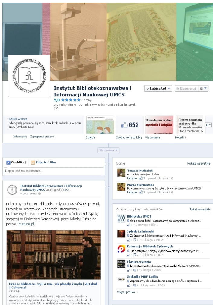
Rys. 1. Fan page Instytutu Bibliotekoznawstwa i Informatyki UMCS