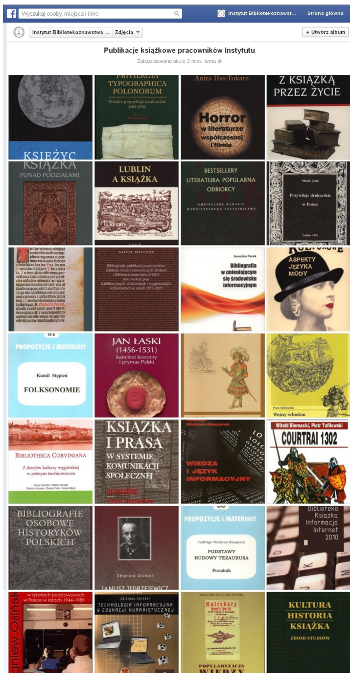
Rys. 2. Album „Publikacje książkowe pracowników Instytutu”