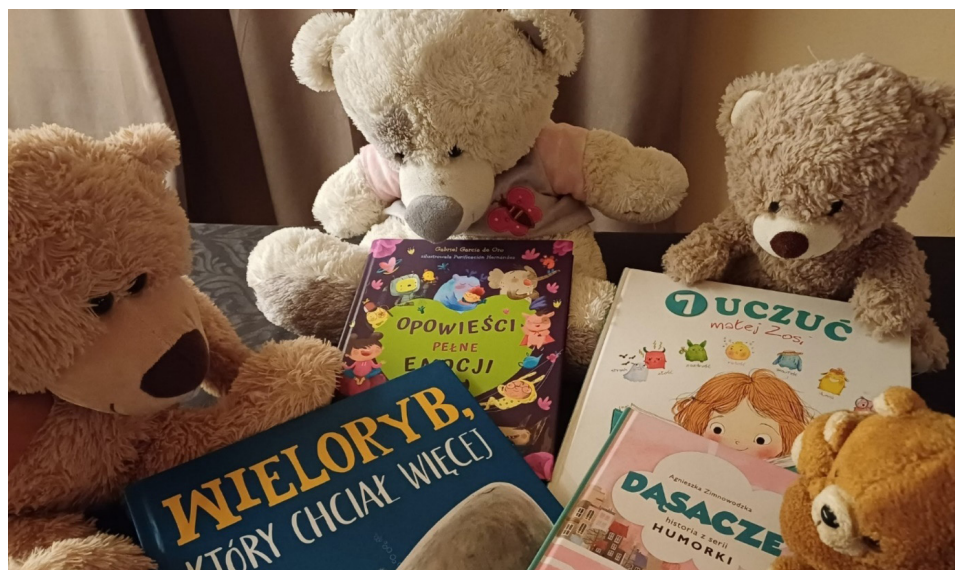
Fot. 2.

Opisane przykładowe spotkania wraz z wieloma innymi prowadzonymi na przestrzeni kilku lat pokazały, jak ważne jest przybliżanie dzieciom tematu emocji i uczuć, które w nich są. Uświadamiały dzieciom, że mamy prawo przeżywać emocje, że właściwie nie ma złych uczuć i emocji, ale ważne, aby umieć je rozpoznawać i znajdować sposoby radzenia sobie z ich konsekwencjami. Czytanie dzieciom takich książek i historii, które dotyczą uczuć, rozwija w nich empatię, pozwala lepiej komunikować się z rówieśnikami, daje poczucie świadomości swoich uczuć, a także pobudza umysł i wyobraźnię dziecka do rozwoju. Połączenie na zajęciach czytania z aktywnym i świadomym dialogiem dzieci przez rysowanie, plakaty, zabawę, rozmowę daje szansę na nauczenie małych czytelników, że książka może nam pomagać w naszych trudnościach oraz że dzięki niej możemy się dobrze bawić, rozumieć świat i siebie.