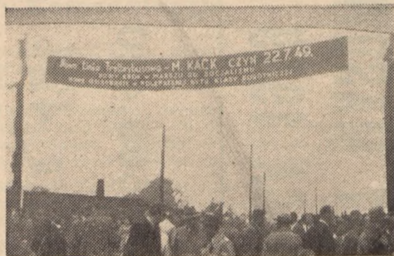
Z uroczystości otwarcia linii komunikacyjnej Gdańsk — Gdynia, do dzielnicy robotniczej.