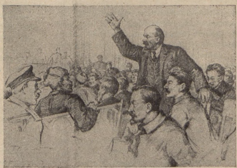
Lenin przemawia na I Zjeździe Rad w czerwcu 1917 r. Obok siedzą od lewej: Dzierżyński, Stalin i Świerdłow.

Była to pierwsza w dziejach rewolucja, która ustanowiła rządy większości w miejsce rządów garstki obszarników i kapitalistów. Tow. Stalin powiedział: „...Rewolucja Październikowa zapoczątkowała nową epokę, epokę rewolucji proletariackich w krajach imperializmu, nastąpiła era rewolucji wyzwoleniczych w koloniach i krajach