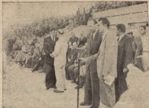
Defilada sportowców w czasie imprez sportowych na naszym III Zjeździe przed Min. Mijalem.

Widel: Ogniwo — Kraków został zdyskwalifikowany dożywotnio przez Zarząd Klubu, za niewłaściwe zachowanie na mistrzostwach Polski.