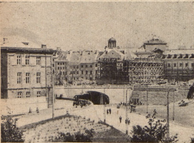
Warszawa. Wjazd do tunelu na Trasie W—Z.

„Lud Warszawy, budujący z uporem i niezwykłą ofiarnością swoje ukochane miasto, godzien jest nie tylko uznania, ale — i podziwu i jak największej pomocy, będącej obowiązkiem całego kraju. Hasło: „Cały naród buduje swoją Stolicę“ — musi stać się własnością całego społeczeństwa polskiego.“