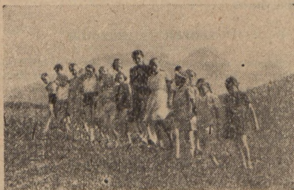
Dzieci na koloniach letnich. Zabawa w górach.

Takie są zasadniczo zadania punktów kolonijnych A.S., ale tu, czy ówdzie nasze sympatyczne roześmiane pociechy samorzutnie garną się do pracy, której na wsi, zwłaszcza w lecie, jest przecież tak wiele, a kontakt bezpośredni z miejscowym środowiskiem — tak miły i pociągający.