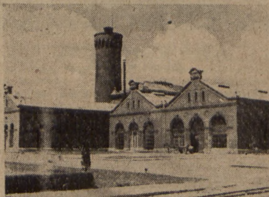
Fragment urzędzeń Filtrów Warszawskich.

Wielkie uznanie zyskał sobie we Wrocławiu pracownicy zakładów komunikacyjnych urządzeniem pierwszego w Polsce żłobka na kółkach. Wóz posiada 4-piętrowe „kojce“ dla młodszych dzieci i 24 podwójne kojce dla raczkujących. Zabiera on co rano dzieci z różnych punktów miasta do dziecińca, a po południu odwozi je do pracujących matek.