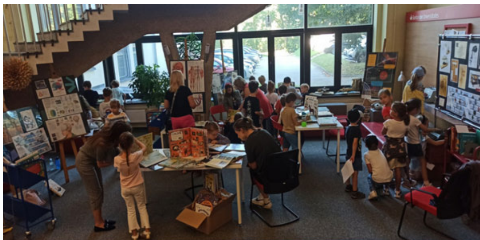
Fot. 2. Wystawa, fot. I. Mielniczuk.

Podczas 5 dni XIX Lubelskiego Festiwalu Nauki wystawę odwiedziło 20 zorganizowanych grup uczniów reprezentowanych przez klasy 0–8 szkół podstawowych z Lublina i okolic, przedszkolaki oraz osoby prywatne zainteresowane literaturą dziecięcą. W sumie wystawę odwiedziło 431 osób.