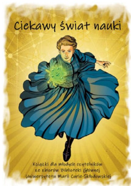
Fot. 1. Plakat reklamujący wystawę, autorstwa I. Mielniczuk i M. Zawady, zamieszczony na witrynie internetowej BG UMCS oraz ustawiony na wejściu przed wystawą.

Książki zaprezentowano na stołach i mobilnych ekspozytorach w kilku blokach tematycznych, np. astronomia, medycyna, historia itp. Przy każdym przygotowano tablice z ciekawymi informacjami oraz postaciami ze świata nauki. Uzupełnieniem prezentowanych pozycji książkowych był stary sprzęt techniczny w postaci dwóch telefonów tarczowych oraz maszyn do pisania. Dla odwiedzających przygotowano strefę relaksu, w której można było odpocząć i poczytać. Obok znajdował się kącik plastyczny, w którym najmłodszy odwiedzający mieli możliwość uwiecznienia wrażeń z wystawy. Pozostawione przez nich dzieła były prezentowane na specjalnej tablicy umieszczonej obok wystawy.