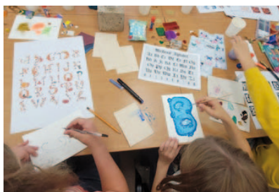
Fot. 2. Warsztaty „Iluminowany inicjał”