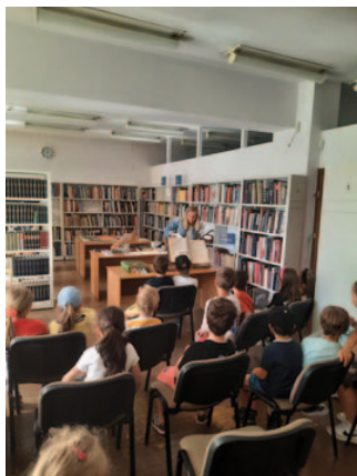
Fot. 4. „Prezentacja Oddziału Zbiorów Specjalnych”.

sztuki, wzbudziło ciekawość, refleksję i zdumienie. Nierzadko wyrażane – zwłaszcza przez dzieci – w bardzo angażujący i ekspresyjny sposób.