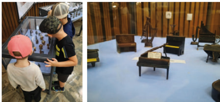
Fot. 5–6. Wystawa „Małeńkie cudenka – niezwykła pasja kolekcjonera temperówek”

Ogromnym zainteresowaniem cieszyła się wystawa „Małeńkie cudenka – niezwykła pasja kolekcjonera temperówek”. Odwiedziło ją 397 osób, z czego 273 zarejestrowanych, co usytuowało ją na drugim miejscu pod względem popularności spośród projektów realizowanych na UMCS 14 . Ekspozycja przez mgr Annę Bogowską kolekcja Pani Alicji Juszcak objęła 187 przepięknych temperówek, imitujących m.in. militaria, środki transportu, instrumenty muzyczne czy dawny sprzęt codziennego użytku, jak kredensy, maszyna do szycia czy młynek do kawy, który zapoczątkował zbiór. Unikatowe temperówki o doskonale odwzorowanych detalach zostały wykonane ze stopu metali i tworzywa, a niektóre w całości z miedzi. Niezwykła precyzja szczegółów i ruchome elementy, takie jak: szufladki, korbki, pokręta i drzwiczki, dodały im autentyczności. Producentami eksponatów byli m.in.: Play me – hiszpańska firma z lat 70. czy Renington. Niektóre modele powstały w Hong Kongu. Pochodzenie temperówek nie wpłynęło na wrażenia wizualne prezentowanej kolekcji, ponieważ selekcja pod kątem zbliżonej stylistyki była kluczem odpowiadającym za jej spójność 15 .