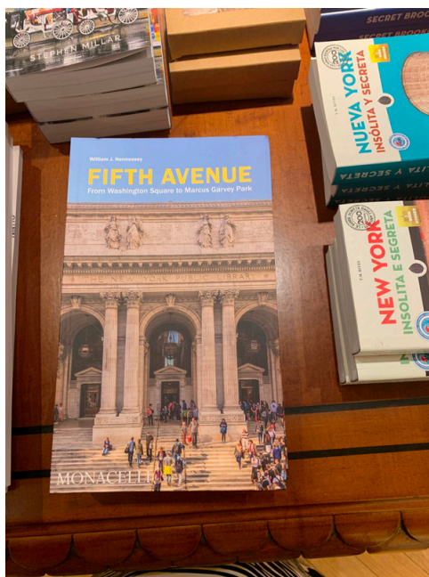
Fot. 8. Oferta sklepu w Bibliotece, fot. A. Strumińska.

Biblioteka posiada również swój sklep. Można tam kupić książki, kalendarze, a także różne gadżety pamiątkowe.