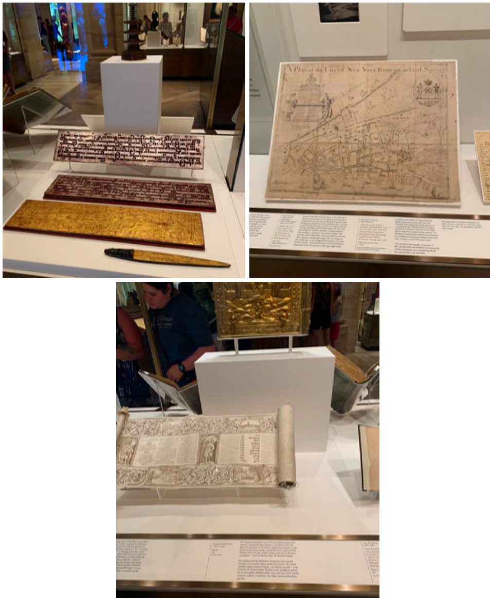
Fot. 7. Zbiory Nowojorskiej Biblioteki

Thomasa Jeffersona, oryginalny list Admirała Floty – Krzysztofa Kolumba do króla Hiszpanii z 15 lutego 1493 roku o tym, że odkrył Amerykę 3 .