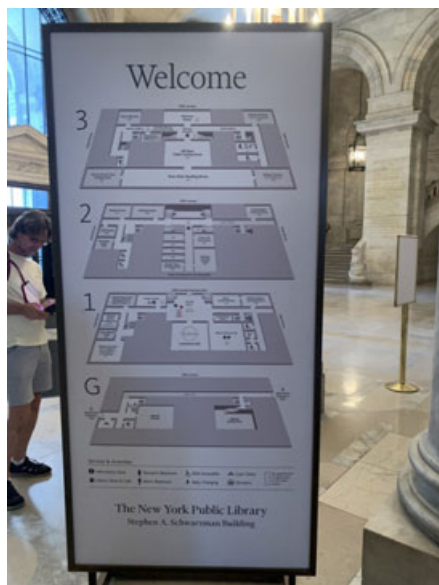
Fot. 2. Plan zwiedzania Biblioteki, fot. A. Strumińska.