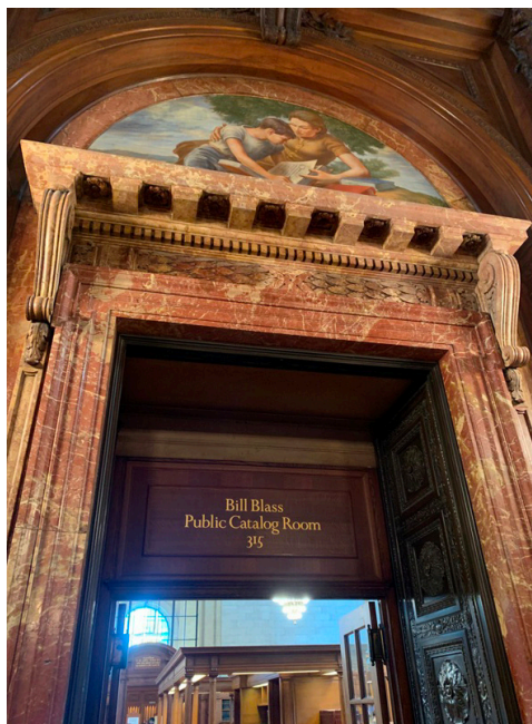
Fot. 4. Sala katalogowa Biblioteki, fot. A. Strumińska.

Od bibliotekarzy pracujących w Nowojorskiej Bibliotece dowiedziałam się, jak można korzystać z jej zbiorów. Otóż członkiem biblioteki z możliwością wypożyczenia książek może zostać osoba, która ma miejsce zamieszkania w Nowym Jorku, natomiast z czytelni może korzystać każdy, po uprzedniej rejestracji. Biblioteka ma również ofertę dla niezarejestrowanych czytelników. Naprzeciw głównej czytelni znajduje się sala do pracy, do której można wejść z ulicy i w ciszy czytać, niezależnie od tego, czy jest się zapisanym do biblioteki. Na drugim piętrze znajdują się trzy indywidualne czytelnie, z których korzystają naukowcy, badacze i pisarze. Jeśli ktoś chciałby popracować indywidualnie, to Biblioteka przydzieli wam taką salę, a nawet przyzna stypendium na interesujące badania, a do tego nie trzeba być nowojorczykiem.