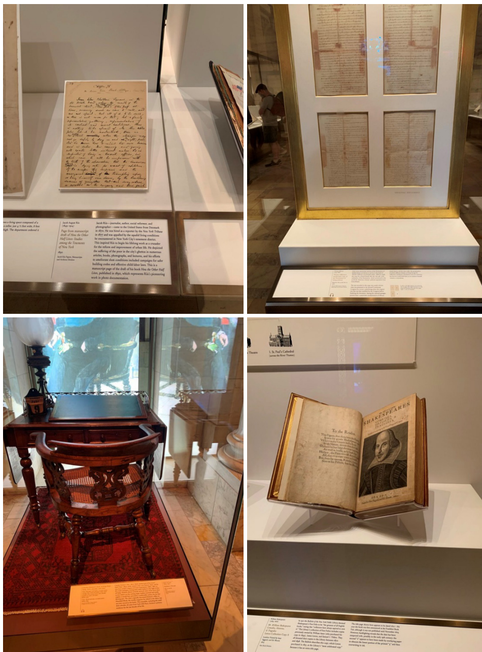
Fot. 6. Zbiory Nowojorskiej Biblioteki, fot. A. Strumińska.

W zbiorach Nowojorskiej Biblioteki Publicznej znajduje się wiele cennych dzieł, takich jak: Biblia Gutenberga czy rękopis Deklaracji Niepodległości napisany przez