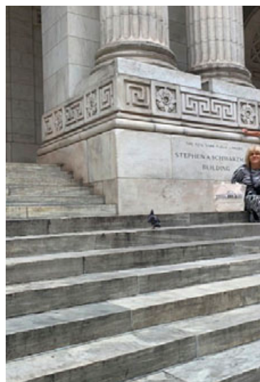
Fot. 1. The New York Library.