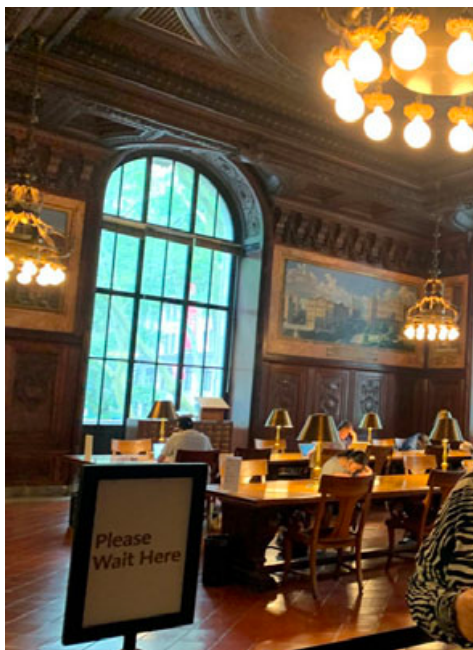
Fot. 5. Czytelnia Biblioteki

Biblioteka ma również ofertę dla najmłodszych. W podziemiach budynku znajduje się czytelnia dla dzieci. Wejścia do niej chroni lew wykonany z klocków lego. Najważniejszym eksponatem tej części biblioteki są pluszaki. Od 1987 roku w Nowojorskiej Bibliotece mieszka Kubuś Puchatek i jego przyjaciele: Prosiaczek, Kłapouchy, Kangurek i Tygrysek. Jak się dowiedziałam, to oryginalne maskotki małego chłopca Christopa Robina Milne, które stały się inspiracją dla jego Taty – Alana A. Milne do napisania najsłynniejszej i najpiękniejszej na świecie książki dla dzieci.