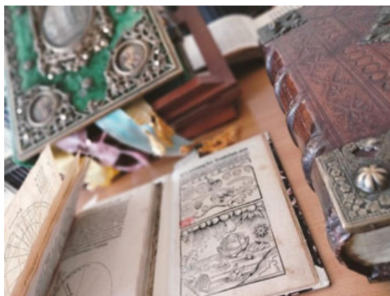
Fot. 2. Prezentacja starodruków gromadzonych w Oddziale Zbiorów Specjalnych, fot. A. Mikulska.

imponującą liczbę uczestników, pragnących poszerzać horyzonty w świecie nauki i sztuki. Temat przewodni tegorocznej edycji „Nauka dla przyszłości” eksponował wartość badań naukowych i innowacyjnych rozwiązań technologicznych wynoszących ludzkość ku nieznanym i niedostępnym wcześniej obszarom. Hasło wiodące festiwalu zainspirowało również społeczność Biblioteki Uniwersytetu Marii Curie-Skłodowskiej w Lublinie do twórczego wglądu w bogate zasoby księgozbioru, stanowiącego zarówno cenną bazę dydaktyczną, jak i świadectwo rozwoju człowieka w wielu dziedzinach naukowych oraz artystycznych. Wydarzenia o charakterze wystawienniczym oraz warsztatowym zorganizowane na terenie Biblioteki kierowały uwagę odbiorców ku atrakcyjnie wydany pozycjom wydawniczym, wprowadzającym młodych czytelników w świat nauki. Mimo iż hasło przewodnie prowadziło myśl ku przyszłości, nie pominięto zasobów o wartości historycznej, dokumentów rękopiśmiennych o znamionach pierwszych naukowych publikacji i pierwszych przykładów druku, obrazujących rozwój nauki na przestrzeni wieków.