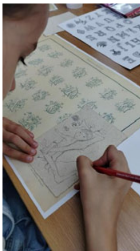
Fot. 9. Precyzyjne szkicowanie projektu, fot. A. Mikulska.

Warsztaty cieszyły się dużym zainteresowaniem, a uczniowie we wszystkich grupach wiekowych wykazali się zaangażowaniem podczas realizacji zadań, korzystając z wiedzy uzyskanej podczas części wprowadzającej. Młodszy uczestnicy pomimo wyższego stopnia trudności związanego z początkami nauki pisania wyróżniali się dużą kreatywnością. Praca dzieci przebiegała dwutorowo – część uczniów skoncentrowała się na pierwszym etapie projektowania inicjału i tworzeniu szkicu, starając się zagospodarować całą powierzchnię kartki i wielokrotnie nanosząc poprawki. Wśród pozostałych „iluminatorów” w akcie twórczym dominowała spontaniczność i odważna ekspresja przy zastosowaniu łączonych materiałów, jak farby, brokat, elementy dekoracyjne. We wszystkich grupach wiekowych ważnym czynnikiem okazało się wskazywanie etapów pracy oraz określanie ram czasowych dla poszczególnych części zadania. Pomocą metodyczną dla prowadzących stanowił plan pracy w formie opracowanego autorskiego scenariusza zajęć, jako punkt odniesienia pomocny przy moderowaniu działań uczniów. Przewidywany czas zajęć wynosił 60 minut, co wymuszało intensywne tempo pracy, wydawało się jednak optymalne z uwagi na możliwości utrzymania uwagi całej grupy.