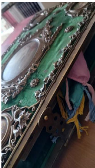
Fot. 4. Biblia w kunsztownie wykonanej oprawie, fot. A. Mikulska.

Duże wrażenie wywarła prezentacja najstarszych zasobów bibliotecznych, sięgających początków rozwoju druku, jak Biblia w przekładzie Marcina Lutera z 1686 roku o objętości około 4 tysięcy stron i wadze kilku kilogramów. Imponujące księgi oprawne w okładki wykonane z desek pokrytych tłoczoną skórą czy aksamitnym sukniem i opatrzonych dekoracyjnymi okuciami zaintrygowały odwiedzających, zapraszając do refleksji nad wartością oraz rozwojem książki w aspekcie historycznym i kulturalnym.