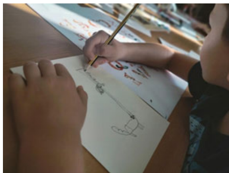
Fot. 6 . Projektowanie inicjału, fot. A. Mikulska.

Bogactwo fantazyjnych inicjałów oraz wibrujących kolorem wielobarwnych bordiur zainspirowało do działań twórczych uczestników warsztatów kreatywnych, przygotowanych w Oddziale Zbiorów Specjalnych dla zorganizowanych grup szkolnych.