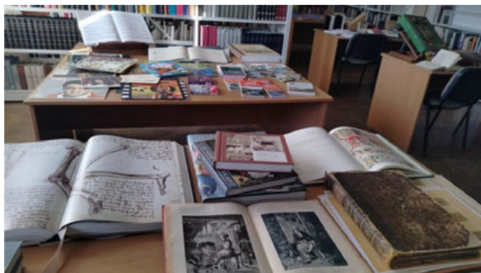
Fot. 3. Prezentacja zróżnicowanych materiałów gromadzonych w Oddziale Zbiorów Specjalnych, fot. A. Mikulska.

bibliotecznych oraz prowadzenia zajęć warsztatowych, przyjmują rolę przewodnika w świecie sztuki. Wybór grupy wiekowej, odbiegającej od standardów statystycznych dla bibliotek naukowych, nie jest przypadkowy. Działaniom tym przyświeca idea wzbudzenia w odbiorcach w wieku szkolnym pozytywnych skojarzeń związanych z miejscem, jakim jest Biblioteka, już na początku ich edukacyjnej drogi. Tworzymy dostępną i przyjazną przestrzeń, zapraszamy do ciekawego świata nauki.