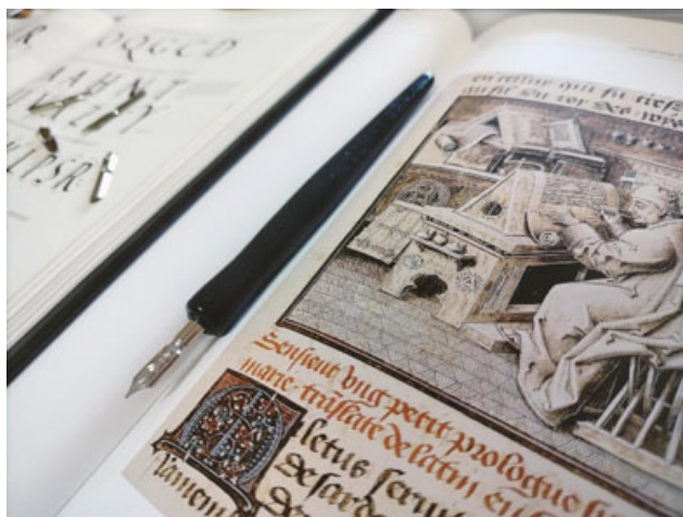
Fot. 1. Przykłady iluminacji i tradycyjnych materiałów piśmienniczych, fot. A. Mikulska.

W dniach 18–24 września 2023 roku Uniwersytet Marii Curie-Skłodowskiej w Lublinie aktywnie włączył się w organizację Lubelskiego Festiwalu Nauki. Dziewiętnasta edycja wydarzenia osiągnęła rekordowe wyniki pod względem zgłoszonych projektów – aż 1758 wydarzeń, prezentacji i warsztatów. Zgromadziła