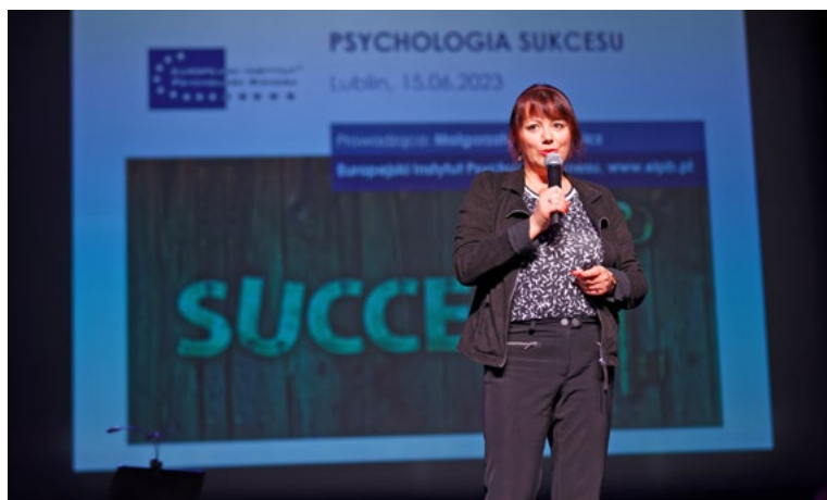
Fot. Bartosz Proll