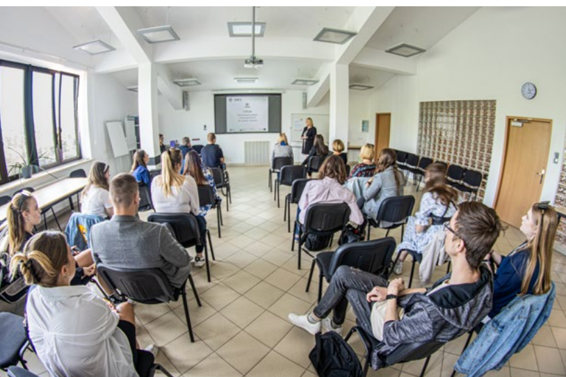
Fot. Michał Zembrzycki