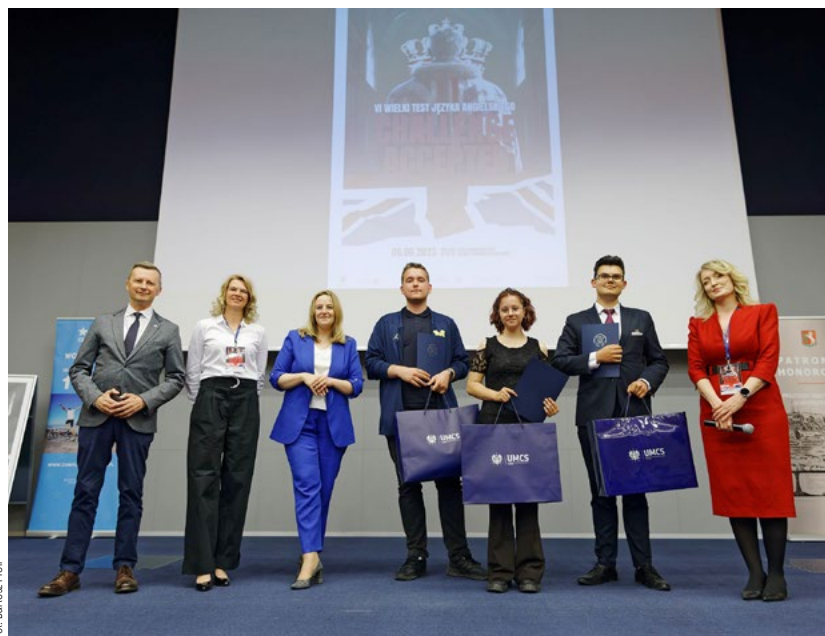
↑ Uczestnicy konkursu