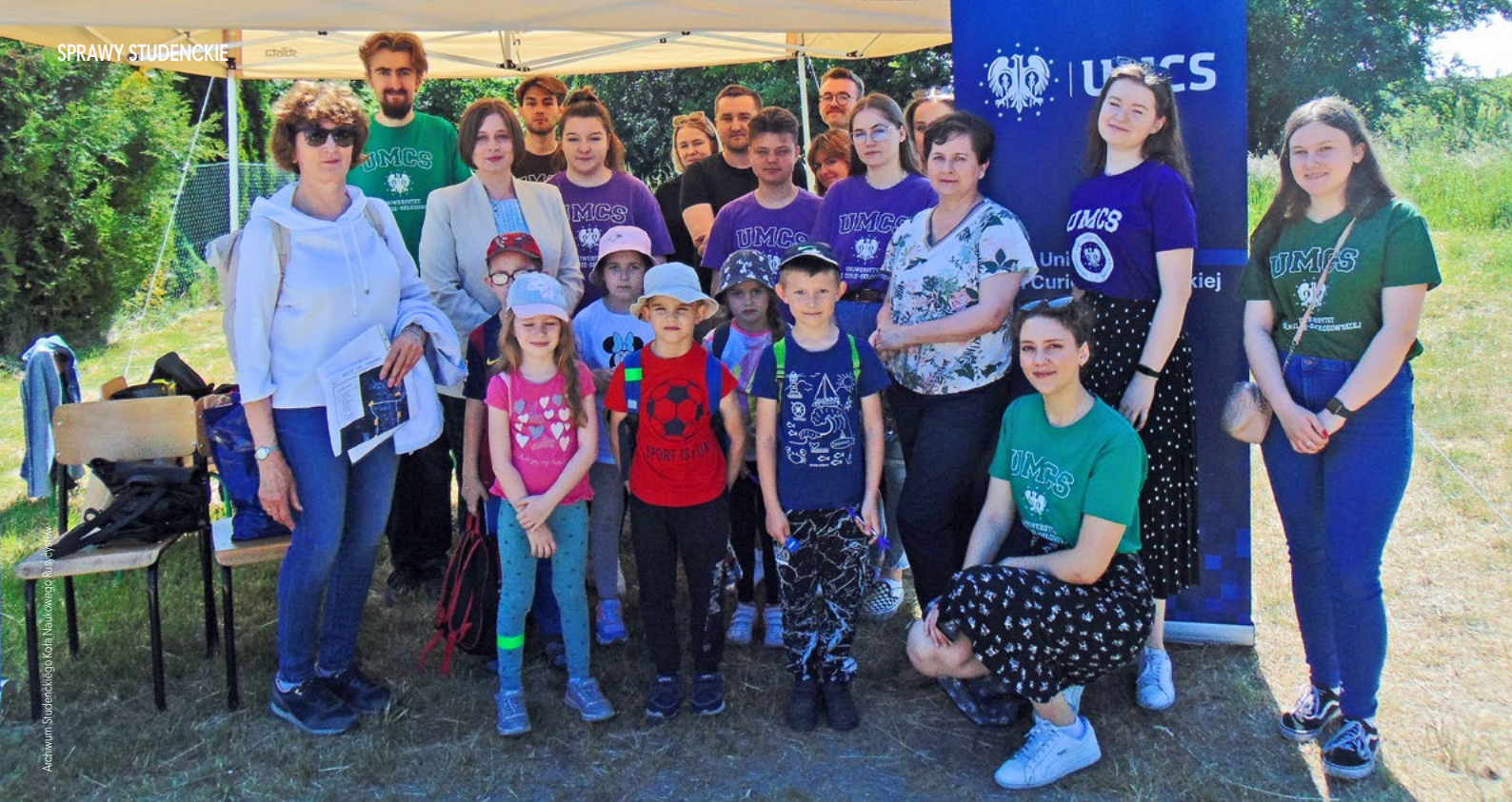
Archiwum Studenckiego Koła Naukowego Rusycystów