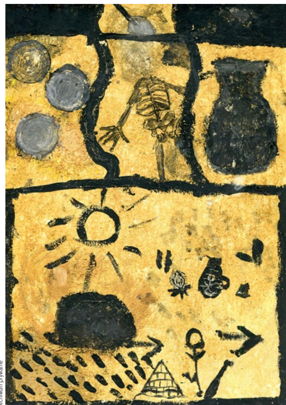
↑ Fot. 2. Praca Anieli Szychty