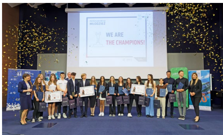
Gala podsumowująca drugą edycję projektu „Przedsiębiorcza młodzież”, 16 czerwca 2023 r.