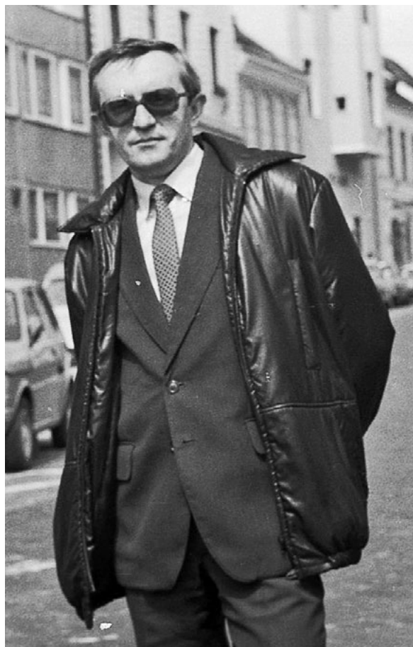
Archiwum Janusza Wrony

Zainteresowania badawcze Profesora koncentrowały się wokół trzech głównych tematów. Pierwszym z nich była kwestia polska w ujęciu polityki austro-węgierskiej w okresie I wojny światowej. Badania te zaowocowały publikacją cenionych monografii: Królestwo Polskie pod okupacją austriacką 1914–1918 (1980), Królestwo Polskie wobec monarchii austrowęgierskiej w latach 1914–1918 (1983) oraz Królestwo Polskie wobec Austro-Węgier: 1914–1918 (1986). Drugi obszar jego zainteresowań stanowi-