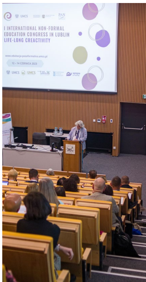
Fot. Krzysztof Filip