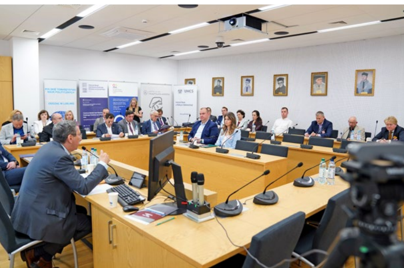
Fot. Igor Kalsinchenko