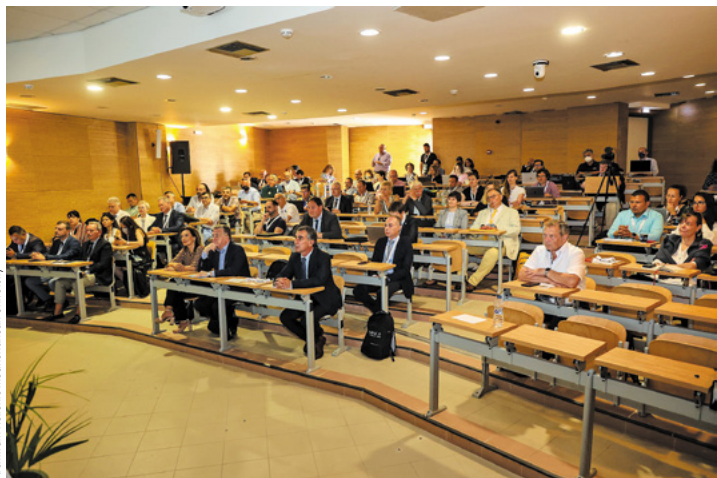
Archiwum Hellenic Mediterranean University