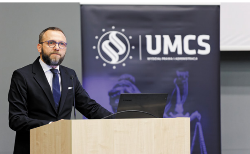
Fot. Bartosz Profil