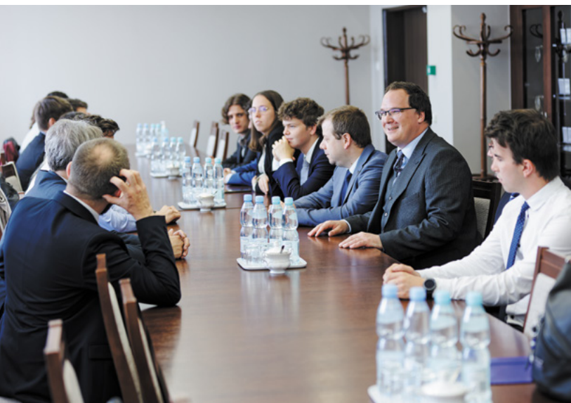
Fot. Bartosz Profil