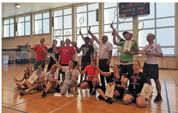
Fot. Piotr Kondraciuk