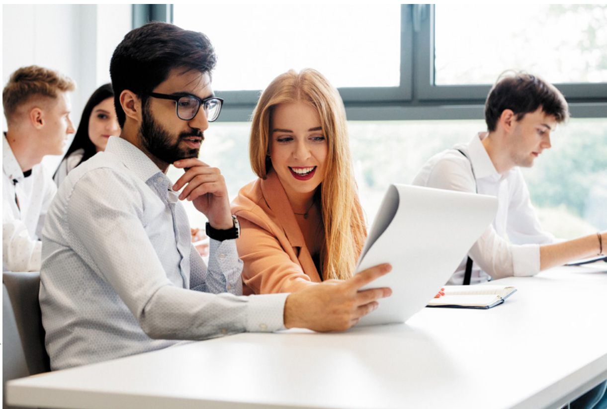
Archiwum Centrum Promocji

strukturach uczelni nastawionych przede wszystkim na kształcenie studentów brakuje jednostek, których celem byłaby organizacja, we współpracy z otoczeniem społeczno-gospodarczym, studiów podyplomowych (interdyscyplinarnych i interdyscyplinarnych) i innych form kształcenia ustawicznego. Mankamentem wielu polskich szkół wyższych jest raczej słabe rozpoznanie potrzeb rynku pracy oraz nieumiejętne kreowanie oferty. Uczelnie proponują to, „co im się wydaje”, że jest właściwe, rzadko odpowiadając na rzeczywiste potrzeby rynku. Stworzenie szerokiej oferty profesjonalnej edukacji w postaci różnorodnych form kształcenia ustawicznego, odpowiadającej na zapotrzebowanie zwłaszcza rynku pracy, staje się więc palącym wyzwaniem.