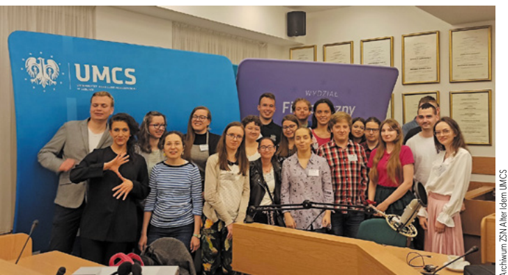
Archiwum ZSN Alter Idem UMCS