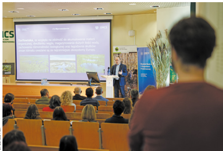
Fot. Bartosz Prohl