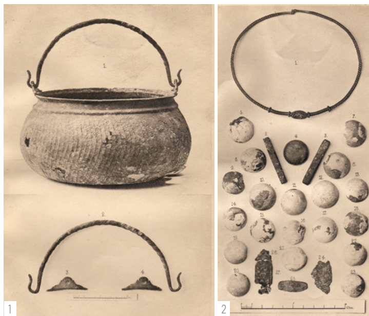
↑ 1. Urna z rzymskiego wiadra z Dorotowa (pow. sępoleński) 2. Elementy planszowej gry hazardowej z Dorotowa (pow. sępoleński)