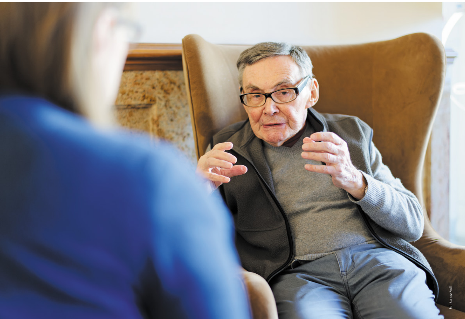
Fot. Barbara Pohl

A czym? Jedyłą dostępną nam walutą był chleb. Zażądali ode mnie trzech porcji chleba. Gdybym ja sam miał je oddać, to bym umarł, bo nie wytrzymałbym trzech dni bez chleba. Wtedy grupa, z którą byłem, kolektyw moich towarzyszy zdecydował, że każdy odda jedną trzecią porcji chleba po to, żebym ja mógł zakupić te okulary. Ta moja historia pokazuje, że nawet w piekle jest możliwa solidarność i w tym jest nadzieja. Właśnie w tej ludzkiej solidarności widzę wielką nadzieję.