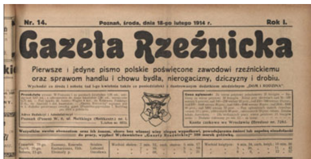
Ryc. 3.

Następny element winyety to informacje o częstotliwości. W pierwszym roczniku jest nieregularna – dwa razy w tygodniu: co środę i sobotą od numeru 1. do 19., trzy razy w tygodniu: co poniedziałek, środę i sobotą od numeru 20. do 76., ponownie dwa razy: co poniedziałek i czwartek w numerach 77. i 78. oraz co środę i sobotą od numeru 79. do 111. Numery od 104. do 107. pomimo oznaczenia: co środę i sobotą wydawane były 1 raz w tygodniu, w soboty. W tej części występuje informacja o dodatku niedzielnym „Dom i rodzina” w numerach: od numeru 2. (7 stycznia 1914) do numeru 69. (18 lipca 1914). Od numeru 72. brakuje dodatku niedzielnego. W 1918 r. gazeta była wydawana regularnie jako tygodnik co sobotę. Niżej zamieszczono dwie ramki z informacjami, po lewej stronie warunki przedpłat, adres redakcji i administracji, po prawej ceny ogłoszeń, rabaty stosowane przy ogłoszeniach większych i stałych oraz numer konta czekowego we Wrocławiu i Wiedniu. Pomiędzy ramkami znajduje się rysunek podobny do tego, który widnieje na pieczęci Cechu Rzeźników w Poznaniu: głowa byka na tle dwóch skrzyżowanych toporów, otoczony ramką. Pod nimi dwa ostatnie elementy występujące w pierwszym roczniku: informacja o ubezpieczeniu abonentów i ich rodzin oraz oddzielony kreską kalendarzyk z informacjami o imieninach, wschodach i zachodach słońca oraz księżycy na najbliższe dni, do następnego wydania.