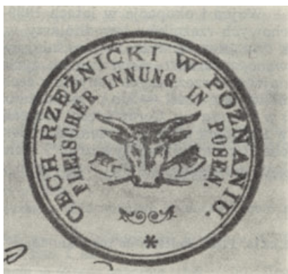
Ryc. 1. Pieczęć Cechu Rzeźników w Poznaniu z 1911 r.

Rzeźnictwo, podobnie jak inne rzemiosła w Polsce, miało strukturę cechową. Dla każdej branży powstawał osobny cech. W dużych miastach było nawet kilkadziesiąt różnych cechów, istniały nieliczne cechy wielobranżowe. Pierwsza wzmianka o cechach rzeźnickich pochodzi z 1235 roku w Środzie Śląskiej. W Poznaniu początkowo istniały dwa cechy rzeźnicze, dwóch grup jatek: starszych murowanych i późniejszych drewnianych o nieustalonej dacie powstania. Pierwszy katalog cechów Poznania z 1440 r. wymienia już dwa cechy. Zjednoczenie obu nastąpiło w 1729 r., powstało „Bractwo Rzeźnicze Poznańskie Jatek Murowanych”, od 1796 r. znane jako „Bractwo Rzeźnicze Poznańskie”. Cech poznański w połowie XIX w. był największym cechem w Polsce liczącym od 272 do 305 członków. Przez cały okres utraty niepodległości w dokumentach cechowych posługiwano się językiem polskim, dopiero od 1880 r. protokoły sprawozdawcze były dwujęzyczne: polskie i niemieckie. Podobnie pieczęć cechu miała napis w dwóch językach. Symbolem organizacyjnej jedności cechu była skrzynia cechowa, w której przechowywano ważniejsze dokumenty oraz pieczęć, łańcuch, buzdygan (berło) i sztandar 14 .