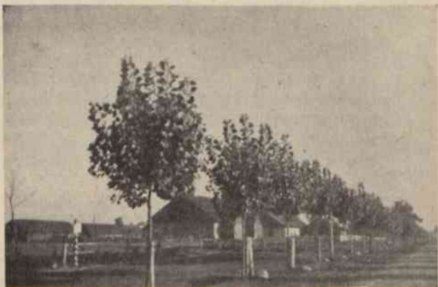
TOPOLA NIEKŁAŃSKA w 6 roku po posadzeniu pow. łuniniecki woj. poleskie.

Uzasadnienie: Rozporządzenie ustawodawcze przewiduje, że wynagrodzenie likwidatorów określa zawsze władza nadzorcza, niezależnie od tego, czy zostali oni powołani przez organ stanowiący związku założycielski, czy przez tę władzę (w wypad-