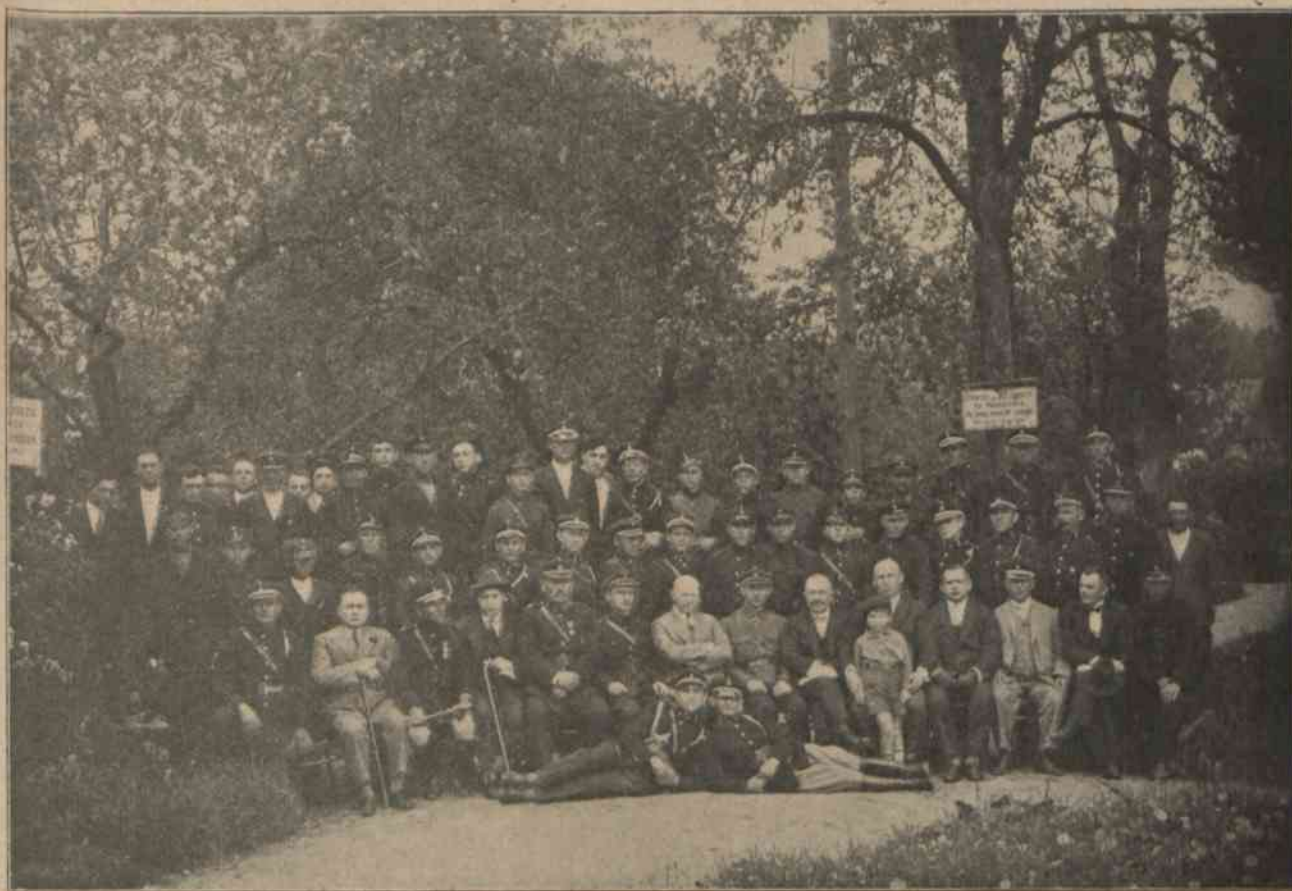
Uczestnicy kursu dla oficerów straży pożarnych, urządzono w Wolkowysku dn. 20 — 27 maja 1928 r. kosztem Sejmiku Wolkowyskiego, z zarządzeniem Wolkowyskiej Ochotniczej Straży Pożarnej i wykładowcami na czele.