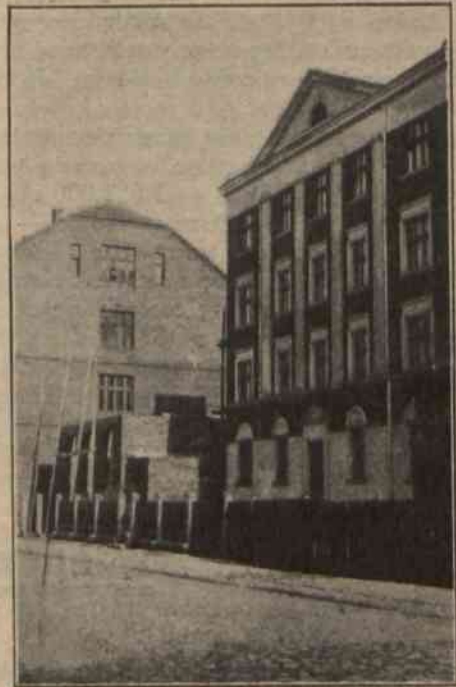
Wybudowany dom dla nauczycieli, oraz budująca się hala gimnastyczna przy gimnazjum w Żyrardowie.

Miejskie władze samorządowe, oceniając wytworzoną sytuację, starały się wielokrotnie o zmianę dotychczasowej polityki Zakładów Żyrardowskich, szkodliwej nie tylko dla miasta, lecz i dla całego państwa. Nie mogąc się doczekać jakichkolwiek pozytywnych rezultatów przedsięwziętej akcji, Rada Miejska i Magistrat zwrócili się drogą wydanego memoriału i prasy do całego społeczeństwa, a przede wszystkim do Rządu, aby poparli ich akcję.