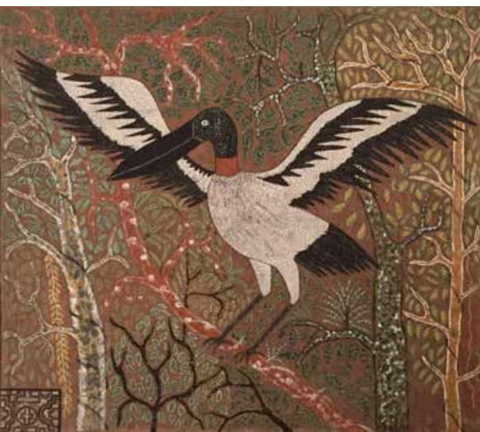
Roldán Pinedo. Tiyoyo . Tintes naturales sobre tela. Colección particular