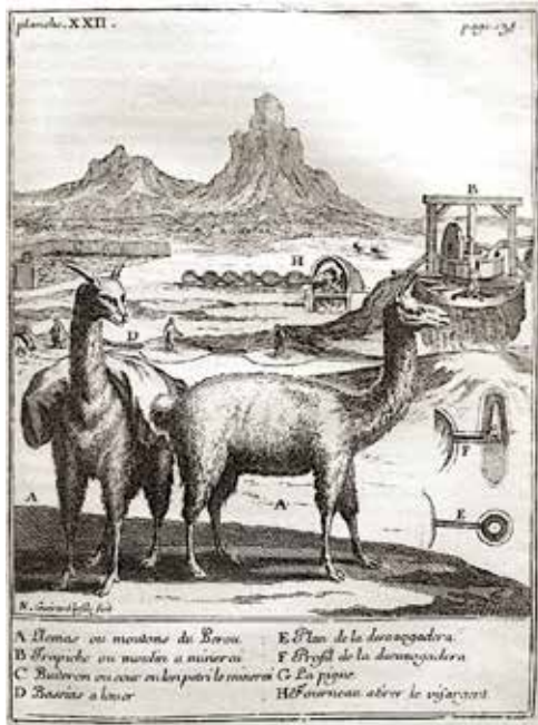
A. F. Frezir. Llamas. Paris, 1732