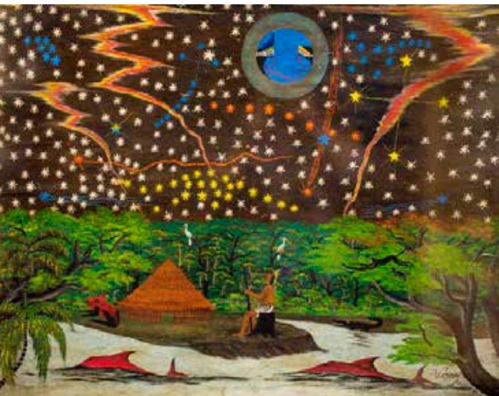
Victor Churay. Mapa de cielo bora . Pintura sobre llanchama. Colección Macera-Carnero, Museo del Banco Central de Reserva