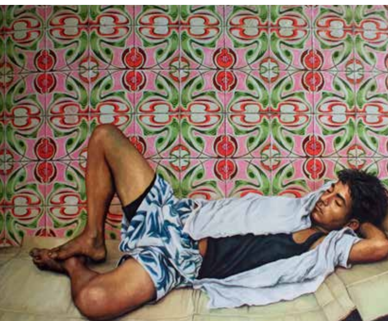
Christian Bendayán. El sueño . Colección Armando Andrade