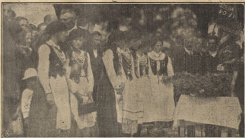
Składanie wieńca podczas uroczystości „Dożynek” w Hrubieszowie.

Mówiąc o wyczekującym niejako, do pewnego stopnia nieufnym stanowisku Sejmików dla początków działalności Kół Młodzieży Wiejskiej, podkreślić należy, że jest to wynikiem takiegoż stanowiska starszego społeczeństwa wiejskiego, rodziców członków Kół.