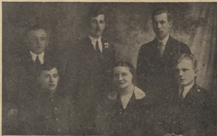
Zarząd Powiatowego Związku Młodzieży Wiejskiej w Puławach.

Członkowie Komisji teatralnej udzielali porad w sprawach teatralnych. Z inicjatywy O. Z. M. W. urządzono wycieczkę Kół dla zwiedzenia Puław.