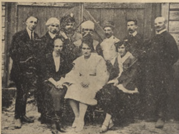
Amatorzy K. Mł. W. w Krzczonowie w „Zagłobie swatem”.

Pozatem staramy się zorganizować swoją szatnię teatralną i na tej drodze jesteśmy daleko. Tak więc 6-go sierpnia ub. r. z okazji odpustu graliśmy „Zagłoba swatem”, i na gwałt potrzebny był drugi kontusz (bo jeden mieliśmy); jedna z pań