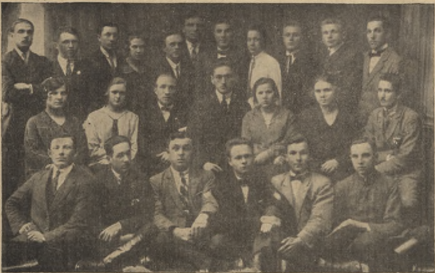
Kurs teatralny Z. M. W. w Lublinie.

Strona fachowa Kursu była powierzona Związkowi Teatrów Ludowych, stroną organizacyjną zajmował się Związek Wojewódzki bezpośrednio. Przy organizacji Kursu trzeba było pokonać cały szereg trudności ze względu na szczupłe środki finansowe z jednej strony i konieczność zapewnienia uczestnikom Kursu bezpłatnych mieszkań i t. p. z drugiej.