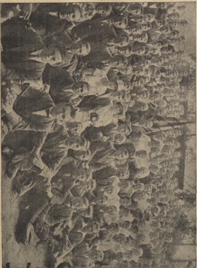
Zjazd Młodzieży Wiejskiej w Lubartowie 1.VI 1925 roku.