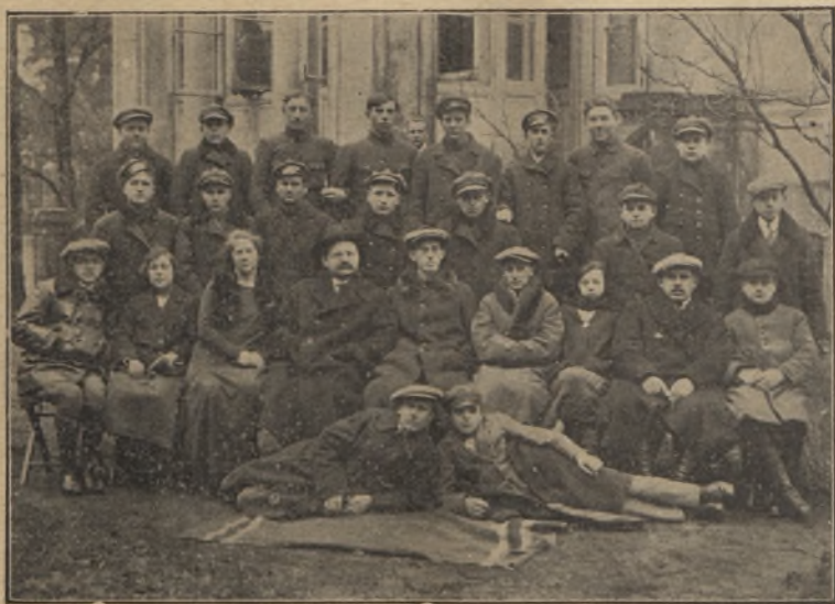
Kurs dla pracowników w Kołach Młodzieży Wiejskiej w Dęblinie.

Sprawozdania złożyły Koła w: 1) Barłogach, 2) Borysowie, 3) Bronicach, 4) Bochońnicy, 5) Dęby, 6) Kurowie, 7) Karcz-miskach, 8) Płonkach, 9) Piotrowicach, 10) Poniatowie, 11) Rze-czycy, 12) Rogowie, 13) Wronowie, 14) Zakrzowie, 15) Kazi-mierzu n/W. 16) Kłodzie, 17) Zabłociu, 18) Łubkach, 19) Śnia-dówce, 20) Braciejowicach, 21) Choszczowie i 23) Niezabitowie. Sprawozdań nie złożyły: 23) Dobrze, 24) Zagrody, 25) Słotwi-