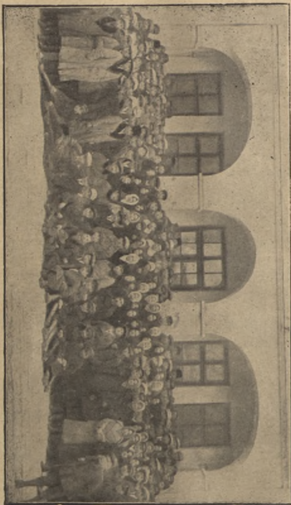
Otwarcie Kursu dla pracowników Kół Młodzieży Wiejskiej w Krasnymstawie.