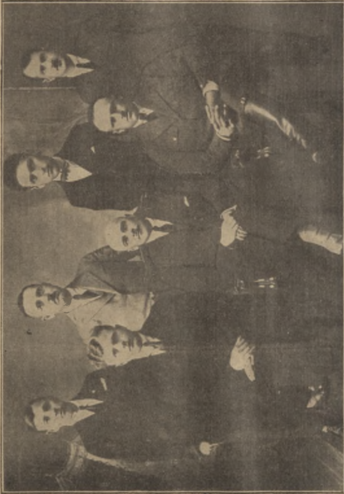
Prezydjum Związku Młodzieży Wiejskiej Województwa Lubelskiego.