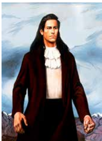
T. Núñez Ureta, Túpac Amaru . Gil de Castro 1820, José de San Martín