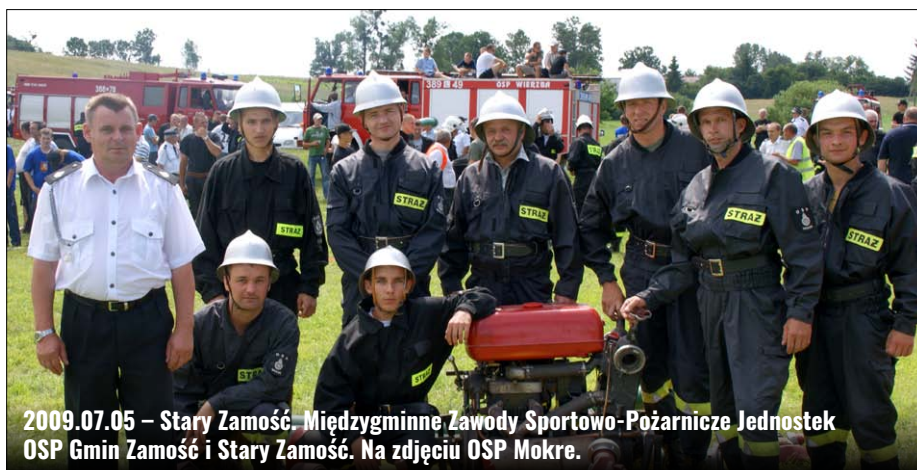
2009.07.05 – Stary Zamość. Międzygminne Zawody Sportowo-Pożarnicze Jednostek OSP Gmin Zamość i Stary Zamość. Na zdjęciu OSP Mokre.