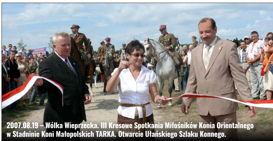
2007.08.19 – Wólka Wieprzecka. III Kresowe Spotkania Miłośników Konia Orientalnego w Stadninie Koni Małopolskich TARKA. Otwarcie Ułańskiego Szlaku Konnego.