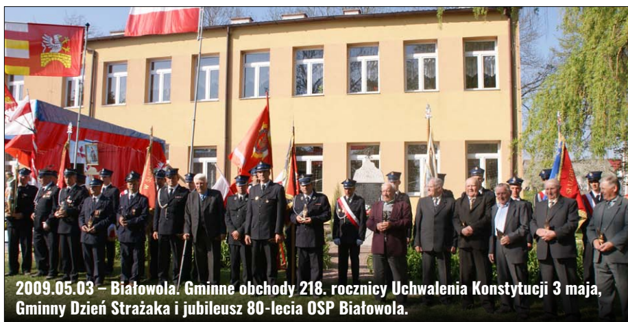
2009.05.03 – Białowola. Gminne obchody 218. rocznicy Uchwalenia Konstytucji 3 maja, Gminny Dzień Strażaka i jubileusz 80-lecia OSP Białowola.