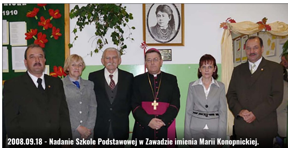
2008.09.18 - Nadanie Szkole Podstawowej w Zawadzie imienia Marii Konopnickiej.