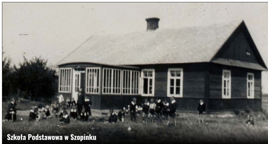
Szkoła Podstawowa w Szopiniku

Jeżeli chodzi o infrastrukturę przyszłości, to w Urzędzie Gminy Zamość opiniowane były projekty planów dotyczące budowy, przez teren łąk należących w części do gruntów wsi Szopinek drogi ekspresowej E17 Lublin – Hrebenne. O tej inwestycji mówi się już od co najmniej 20 lat. Ostatnie informacje wskazują, na jej realizację w najbliższych latach. Opiniowany był tak-