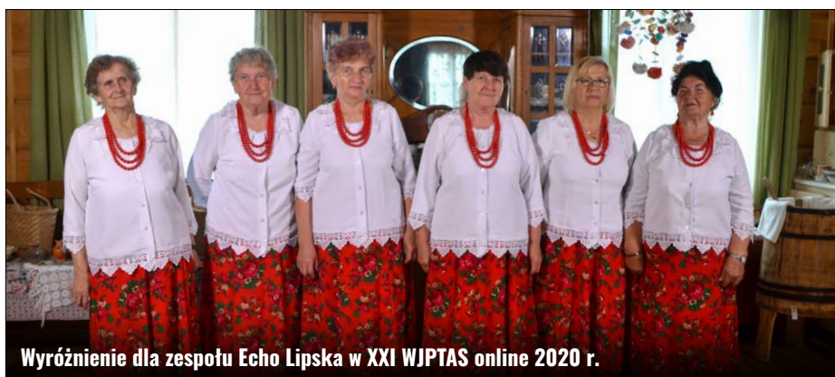
Wyróżnienie dla zespołu Echo Lipska w XXI WJPTAS online 2020 r.