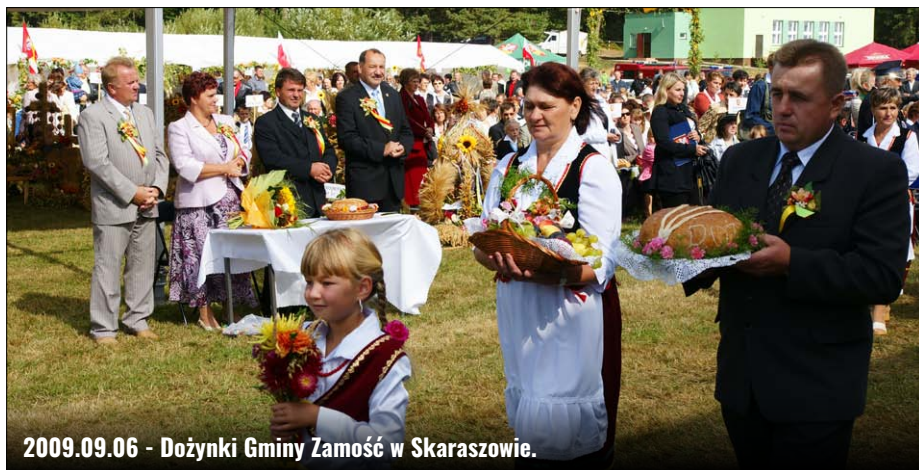
2009.09.06 - Dożynki Gminy Zamość w Skaraszowie.