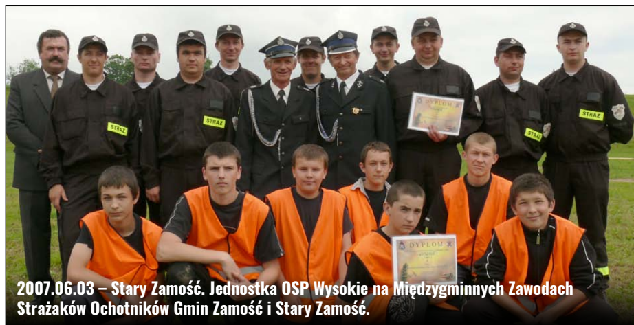
2007.06.03 – Stary Zamość. Jednostka OSP Wysokie na Międzygminnych Zawodach Strażaków Ochotników Gmin Zamość i Stary Zamość.