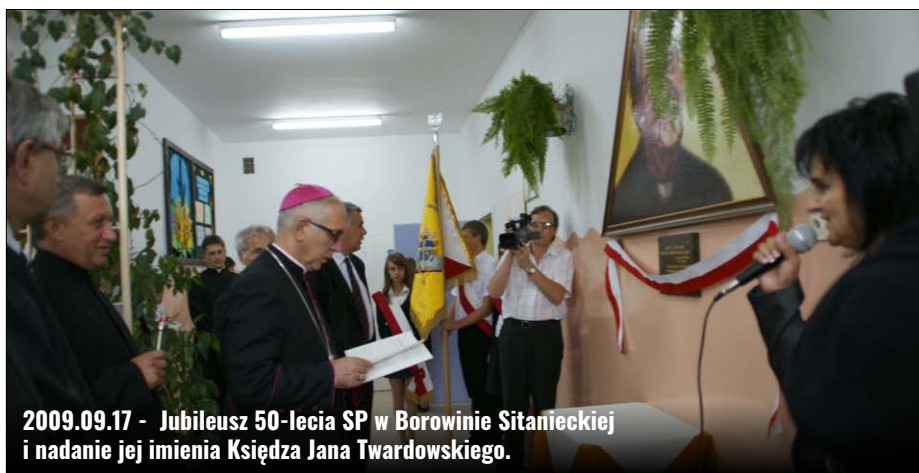
2009.09.17 - Jubileusz 50-lecia SP w Borowinie Sitańskiej i nadanie jej imienia Księdza Jana Twardowskiego.