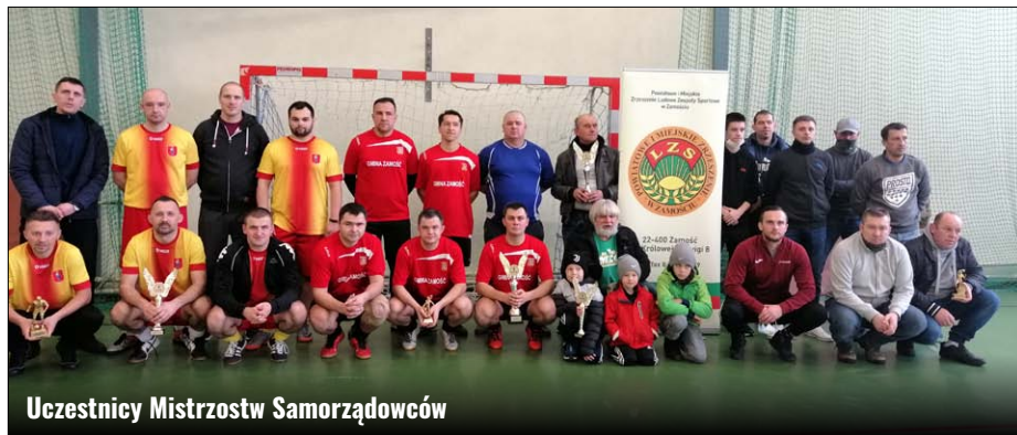
Uczestnicy Mistrzostw Samorządowców

29 listopada 2020 roku, w hali sportowej w Sitańcu, odbyły się XIII Mistrzostwa w Halowej Piłce Nożnej LZS Samorządowców o Puchar Starosty Powiatu Zamojskiego i Prezydenta Miasta Zamość. Ich organizatorem było Powiatowe i Miejskie Zrzeszenie Ludowe Zespoły Sportowe w Zamościu, przy wsparciu finansowym Miasta Zamość, Starostwa Powiatowego w Zamościu oraz organizacyjnym Szkoły Podstawowej w Sitańcu.