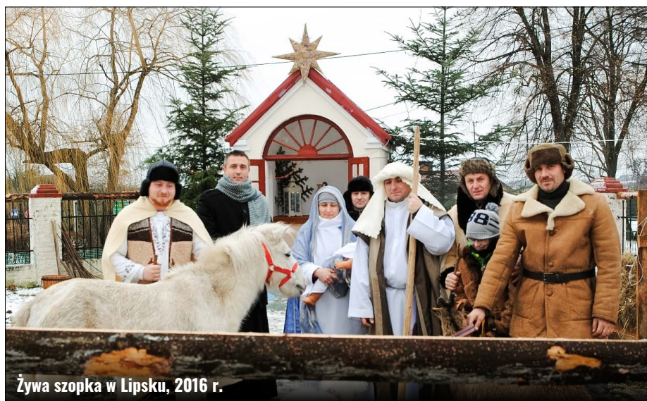
Żywa szopka w Lipsku, 2016 r.

nawzajem po nabożeństwie, nie oszczędzając przy tym kapłana. Upamiętniano w ten sposób patrona tego dnia, świętego Szczepana, pierwszego męczennika, który zginął ukamienowany za wiarę. Owies, przynoszony do poświęcenia, musiał pochodzić z pól gospodarza. Pożyczenie owsa mogło bowiem zaprzepaścić szanse na udane plony. Część ziarna należało zachować ze sobą i po powrocie do domu dodać je do owsa przeznaczonego na zasiewy. Niekiedy gospodarze bezpośrednio