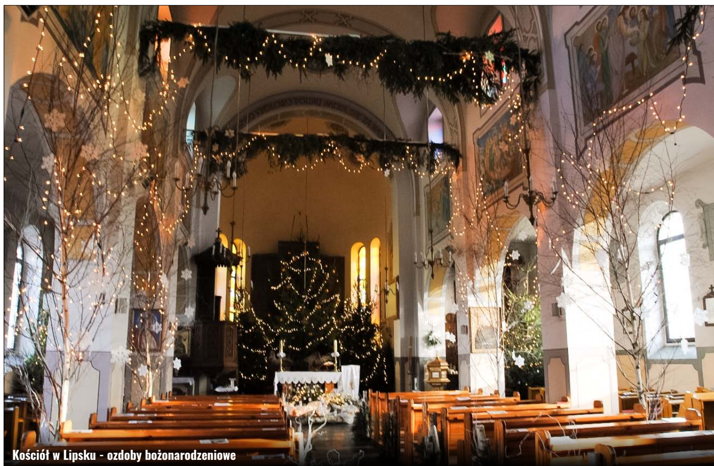
Kościół w Lipsku - ozdoby bożonarodzeniowe

Wyjątkową atmosferę Świąt Bożego Narodzenia buduje mnogość tradycji i związanych z nimi zwyczajów. Już poprzedzający je adwent jest tradycyjnie okresem radosnego oczekiwania i przygotowań. Polskie obchody, zwłaszcza związane z wieczorem wigilijnym, przyciągają coraz większą uwagę ludzi z całego świata ze względu na swój ciepły i rodzinny charakter. Dlatego teraz przybliżymy tu historię i znaczenie ludowych tradycji związanych z Bożym Narodzeniem, których kultywowanie stało się naszą narodową dumą.