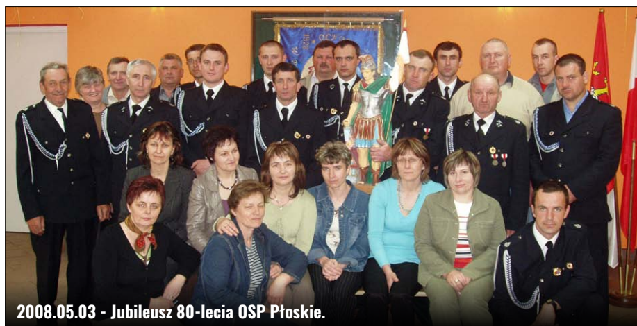
2008.05.03 - Jubileusz 80-lecia OSP Płoskie.