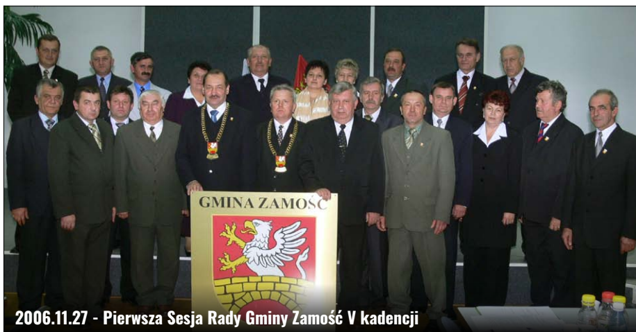
2006.11.27 - Pierwsza Sesja Rady Gminy Zamość V kadencji