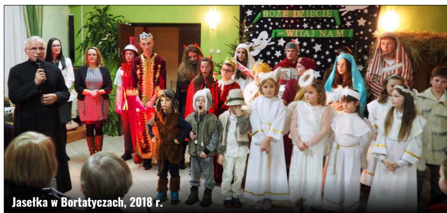
Jasełka w Bortatyczach, 2018 r.

kach ochronnych na twarzach. W ostatnich latach coraz częściej na placach kościelnych czy rynkach miast spotkać można żywe szopki, a w nich na wzór szopki św. Franciszka, prawdziwych ludzi i zwierzęta.