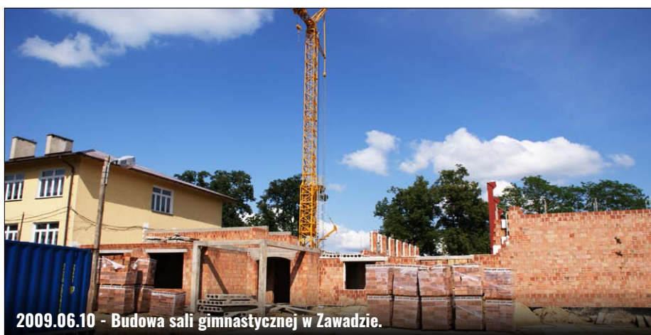
2009.06.10 - Budowa sali gimnastycznej w Zawadzie.