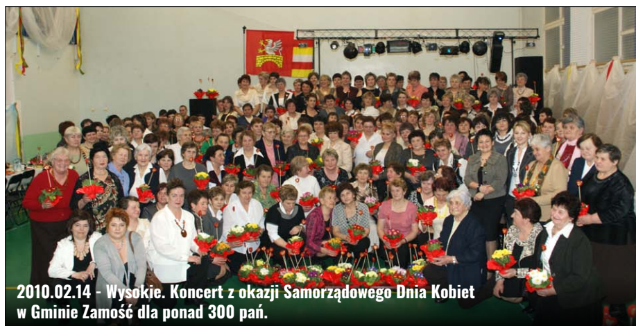
2010.02.14 - Wysokie. Koncert z okazji Samorządowego Dnia Kobiet w Gminie Zamość dla ponad 300 pań.