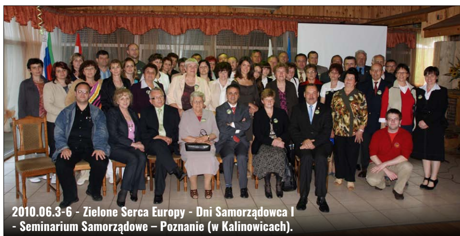
2010.06.3-6 - Zielone Serca Europy - Dni Samorządowca I - Seminarium Samorządowe – Poznanie (w Kalinowicach).