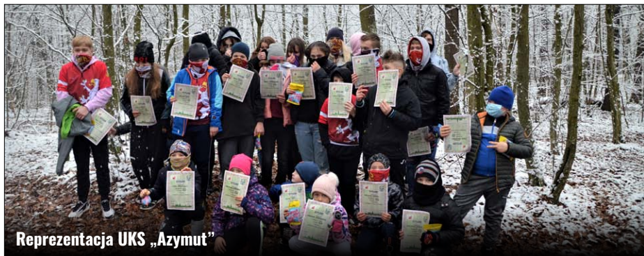
Reprezentacja UKS „Azymut”

W ostatnią niedzielę listopada br. młodzi sportowcy UKS Azymut Siedliska uczestniczyli w „Andrzejkowym Biegu na Orientację”, który został zorganizowany przez Klub Uczelniany AZS UMCS Lublin. Zawody zostały przeprowadzone w lesie koło Nałęczowa. Mimo lekkiego przymrozku oraz ośnieżonych dróg, które utrudniały, szczególnie najmłodszym, orientację w terenie, wszystkim uczestnikom udało się zakończyć bieg w limicie czasu. Na mecie biegu na każdego zawodnika czekała gorąca herbata, a w oczekiwaniu na podsumowanie zawodów był czas na zabawy na pierwszym tej jesieni śniegu. Spośród zawodników Azymutu miejsca na podium