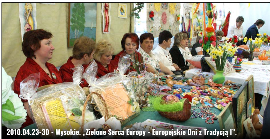
2010.04.23-30 - Wysokie. „Zielone Serca Europy - Europejskie Dni z Tradycją I”.