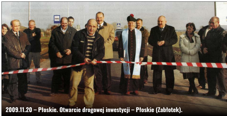
2009.11.20 – Płoskie. Otwarcie drogowej inwestycji – Płoskie (Zabłotek).