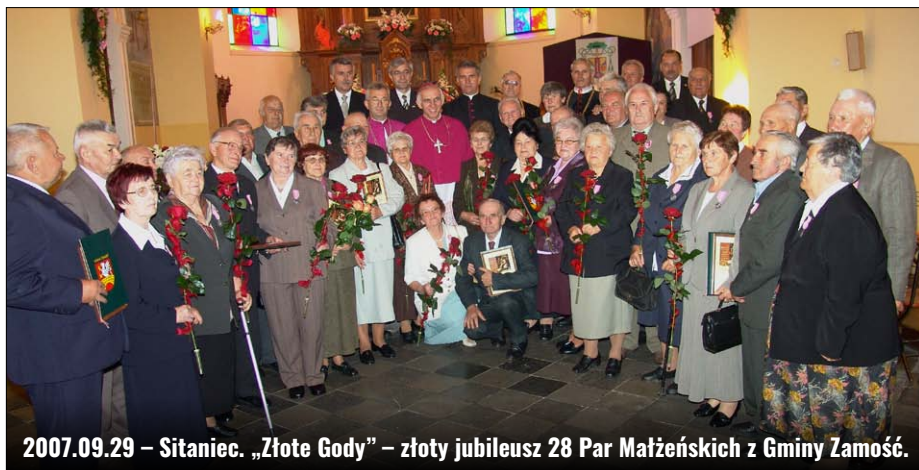
2007.09.29 – Sitaniec. „Złote Gody” – złoty jubileusz 28 Par Matżeńskich z Gminy Zamość.