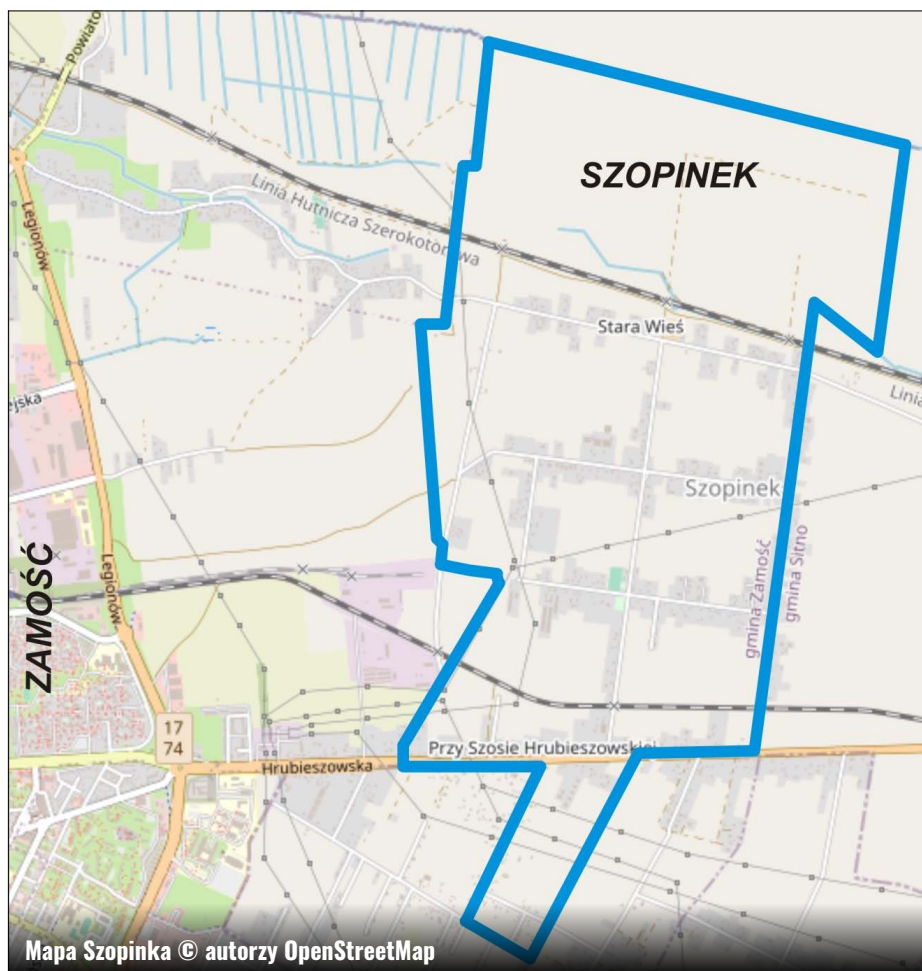
Mapa Szopinika

Już od roku 1998 nie pamiętam, aby jakkolwiek inwestycja w Szopiniku prowadzona była z udziałem mieszkańców, a w moim odczuciu działa się sporo. Odnowiono na-