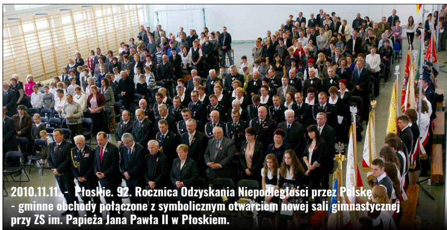
2010.11.11. – Płoskie. 92. Rocznicą Odzyskania Niepodległości przez Polskę - gminne obchody połączone z symbolicznym otwarciem nowej sali gimnastycznej przy ZS im. Papieża Jana Pawła II w Płoskiem.