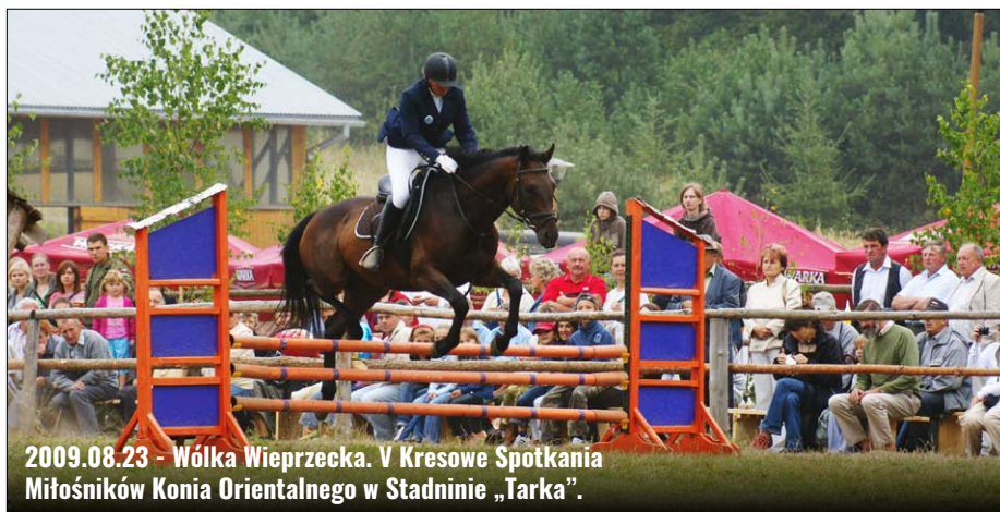
2009.08.23 - Wólka Wieprzecka. V Kresowe Spotkania Mitośników Konia Orientalnego w Stadninie „Tarka”.