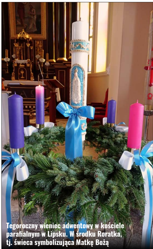
Tegoroczny wieniec adwentowy w kościele parafialnym w Lipsku. W środku Roratka, tj. świeca symbolizująca Matkę Bożą

Adwent (wg języka łacińskiego: adventus – przyjsie) w Kościołach katolickim i ewangelickim oznacza okres oczekiwania na przyjsie na świat, a więc narodzenie Chrystusa. Adwent jednocześnie ma przypominać o zapowiedzianym przez proroków powrocie Chrystusa jako triumfatora nad złem, wskrzesiciela umarłych i sędziego świata. Tradycja adwentowego oczekiwania sięga IV wieku. Przybliżymy tu szerzej historię i znaczenie adwentu w kontekście tradycji Świąt Bożego Narodzenia.