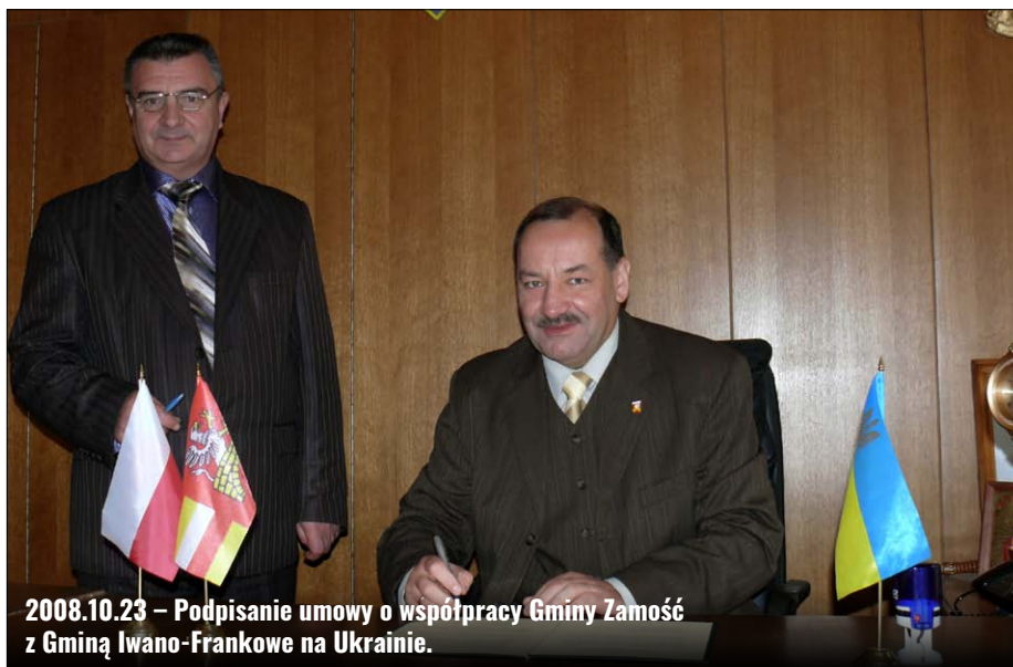
2008.10.23 – Podpisanie umowy o współpracy Gminy Zamość z Gminą Iwano-Frankowe na Ukrainie.