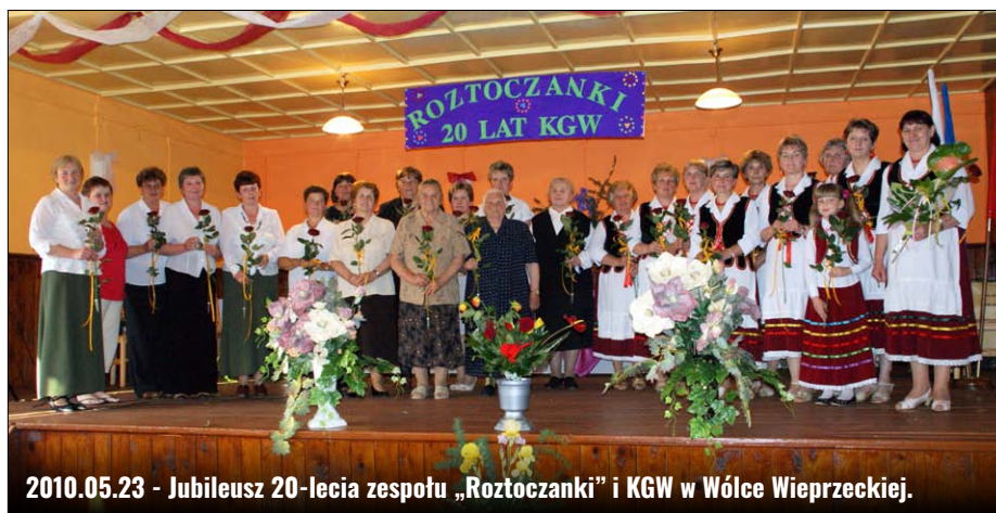
2010.05.23 - Jubileusz 20-lecia zespołu „Roztoczanki” i KGW w Wólce Wieprzeckiej.