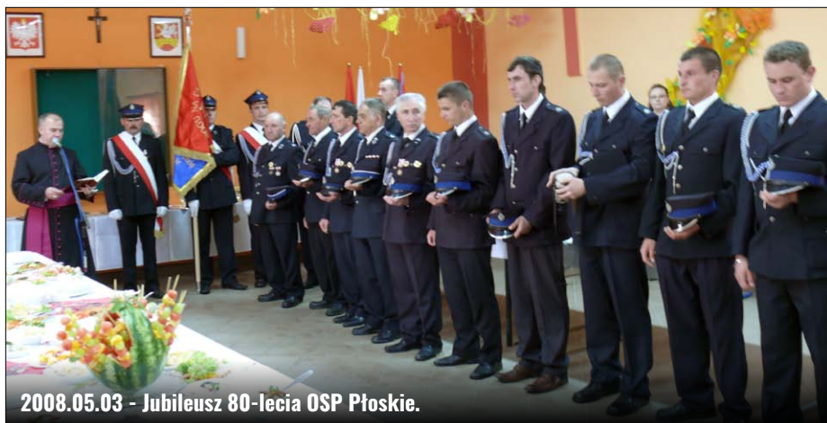
2008.05.03 - Jubileusz 80-lecia OSP Płoskie.