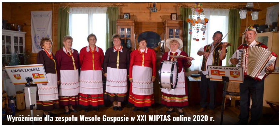
Wyróżnienie dla zespołu Wesołe Gosposie w XXI WJPTAS online 2020 r.