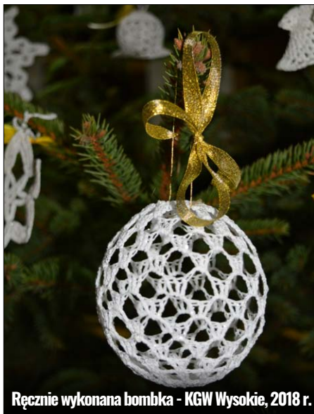
Ręcznie wykonana bombka - KGW Wysokie, 2018 r.

Składniki, wykorzystywane do przygotowania potraw na wigilijny stół, również miały swoje znaczenie. Ziarna zbóż i maku