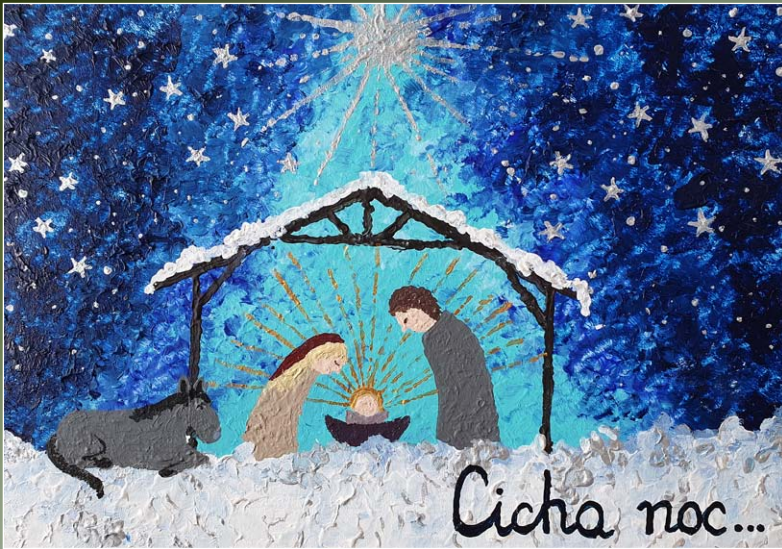
Praca Doroty Orłowskiej