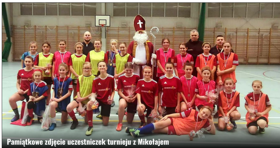
Pamiętkowe zdjęcie uczestniczek turnieju z Mikołajem

Więcej informacji o działalności klubu i kolejnych treningach siatkarek i orientalistów znajduje się na stronie internetowej klubu www.azymutsiedliska.cba . Zapraszamy. Na podstawie przestanych informacji GOK KC