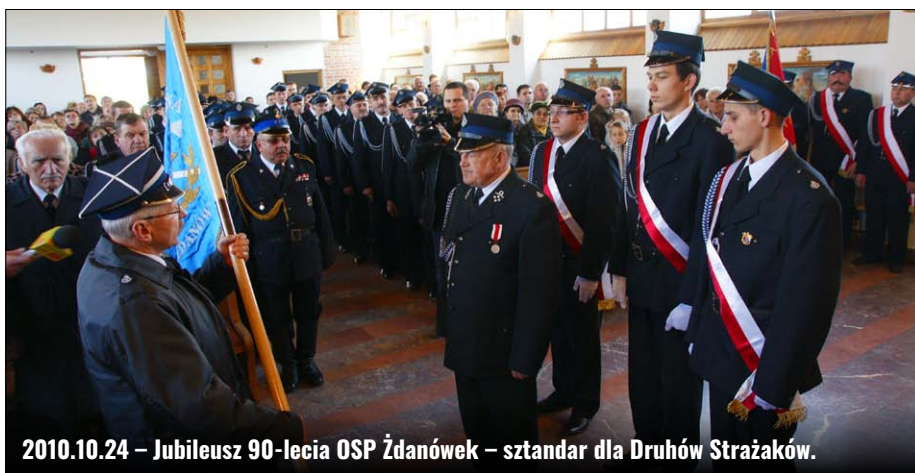
2010.10.24 – Jubileusz 90-lecia OSP Żdanówek – sztandar dla Druhów Strażaków.