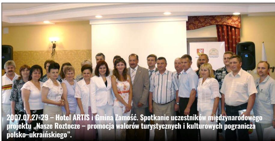
2007.07.27-29 – Hotel ARTIS i Gmina Zamość. Spotkanie uczestników międzynarodowego projektu „Nasze Roztocze – promocja walorów turystycznych i kulturowych pogranicza polsko-ukraińskiego”.