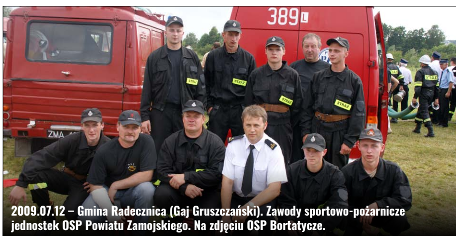
2009.07.12 – Gmina Radecznicza (Gaj Gruszczański). Zawody sportowo-pożarnicze jednostek OSP Powiatu Zamojskiego. Na zdjęciu OSP Bortatycze.