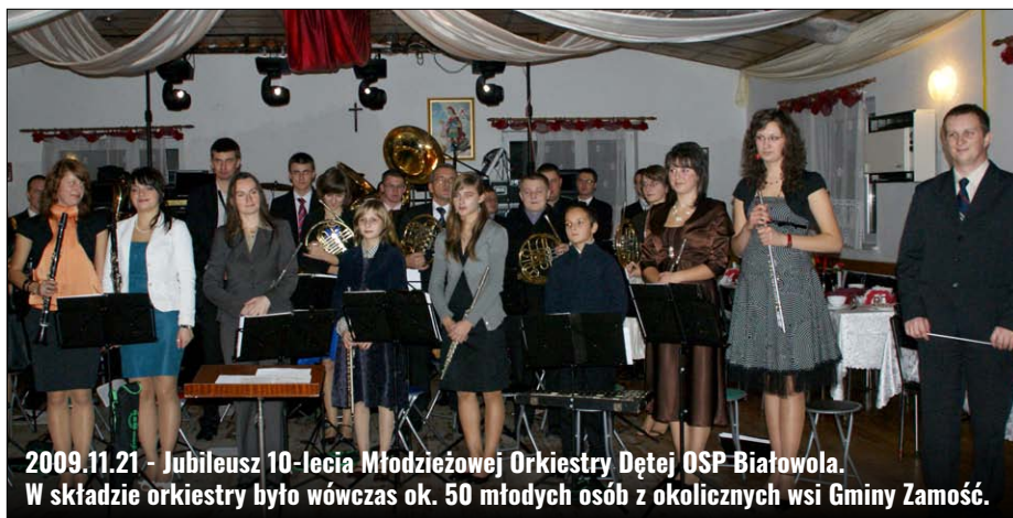
2009.11.21 - Jubileusz 10-lecia Młodzieżowej Orkiestry Dętej OSP Białowola. W składzie orkiestry było wówczas ok. 50 młodych osób z okolicznych wsi Gminy Zamość.