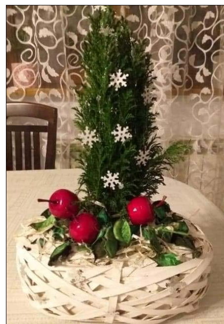
foto: Uczestnicy warsztatów z poszczególnych miejscowości