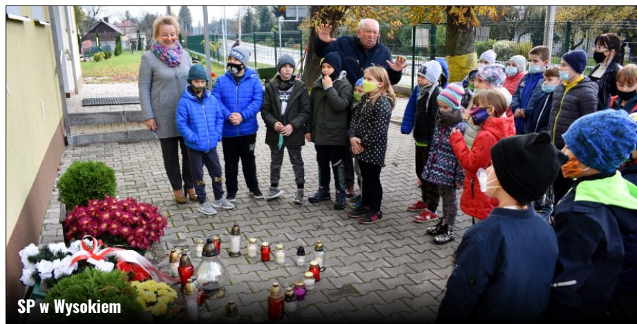
SP w Wysokiem

Rocznica odzyskania przez Polskę niepodległości, a wraz z nią uroczyste świętowanie tego wydarzenia na stałe wpisało się w kalendarz naszych szkolnych uroczystości. Tego roku niestety nie możemy wspólnie przeżywać tego święta w szkole. Nie przeszkodziło to uczniom klasy 3 w tym, by wzbudzić w sobie refleksję nad postawami patriotycznymi w czasie lekcji online i wykonać symboliczne kotyliony.