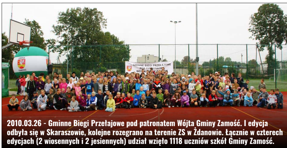
2010.03.26 - Gminne Biegi Przełajowe pod patronatem Wójta Gminy Zamość. I edycja odbyła się w Skaraszowie, kolejne rozegrano na terenie ZS w Zdanowie. Łącznie w czterech edycjach (2 wiosennych i 2 jesiennych) udział wzięło 1118 uczniów szkół Gminy Zamość.