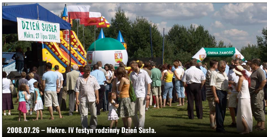
2008.07.26 – Mokre. IV festyn rodzinny Dzień Susła.