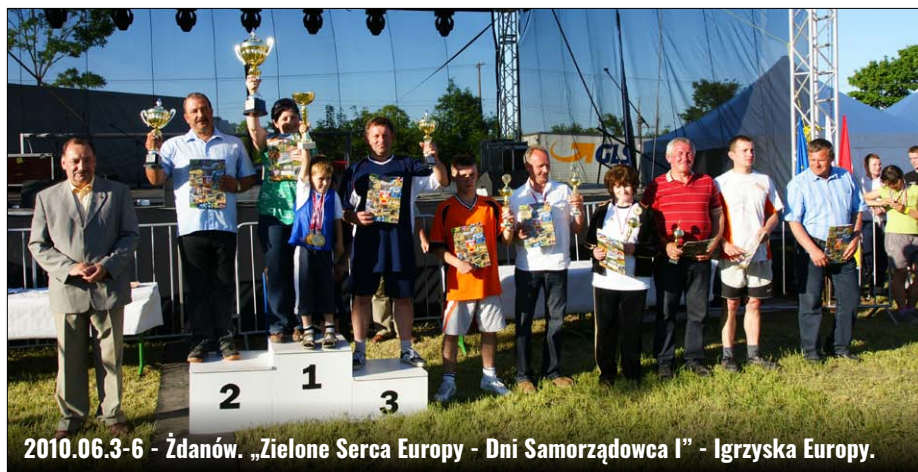
2010.06.3-6 - Żdanów. „Zielone Serca Europy - Dni Samorządowca I” - Igrzyska Europy.