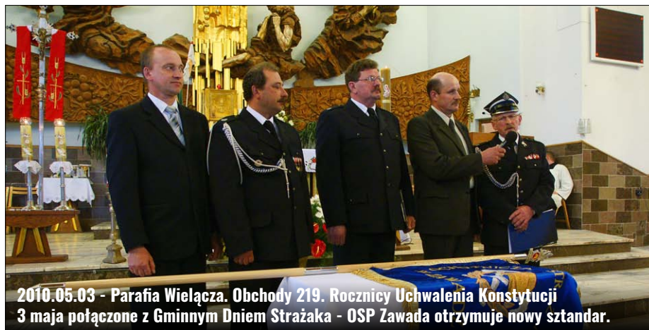
2010.05.03 - Parafia Wielącza. Obchody 219. Rocznicy Uchwalenia Konstytucji 3 maja połączone z Gminnym Dniem Strażaka - OSP Zawada otrzymuje nowy sztandar.