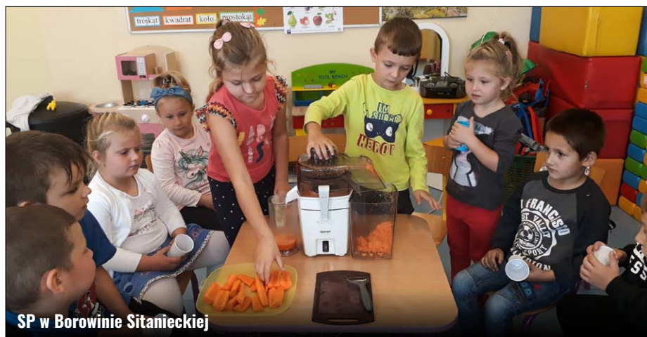
SP w Borowinie Sitanieckiej