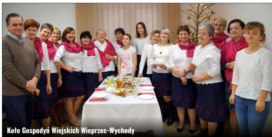
Koło Gospodyń Wiejskich Wieprzec-Wychody

dalszej twórczej działalności, aktywizacji lokalnego społeczeństwa, przekazywania wartości wspólnotowych i działań kolektywnych. Ogromne słowa uznania i podziękowania za prowadzoną działalność kulturalną, nieustanną pracę i dbałość oraz zaangażowanie w upowszechnianie bogatej regionalnej tradycji i pogłębianie pozytywnej współpracy z Samorządem Gminy Zamość. Życzymy Wam wszelkiej pomyślności, kolejnych sukcesów i dalszej satysfakcji z prowadzonej działalności. GOK: AW