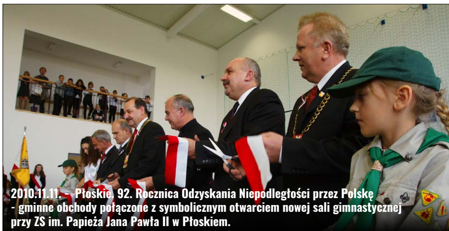
2010.11.11. – Płoskie. 92. Rocznicą Odzyskania Niepodległości przez Polskę - gminne obchody połączone z symbolicznym otwarciem nowej sali gimnastycznej przy ZS im. Papieża Jana Pawła II w Płoskiem.