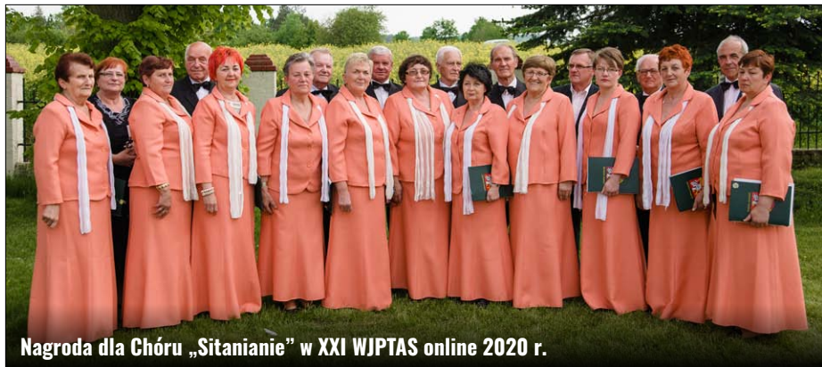
Nagroda dla Chóru „Sitaniaie” w XXI WJPTAS online 2020 r.