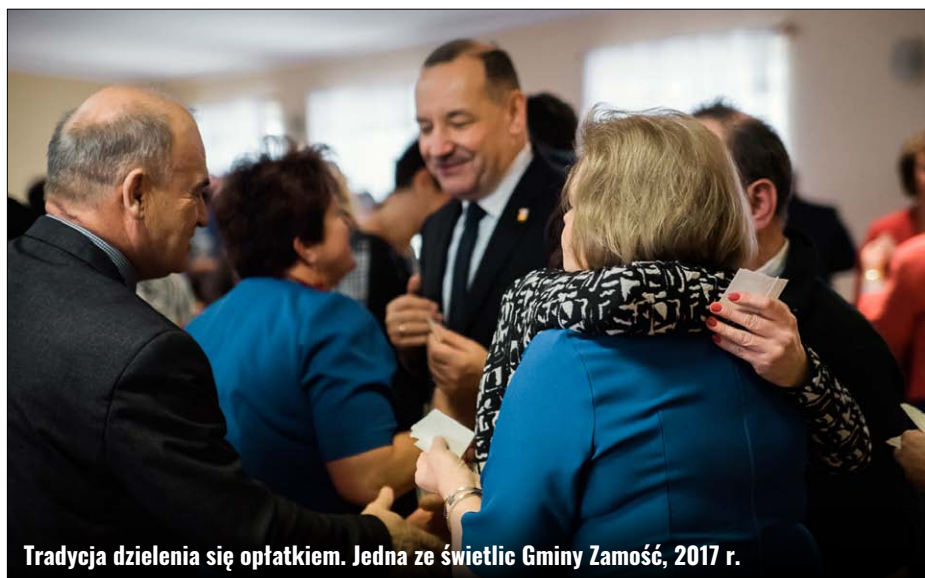
Tradycja dzielenia się opłatkiem. Jedna ze świetlic Gminy Zamość, 2017 r.

W dzień Wigilii należało zachować szczególną ostrożność, bowiem „jaka Wigilia, taki cały rok”. Czynności wykonywane tego dnia rzutowały na cały rok. Nie należało zatem się sprzeczać i kłócić, by w domu nie zagościła niezgoda. Kobiety spodziewające się dziecka unikały szycia i prania, aby dziecko nie urodziło się chore. Osoba, która w tym dniu zachorowała lub skaleczyła się, musiała liczyć się z problemami zdrowotnymi w przyszłości. Za to kichanie wróżyło zdrowie przez cały rok. Wodę i drewno należało przynosić do domu przed zmierzchem, a przyniesienie do domu czegokolwiek po wieczery wigilijnej mogło sprawić, iż całe zapasy zostaną zjedzone przez myszy. Przed Wigilią należało również spłacić wszystkie długi. Niewskazane było również pożyczanie komuś czegokolwiek, by nie narazić się na straty w przyszłym roku. Co ciekawe, istniało niepisane przyzwolenie na „niewinną” kradzież, tzn. można było „ukraść” komuś jakiś drobiazg, by zapewnić sobie pomyślność, ale skradziony przedmiot należało potem niepostrzeżenie podrzucić właścicielowi. W dzień Wigilii szczególnie wypatrywano pierwszych gości. Jeśli jako pierwszy do domu wszedł mężczyzna, jego mieszkańcy mogli liczyć na pomyśl-