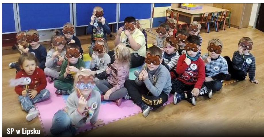
SP w Lipsku

25 listopada obchodzony był Światowy Dzień Pluszowego Misia. W tym roku również w kalendarzu naszych przedszkolnych uroczystości znalazło się to święto. Tego dnia dzieci opowiadały o swoich maskotkach oraz słuchały wierszy J. Brzechwy „Niedźwiedź”, W. Chotomskiej „Sen niedźwiedzia”. Po przeczytaniu utworu Cz. Janczarskiego „Naprawiamy misia” każdy przedszkolak miał ułożyć wizerunek misia z poszczególnych elementów i przykleić na karton. To zajęcie sprawiło dzieciom dużo satysfakcji. Wiele emocji i radości dostarczyła również wspólna zabawa w starego niedźwiedzia oraz inscenizacja pt. „Niezwykłe podróże małego misia”. Dzieci wysłuchały ciekawostek o historii pluszowej maskotki, o misiach bajkowych i tych prawdziwych, które zamieszkują różne części świata. Przedszkolaki poznały jadłospis, co wywołało niemałe zaskoczenie, że nie