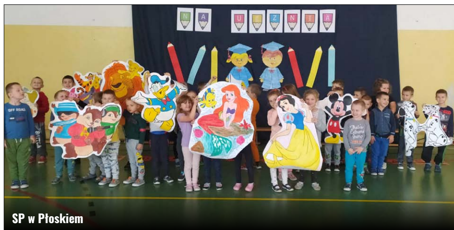
SP w Płoskiem