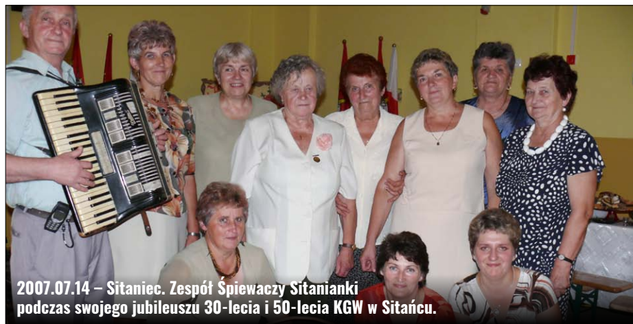
2007.07.14 – Sitaniec. Zespół Śpiewaczy Sitanianki podczas swojego jubileuszu 30-lecia i 50-lecia KGW w Sitańcu.