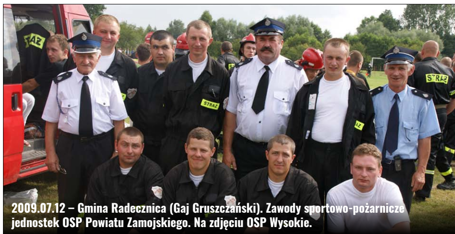
2009.07.12 – Gmina Radecznicza (Gaj Gruszczański). Zawody sportowo-pożarnicze jednostek OSP Powiatu Zamojskiego. Na zdjęciu OSP Wysokie.