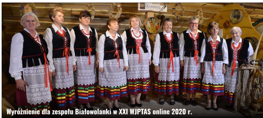
Wyróżnienie dla zespołu Białowolanki w XXI WJPTAS online 2020 r.