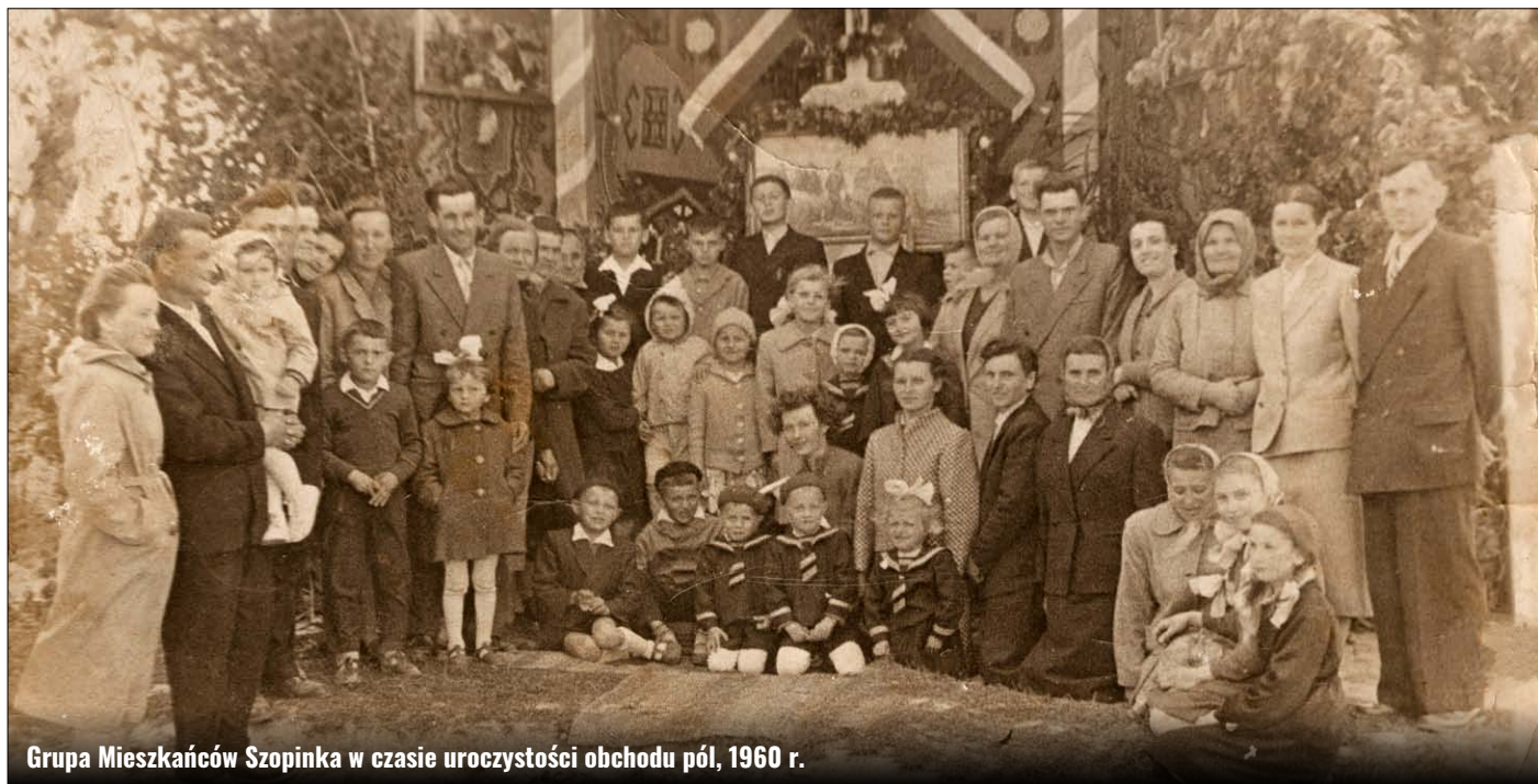
Grupa Mieszkańców Szopinka w czasie uroczystości obchodu pól, 1960 r.

Niestety, okres pandemii koronawirusa SARS CoV-2 uniemożliwił w roku 2020 r. organizację uroczystości z okazji 570 – lecia istnienia Szopinka. Pozostaje mieć nadzieję, że opracowany szczegółowy scenariusz, którego centralnym elementem miało być odsłonięcie tablicy pamiątkowej, uda się zrealizować przy okazji kolejnych jubileuszy. Na pewno Szopinek i jego mieszkańcy na to zasłużyli. Warto jednak, na podsumowanie mijającego roku, z okazji tak zacnego jubileuszu, napisać kilka słów naszej miejscowości.