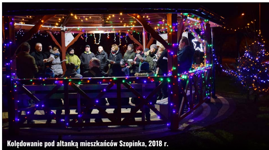
Kolędowanie pod altanką mieszkańców Szopinka, 2018 r.

Chociaż tegoroczne święta, ze względu na stan epidemii, zapiszą się w historii nieco skromniej od tych, które znamy, i z wielu tradycji i spotkań trzeba będzie zrezygnować, to mamy nadzieję, iż będą one okazją do wytchnienia w rodzinnym gronie domowników. Życzymy wszystkim mieszkańcom Gminy Zamość zdrowych i pogodnych świąt, miłości, pokoju i wzajemnego zrozumienia oraz wiary w lepsze jutro. GOK: KS