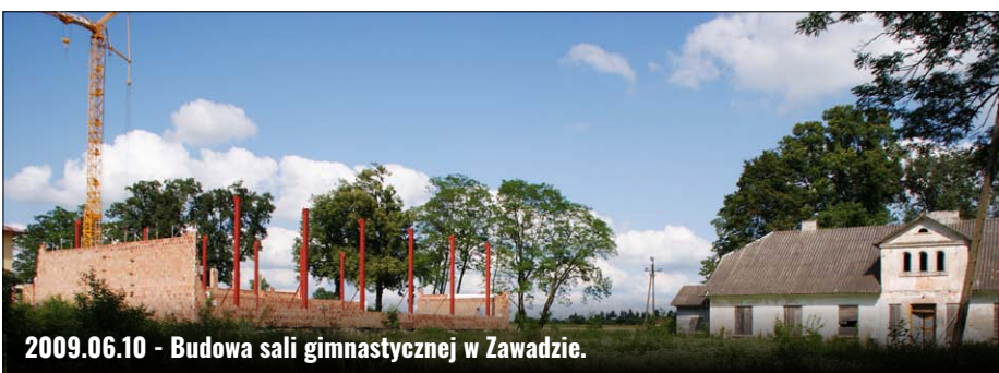
2009.06.10 - Budowa sali gimnastycznej w Zawadzie.