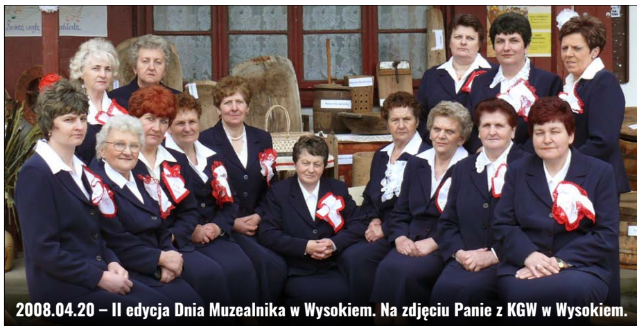
2008.04.20 – II edycja Dnia Muzealnika w Wysokiem. Na zdjęciu Panie z KGW w Wysokiem.