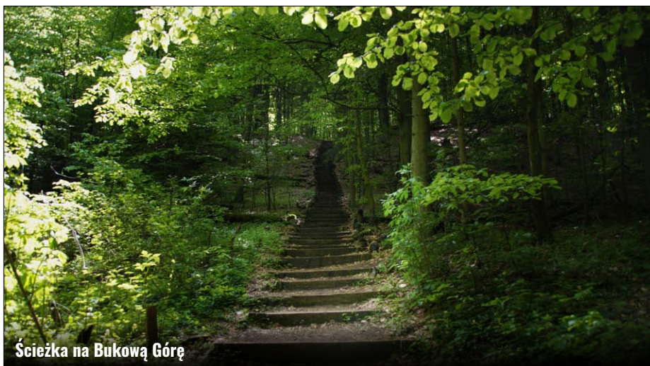
Ścieżka na Bukową Górę

Tereny Gminy Zamość też wchodziły w skład TRB „Roztocze”, pokrywając się z przynależnym jej obszarem otuliny Roztoczańskiego Parku Narodowego i samego Parku. Powierzchnia Parku, która znajduje się na terenie Gminy Zamość wynosi niewiele, bo 4,19 ha, ale przynależna jej