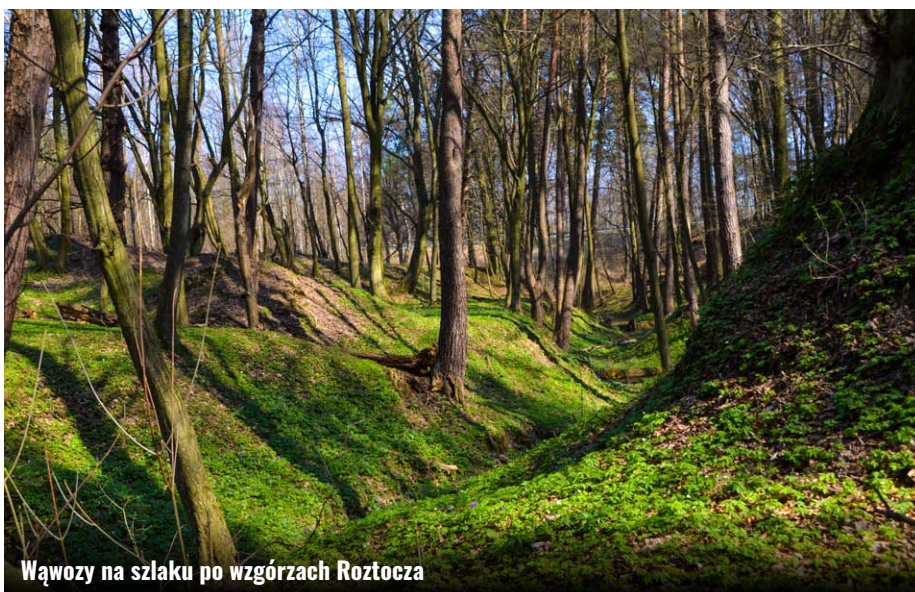
Wąwozy na szlaku po wzgórzach Rostocza

aut można natknąć się na przebiegające przez drogę dziki, jelenie, sarny i wilki. Na ok. 800 metrów przed końcem szlaku dojeżdżamy do ostrego zakrętu w lewo. Tutaj szlak krzyżuje się z dawnym traktem krasnobrodzkim, prowadzącym ze Zwierzynca przez Trzepieciny i Bondyż (Gmina Adamów) do Krasnobrodu, a po prawej stronie znajdują się zabudowania leśniczówki Słupy. Ten ostatni odcinek drogi, aż do nadwieprzańskich mokradeł, obsadzony jest po obu stronach dębami. Tuż za mostem na Wieprzu jest skrzyżowanie i koniec szlaku „Traktem Ordynackim”. Jeśli chcemy zastanowić się przez chwilę, w którą stronę pojechać, po naszej prawej stronie nad rzeką znajduje się miejsce na krótki postój i tyk zimnej wody ze źródła. Można też wybrać się na spływ kajakiem ze znajdujących się nieopodal wypożyczalni i przystani kajakowych. Można też przenocować w licznych gospodarstwach agroturystycznych.