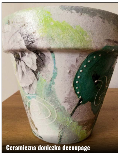
Ceramiczna doniczka decoupage