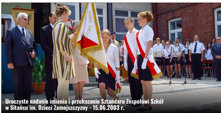
Uroczyste nadanie imienia i przekazanie Sztandaru Zespołowi Szkół w Sitańcu im. Dzieci Zamojszczyzny - 15.06.2003 r.