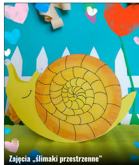
Zajęcia „ślimaki przestrzenne”

Zawsze uwzględniamy ten aspekt w naszych projektach, dlatego tematem kolejnych warsztatów były pisanki , do wykonania których posłużyły nam jedynie stare gazety i kalendarze w kwiaty. Z nich wycinaliśmy wzory pisanek, po cztery na stworzenie jednego jajka. Każdy taki wzór składaliśmy na pół i sklejałiśmy tak, by nadać pracy formę przestrzenną. Takie projekty uczą precyzji, bo wszystkie elementy trzeba ze sobą skleić równo, ale zostawiają pewien margines na błędy. Ostatecznie nierówne brzegi można, ze szkodą dla symetrii, dociąć już po sklejeniu, a intensywny motyw kwiatowy wybacza podobne niedociągnięcia i ich niezbyt nawet zręczne naprawianie. W dobrych humorach wkroczyliśmy więc w okres wielkanocny, a po świątach miejsce pisanek zajęły już motywy wiosenne.