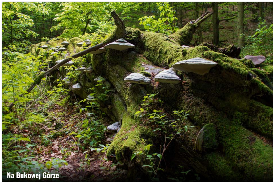
Na Bukowej Górze

szar nosi nazwę „Kąty”. Teren ten jest bardzo często odwiedzany przez rowerzystów za sprawą przebiegającej tędy Ścieżki Rowerowej Gminy Zamość. Przecina się ona na krzyżówce w Wólce Wieprzeckiej z trasą rowerową o nazwie „Trakt Ordynacki” pro-