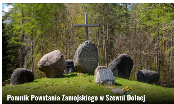
Pomnik Powstania Zamojskiego w Szewni Dolnej

Kąsewiczka jest węzeł szlaków. Tutaj nasz zielony szlak rowerowy łączy się ze Ścieżką Rowerową Gminy Zamość oraz ze szlakiem pieszym zielonym im. Władysławy Podobińskiej z Zamościa do Suśca o długości 52 km. Po około 2 km dojedziemy do wschodniego skraju lasu. Przed nami ukaże się kapliczka św. Romana wybudowana nad źródłem u podnóża Łysej Góry zwanej też Miasteczkiem lub Zjawieniem. Wzgórze ma ok. 300 m, obecnie zarośnięte jest bukami, ale niegdyś znajdowało się na nim grodzisko. Szlak prowadzi nas w prawo na wieżę widokową i miejsce wypoczynku. Powyżej wieży znajduje