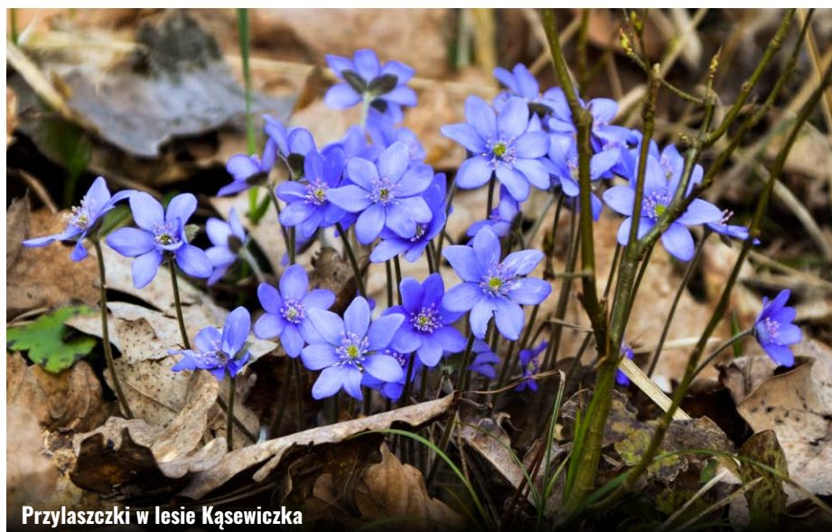
Przylaszczki w lesie Kąsiewiczka

Opis tego szlaku rowerowego rozpoczniemy od Centrum Geoturystycznego w Gminie Zamość, które powstaje w nowej postaci na terenie tzw. starej szkoły w Lipsku Polesiu. Będą tu miejsca noclegowe, wiaty na spotkania i ogniska, parking, wypożyczalnia rowerów oraz kameralne sale konferencyjne. Tuż przy Centrum mają swój początek i koniec dwie ścieżki nordic walking prowadzące przez najpiękniejsze zakątki bukowych lasów Kąsiewiczka i Stary Działek. Ścieżki oznaczone są dwoma kolorami: krótsza kolorem zielonym, dłuższa czerwonym. Ta druga o długości 8,5 km prowadzi do kapliczki św. Romana. Miejscowość Lipsko Polesie powstała tuż przed rozpoczęciem II wojny światowej. Jazdę rozpoczynamy 600-metrowym odcinkiem drogi asfaltowej, obserwując jednocześnie znaki ścieżek nordic walking w kierunku południowo-wschodnim. Do kolejnego odcinka drogi asfaltowej dojedziemy po przejechaniu następnym ok. 14 km. Na wjeździe do lasu