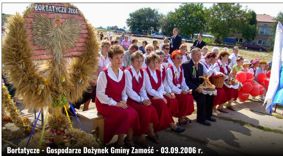
Bortatycze - Gospodarze Dożynek Gminy Zamość - 03.09.2006 r.