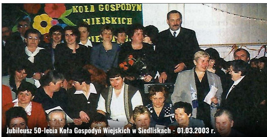
Jubileusz 50-lecia Koła Gospodyń Wiejskich w Siedliskach - 01.03.2003 r.