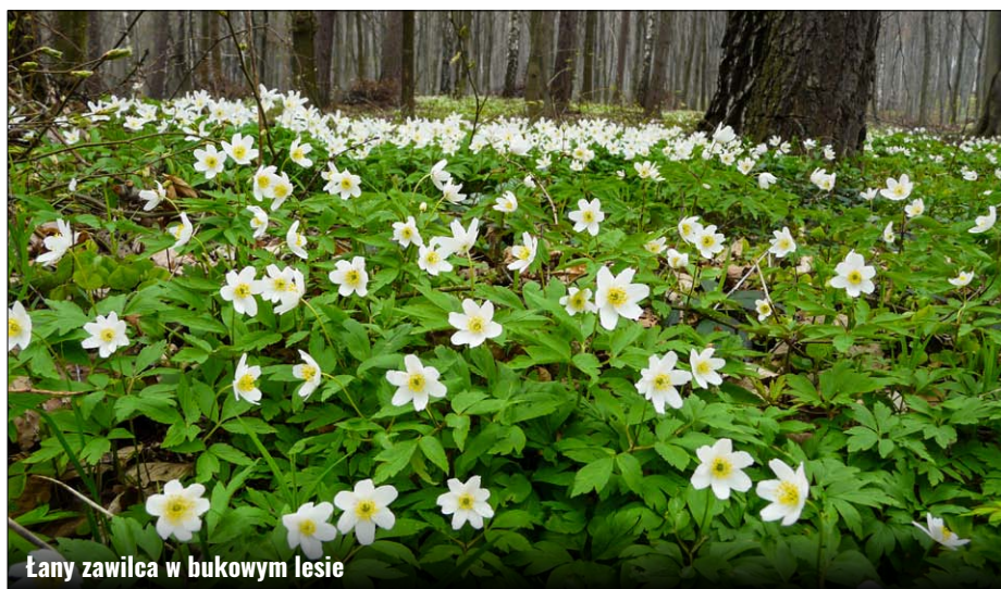
Łany zawilca w bukowym lesie

Do końca szlaku pozostało jeszcze ok. 3 km jazdy po leśnych drogach. Dopiero ostatni 300-metrowy odcinek od mostu na Wieprzu jest utwardzony. I tak dojeżdżamy do Guciowa w pobliże słynnej Zagrody państwa Jachymków oraz pobliskich punktów z wiejskim jadłem. W okolicy Guciowa znajdują się wały największego grodziska słowiańskiego oraz liczne kurhany. Jest tu też stacja pogodowa lubelskiego UMCS-u, jej pomiary dostępne są w internecie. Na moście przy rzece znajdziemy urządzenie do automatycznego pomiaru stanu wody. Po dojeździe do węzła ze szlakiem rowerowym Roztoczańskim niebieskim możemy pojechać w prawo w kierunku Obroczy (ok. 4 km), gdzie napotkamy znaki szlaku rowerowego „Traktem Ordyackim” w kierunku Wólki Wieprzeckiej i Zwierzynca (8 km) lub w lewo w kierunku Bondryza (6 km) i Krasnobrodu (11 km). Obecnie obie nowe trasy rowerowe są już gotowe i dostępne dla rowerzystów. W najbliższym czasie w ramach wspomnianego projektu „RoweLove...” planowane jest wydanie mapy turystycznej opisywanych okolic. Życzymy udanych wypraw. GOK: KC