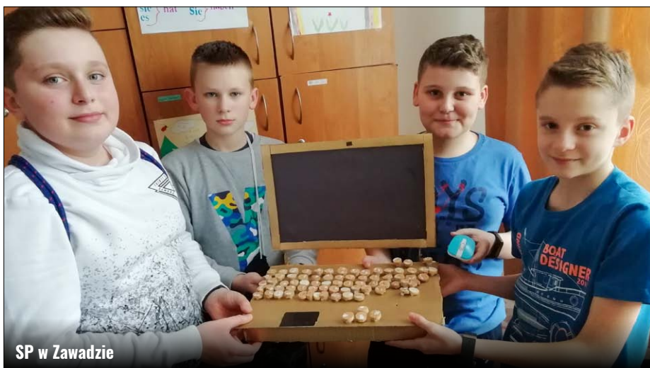
SP w Zawadzie

Ekokoncepcja urządzeń technicznych jest kluczem do przyszłości. Jak będzie wyglądał nasz świat w przyszłości, to za-