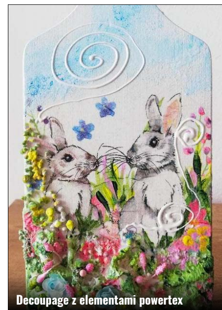
Decoupage z elementami powertex