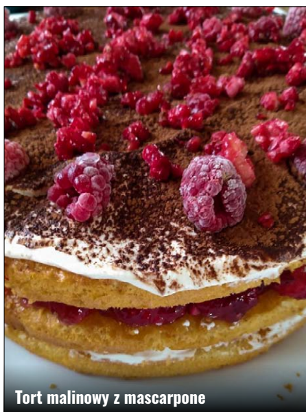
Tort malinowy z mascarpone