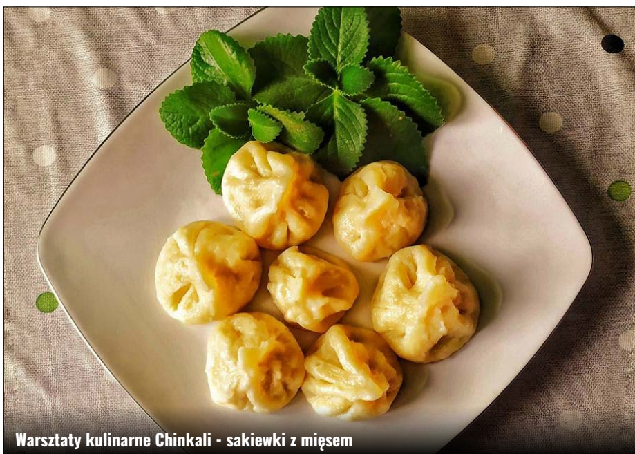
Warsztaty kulinarne Chinkali - sakiewki z mięsem

Zdalne warsztaty w Gminie Zamość – maj 2020 – zajęcia zrealizowane w ramach dotacji „Wspieranie i upowszechnianie idei samorządowej poprzez wdrażanie programu pobudzania aktywności lokalnej”. Organizator: Stowarzyszenie Kobiet na rzecz promocji i rozwoju środowisk lokalnych 28+.