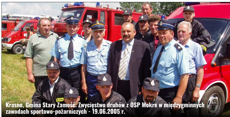
Krasne, Gmina Stary Zamość. Zwycięstwo drużów z OSP Mokre w międzygminnych zawodach sportowo-pożarniczych - 19.06.2005 r.