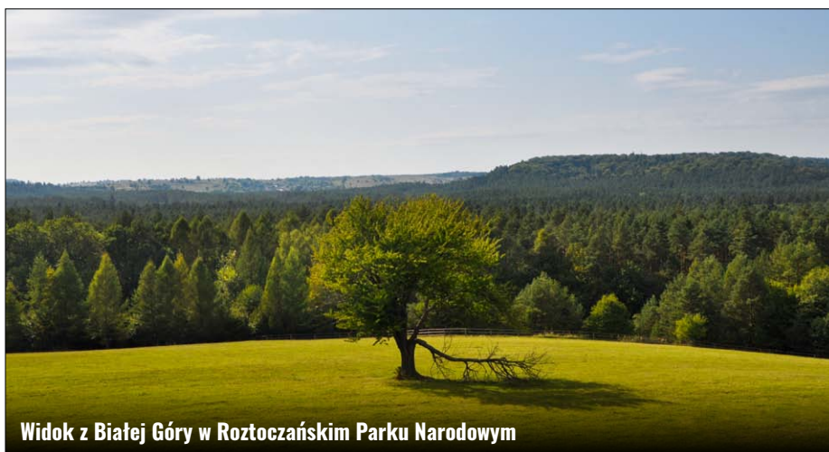
Widok z Białej Góry w Roztoczańskim Parku Narodowym

Status Rezerwatu Biosfery jest nadawany przez Światowy Komitet UNESCO (United Educational, Scientific and Cultural Organization) w Paryżu obszarom charakterystycznym dla poszczególnych biomów Ziemi. Obszary te wyróżniają się na świecie walorami przyrodniczymi i krajobrazowymi. A zastosowane formy przyrody i zrównoważone użytkowanie gospodarcze tworzą harmonijny układ. Takich unikatowych miejsc na Ziemi jest zaledwie 686 w 122 krajach. Europa ma 263 takie miejsca, zlokalizowane w 36 krajach. W Polsce wyróżniono zaledwie 11 tego typu unikalnych obszarów. Warto też zauważyć, że transgranicznych, jak TRB „Roztocze”, jest na świecie tylko 20. W Polsce są to tak znane i cenione miejsca, jak Rezerwat Biosfery Białowieża, Rezerwat Biosfery Babia Góra, Jeziora Mazurskie, Słowiński Rezerwat Biosfery, Trójstronny Transgraniczny Rezerwat Biosfery Karpaty Wschodnie, Transgraniczny Rezerwat Biosfery Karkonosze, Tatrzański Transgraniczny Rezerwat Biosfery, Rezerwat Biosfery Puszcza Kampinoska, Trójstronny Transgraniczny Rezerwat Biosfery Polesie Zachodnie i Rezerwat Biosfery Bory Tucholskie. W 2019 r. do tej elitarnej grupy dołączył Transgraniczny Rezerwat Biosfery „Roztocze”. TRB po stronie polskiej obejmuje część następujących lubelskich powiatów: Janów Lubelski, Zamość, Biłgoraj, Tomaszów Lubelski oraz podkarpacki