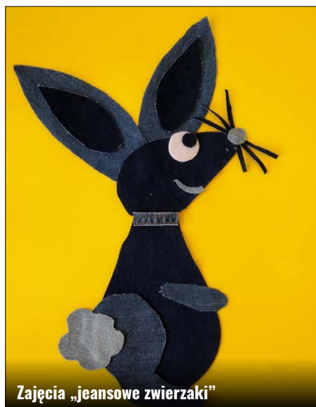
Zajęcia „jeansowe zwierzaki”

Ze względu na tryb pracy szkół, czyli zdalne nauczanie, dotychczasowi animatorzy zajęć świetlicowych skoncentrowali się na przygotowywaniu instrukcji i zdjęć projektów plastycznych, które następnie publikowali w internecie. Ta forma prezentacji treści pozwala najmłodszym ograniczyć czas korzystania z komputera, a jednocześnie mieć dostęp do nowych zajęć kreatywnych i pozostać w kontakcie z ani-