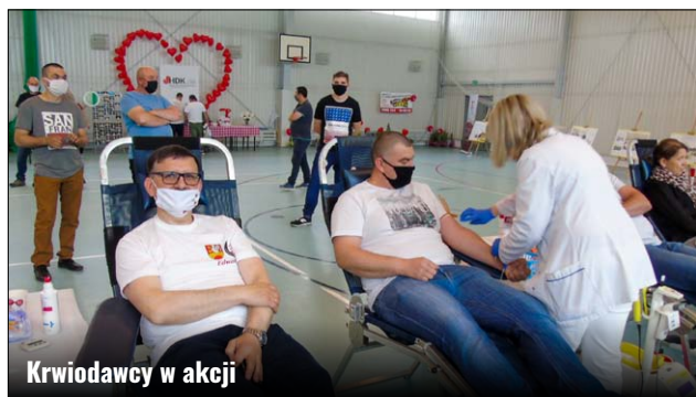
Krwiodawcy w akcji

Ten trudny czas, z którym przyszło nam się zmierzyć, wprowadził spore ograniczenia w codziennym życiu. Przestrzeganie dystansu społecznego między sobą, obawa i troska o zdrowie własne oraz najbliższych towarzyszą nam teraz codziennie. W sytu-