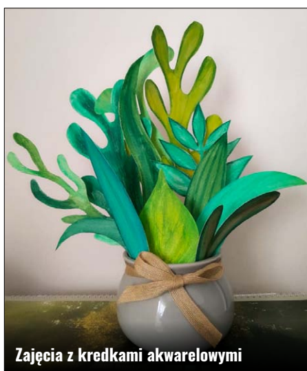
Zajęcia z kredkami akwarelowymi

giego, mniejszego, kota tworzyliśmy muszelkę. To właśnie tutaj wykorzystano suche pastele. Są to wdzięczne kredki, szczególnie dla maluchów – przy prawidłowym użyciu (wystarczy unikać rysowania ostrym brzegiem i nieco „rozpisać” produkt na brudno) pozwalają uzyskać bardzo płynne przejścia kolorystyczne. Ich zamiennikiem mogą być popularne kredki Bambino, ale te nie posiadają niestety takiego nasycenia barw jak pastele, natomiast zdecydowanie mniej brudzą. Z kolei bardzo czyste i intensywnie kolorowe były kartony, których użyto do wykonania pracy, pt. „Dzień z życia słońka”. Tu także wycinano kółka, dla ułatwienia od razu z koronami - promyczkami, nacinano promienie wewnątrz okręgów, aby uformować niewielkie stożki, i sklejało. Tak powstawały wypukłe słońeczka, każde na inną porę dnia. Mieliliśmy różowy świt wstający z fioletowych obłoczków, złote południe w lazurze i na koniec pomarańczowe, senne słońko zachodzące w purpurowe chmury. Tym uroczym widokiem zakończył się etap projektów dla najmłodszych uczniów.