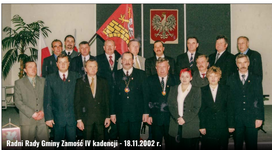
Radni Rady Gminy Zamość IV kadencji - 18.11.2002 r.