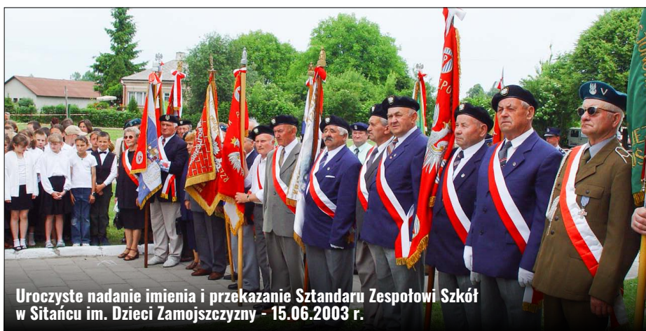
Uroczyste nadanie imienia i przekazanie Sztandaru Zespołowi Szkół w Sitańcu im. Dzieci Zamojszczyzny - 15.06.2003 r.