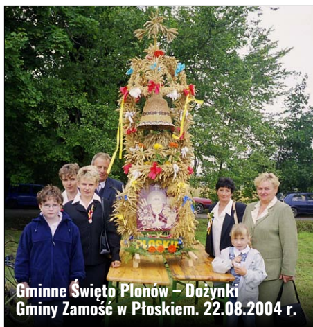
Gminne Święto Plonów – Dożynki Gminy Zamość w Płoskiem. 22.08.2004 r.