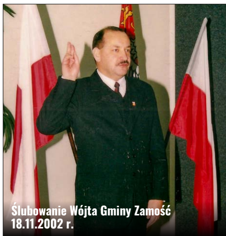
Ślubowanie Wójta Gminy Zamość 18.11.2002 r.