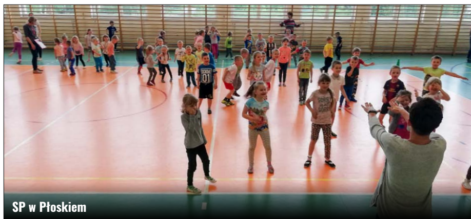
SP w Płoskiem

Uczniowie klas I-III oraz przedszkolaki ze Szkoły Podstawowej w Płoskiem wzięli