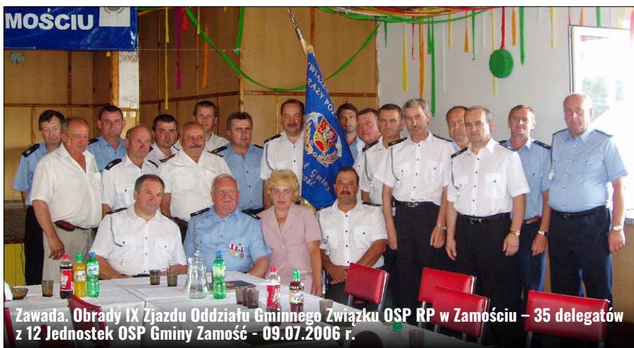
Zawada. Obrady IX Zjazdu Oddziału Gminnego Związku OSP RP w Zamościu – 35 delegatów z 12 Jednostek OSP Gminy Zamość - 09.07.2006 r.