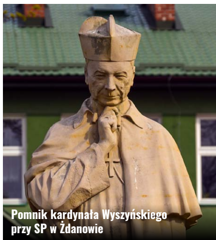
Pomnik kardynała Wyszyńskiego przy SP w Żdanowie

Stefan Wyszyński urodził się 3 sierpnia 1901 r. w Zuzeli (wieś nad rzeką Bug w woj. mazowieckim, w powiecie ostrowskim, w Gminie Nur). W wieku 19 lat wstąpił do Wyższego Seminarium Duchownego we Włocławku. W roku 1924 przyjął święcenia kapłańskie, a w 1929 r. ukończył studia na Katolickim Uniwersytecie Lubelskim w Lublinie, broniąc pracę doktorską, pt.: „Prawa rodziny, Kościoła i państwa do szkoły”. Rok później został profesorem prawa kanonicznego i socjologii w Wyższym Seminarium Duchownym we Włocławku. Po wybuchu II wojny światowej, ze względu na swoje zaangażowanie społeczne oraz przedwojenne publikacje nt. niemieckiego nacjonalizmu, był poszukiwany przez władze okupacyjne. Na polecenie rektora seminarium opuścił Włocławek i ukrywał się m.in. na Lubelszczyźnie: w Kozłowie w majątku Zamojskich niedaleko Lubartowa, a od października 1941 r. do czerwca 1942 r. znalazł schro-