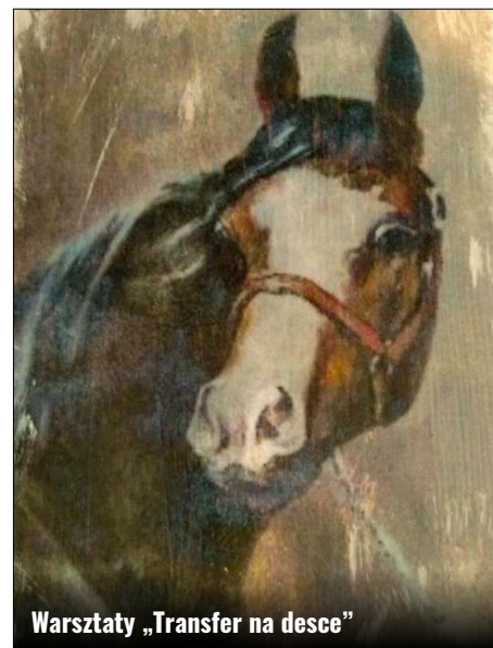
Warsztaty „Transfer na desce”