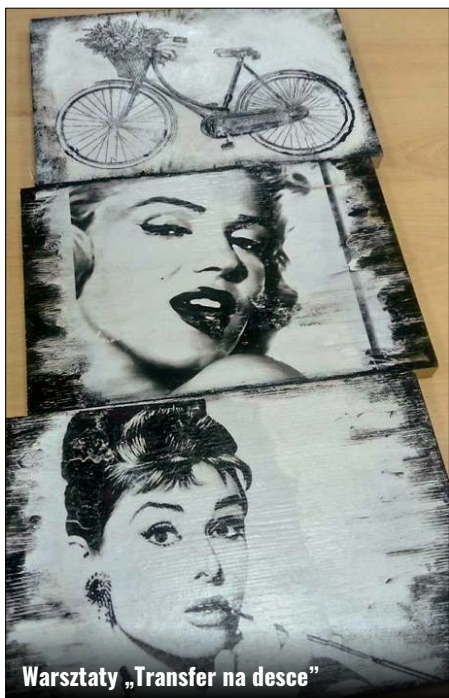
Warsztaty „Transfer na desce”

Wydawałoby się, że w okresie pandemii, która trwa od marca tego roku, wszelakie działania i inicjatywy w sołectwach Gminy Zamość są niemożliwe. Jednak Stowarzyszenie pokazało, że można. Wystarczy tylko znaleźć rozwiązanie i pomysł, aby