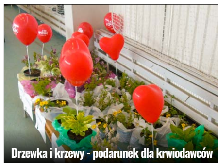
Drzewka i krzewy - podarunek dla krwiodawców

acji pandemii, z jaką dzisiaj się zmagamy, rola jaką pełnią Honorowi Dawcy Krwi tym bardziej zasługuje na najwyższe uznanie i szacunek. Ostatnia Akcja Poboru Krwi „RAZEM POMIMO PANDEMII”, która odbyła się 31 maja 2020 r. w Szkole Podstawowej w Żdanowie, ukazała wspaniałe świadectwo odpowiedzialności oraz solidarności społecznej krwiodawców. Tego dnia, mimo kapryśnej pogody, krwiodawcy z Gminy Zamość (i nie tylko) tłumnie przybyli gotowi oddać krew. Choć nie każdy mógł się nią wówczas podzielić, bo z różnych przyczyn zdrowotnych paru dawców nie zostało zakwalifikowanych do oddania, to sama chęć pomocy drugiemu człowiekowi jest postawą godną do naśladowania. Tego dnia w szkolnej sali gimnastycznej w Żdanowie zarejestrowano łącznie 136 osób, z czego finalnie 122 osoby oddały krew. Zebrano łącznie aż 54,9 litrów pełnej krwi. Właśnie teraz, kiedy zapotrzebowanie na krew jest bardzo wysokie, dzięki dawcom jest się czym dzielić. Ze-