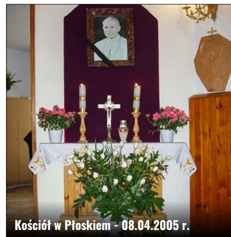
Kościół w Płoskiem - 08.04.2005 r.