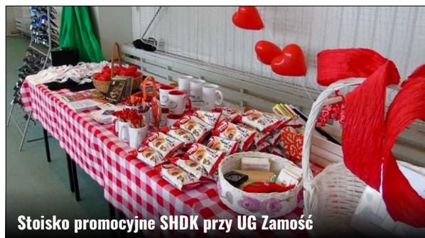
Stoisko promocyjne SHDK przy UG Zamość

Wszyscy, którzy w Żdanowie oddali krew i mieszkają na terenie Gminy Zamość mogli wziąć udział w konkursie „Bitwa sołectw – do ostatniej kropli krwi”. Jest to już III edycja tego konkursu skierowana do mieszkańców sołectw Gminy Zamość, organizowana wspólnie z Samorządem Gminy Zamość oraz Zarządem Gminnego Związku OSP RP w Zamościu. Warto przypomnieć, że konkurs trwa od 1 lutego 2020 r. do 30 listopada br., a nagrody dla zwycięzców funduje Wójt. Na akcji już tradycyjnie prowadzono zbiórkę czekolad pod hasłem „PODAJ DALEJ” – ten stały element gminnych poborów krwi, organizowanych przez Stowarzyszenie HDK cieszy się sporym wsparciem krwiodawców. Dzięki ofiarności naszych dawców zebrano 133 czekolady, które niebawem trafią tym razem do Stowarzyszenia Pomocy Dzieciom Niepełnosprawnym „Krok za krokiem” w Zamościu.