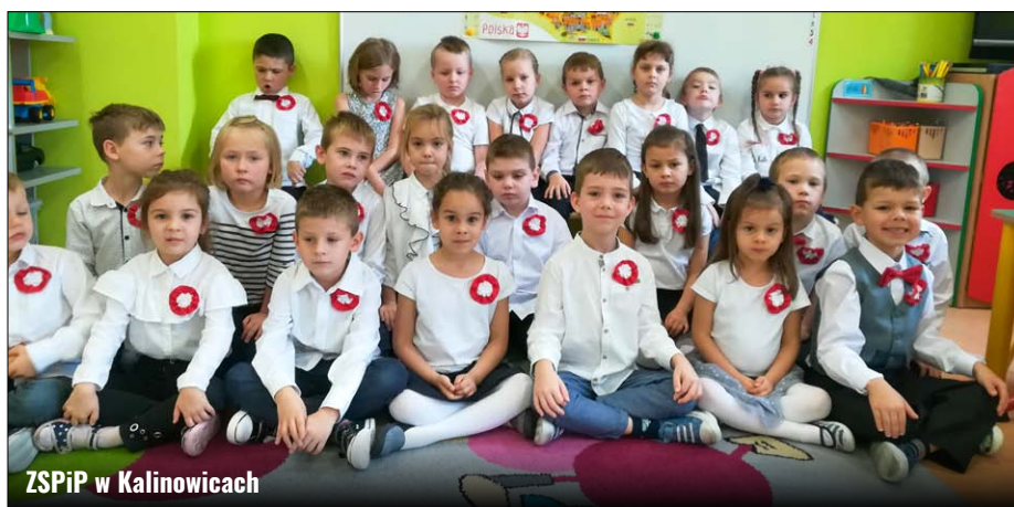
ZSPiP w Kalinowicach

kiego Polaka, Wielkiego i Wspaniałego Człowieka - Karola Wojtyły - Św. Jana Pawła II. Z tej racji w Szkole Podstawowej w Lipsku miało się odbyć wiele konkursów, było dużo inicjatyw oraz wiele pomysłów, ale niestety pandemia koronawirusa pokrzyżowała nam plany, uniemożliwiła realizację tychże pomysłów. Jednak jako ci, którzy zdobywają wiedzę i mądrość w roku jubileuszu św. Jana Pawła II, nie mogliśmy w tym czasie pozostać bierni - zmobilizowani, mając tak Wielkiego Patrona i wierząc w Świętych Obcowanie, wspólnie, choć zdalnie, ale z radością przygotowaliśmy się na 100. rocznicę urodzin Karola Wojtyły - Św. Jana Pawła II. Podejmując trud zmagania się z obecną sytuacją staraliśmy się zatrzymać na chwilę modlitwy i refleksji, korzystając z tekstów, które pozostawił nam wszystkim papież - Polak. To one umacniają nas na ścieżkach życia i pomagają stawać się pięknymi ludźmi na wzór św. Jana Pawła II. W Szkole Podstawowej w Lipsku już od 13 maja trwa