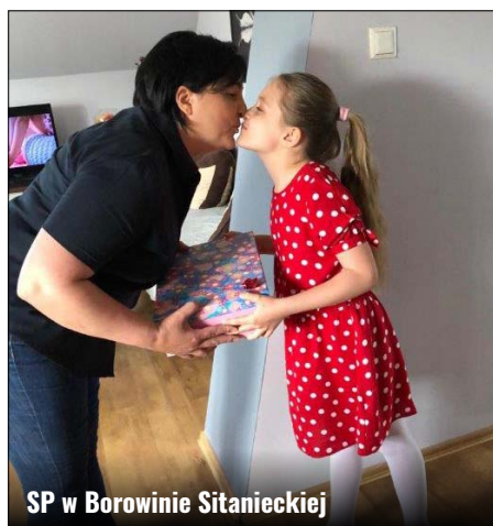
SP w Borowinie Sitanieckiej