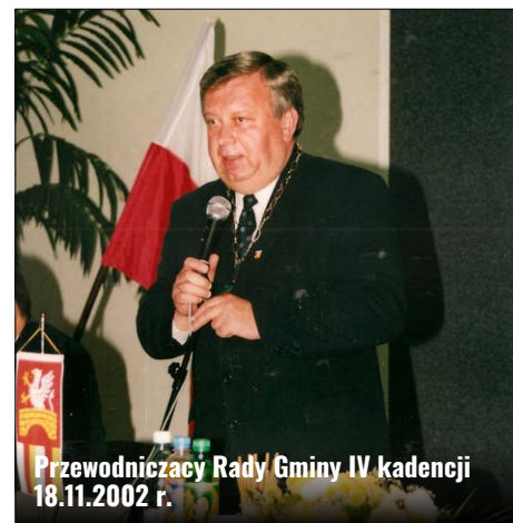
Przewodniczący Rady Gminy IV kadencji 18.11.2002 r.