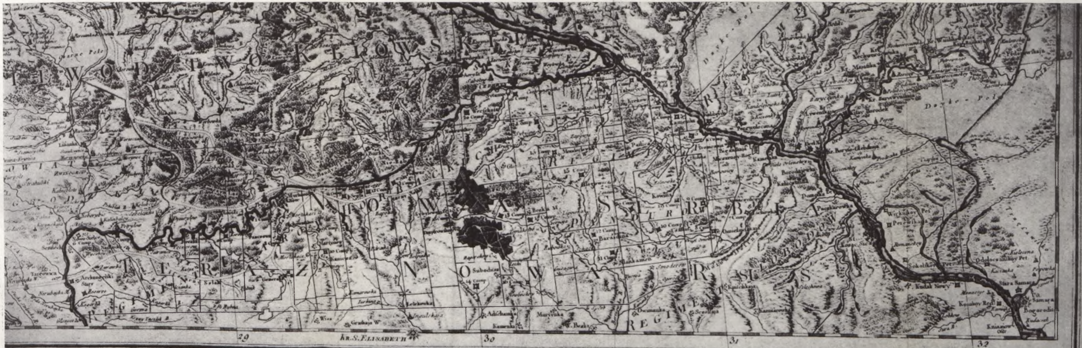
CARTE DES FRONTIÈRES DE POLOGNE ET DE RUSSIE, CONTENANT LA PARTIE MÉRIDIIONALE DE L'UKRAINE ET LE COURS DU DNIÉPER DEPUIS KIOVIE JUSQU'À LA SAMARA.