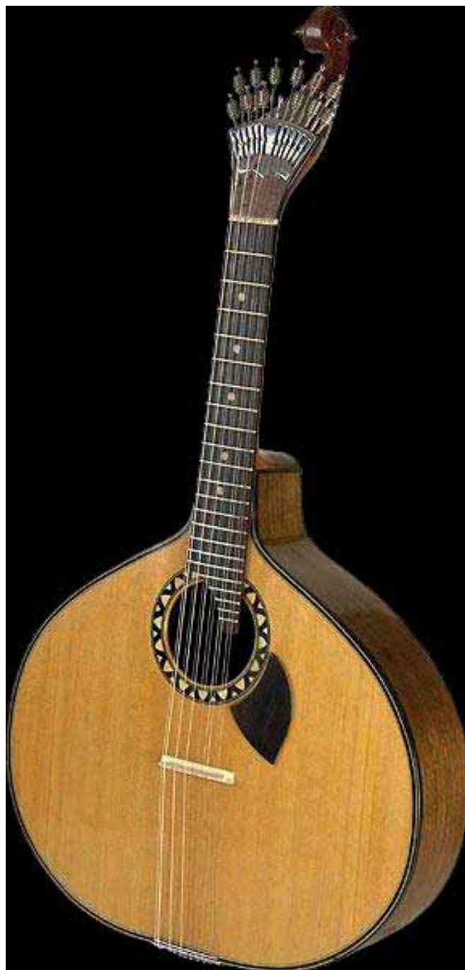
Ilustracja 2. Gitara portugalska, cyt. [za:] www.pinterest.co.uk/yvanroyen/fado [data dostępu: 02.01.2018].