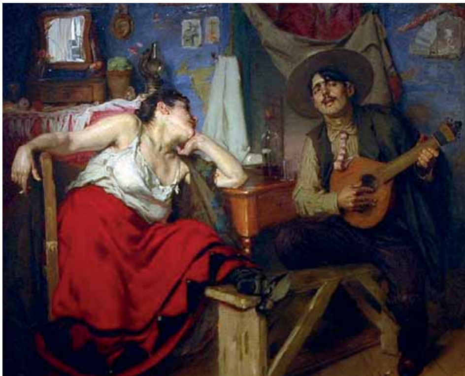
Ilustracja 1. Jose Malhoa, Fado , 1910, olej na płótnie, 150cm×183cm, Museu da Cidade, Lizbona; cyt. [za:] Vieira Nery, op. cit. , s. 87.

Warto w tym miejscu odnotować reakcje sztuk pięknych. Wokalno-instrumentalna interpretacja fado stała się na początku XX wieku natchnieniem dla portugalskiego malarza José Malhoa, który jedną ze swoich prac opatrzył tytułem Fado .