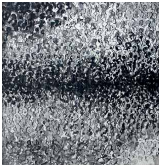
Ilustracja 2. J. Szajna, Mrowisko , źródło: https://www.artspier.com/en/contemporary-artworks/drawing/48589/from-the-series-mrowisko-ant-colony [data dostępu: 21.08.2018].