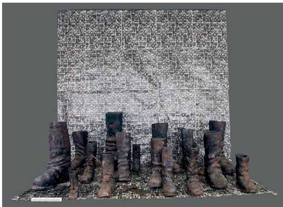
Ilustracja 5. J. Szajna, Drang nach Osten – Drang nach Westen , źródło: http://dmochowskigallery.net/galeria_zoom.php?artist=4&picture=3251 [data dostępu: 30.08.2018].