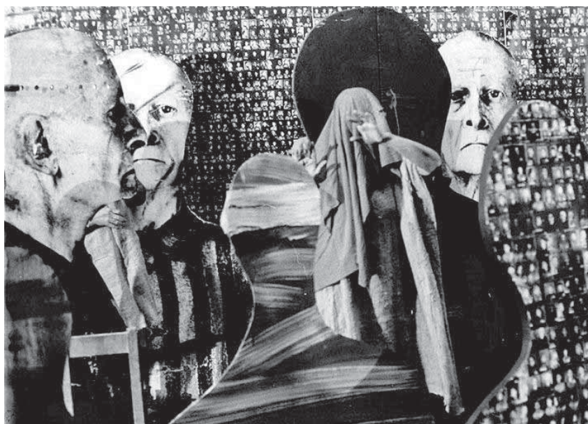
Ilustracja 3. J. Szajna, Sylwety i cienie , źródło: http://dmochowskigallery.net/galeria_zoom.php?artist=4&picture=3253 [data dostępu: 30.08.2018].