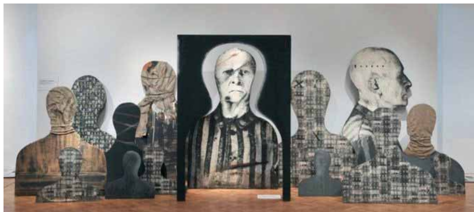
Ilustracja 4. J. Szajna, Reminiscence , źródło: https://muzeumslaskie.pl/pl/kalendarium/reminiscence-jozefa-szajny-panel-dyskusyjny [data dostępu: 25.10.2018].