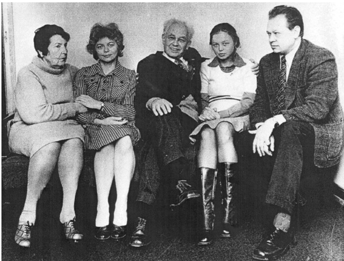
Archiwum Marceliego Klimkowskiego