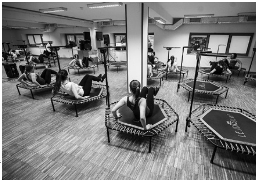
• Trening Fit&Gym AZS – ćwiczenia na trampolinach