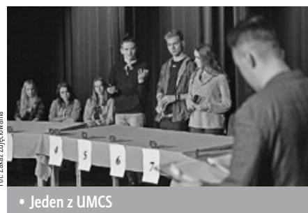
• Jeden z UMCS