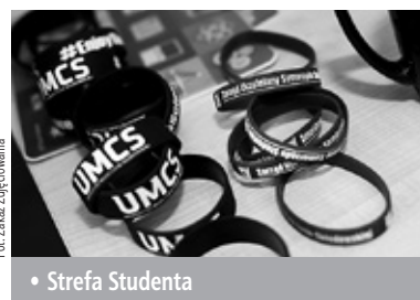
• Strefa Studenta

W ramach tegorocznych Drzwi Otwartych UMCS przygotowaliśmy mnóstwo atrakcji. W ACK UMCS „Chatka Żaka” stworzyliśmy specjalną Strefę Studenta, w której kandydaci mogli zasmakować prawdziwego studenckiego życia. Tam bowiem oprócz licznych konkursów czekały na nich między innymi zabiegi pielęgnacyjne w wykonaniu Koła