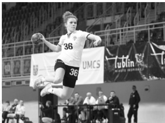
Fot. Michał Pliat