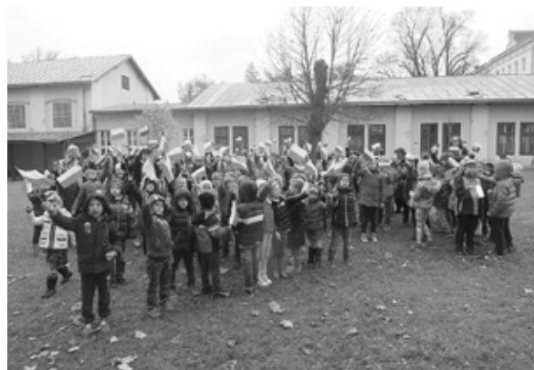
Archiwum Szkoły Polskiej im. Jana III Sobieskiego przy Ambasadzie RP w Wiedniu