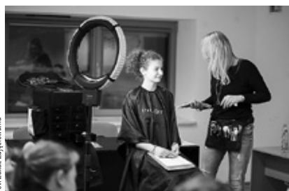
• Warsztaty z wizażu – Elite Make Up Mobilny