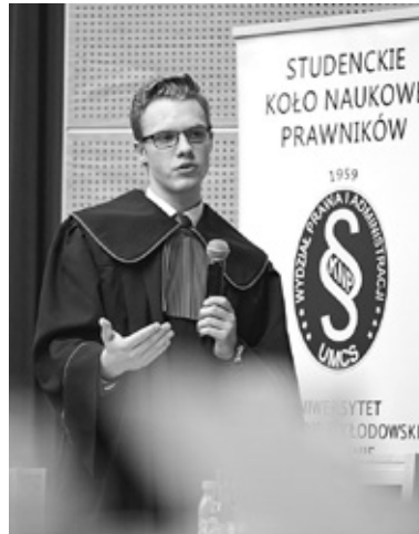
Fot. Bartosz Prohl

15 marca 2018 r. w Auli Uniwersyteckiej na Wydziale Prawa i Administracji UMCS odbył się 46. Środowiskowy Konkurs Krasomówczy. W organizowanym nieprzerwanie od 1973 r. Konkursie wzięło udział pięciu uczestników, którzy wystąpili w rolach stron procesowych w sprawach: karnej, cywilnej i sądownoadministracyjnej.