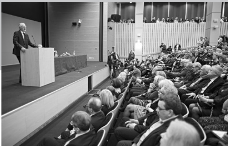
Fot. Bartosz Profil