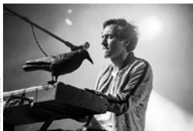
• Koncert zespołu Patrick the Pan