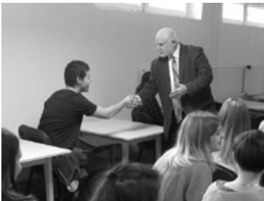
Archiwum Leszka Mikruta