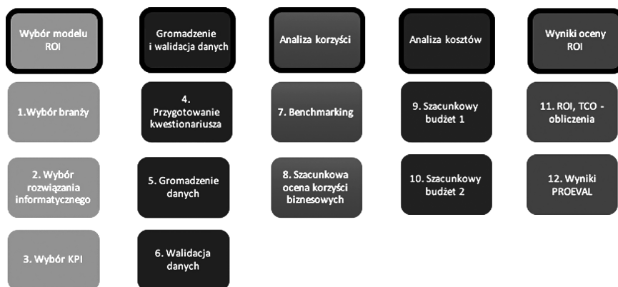
Rys. 3. Szczegółowy proces oceny PROEVAL