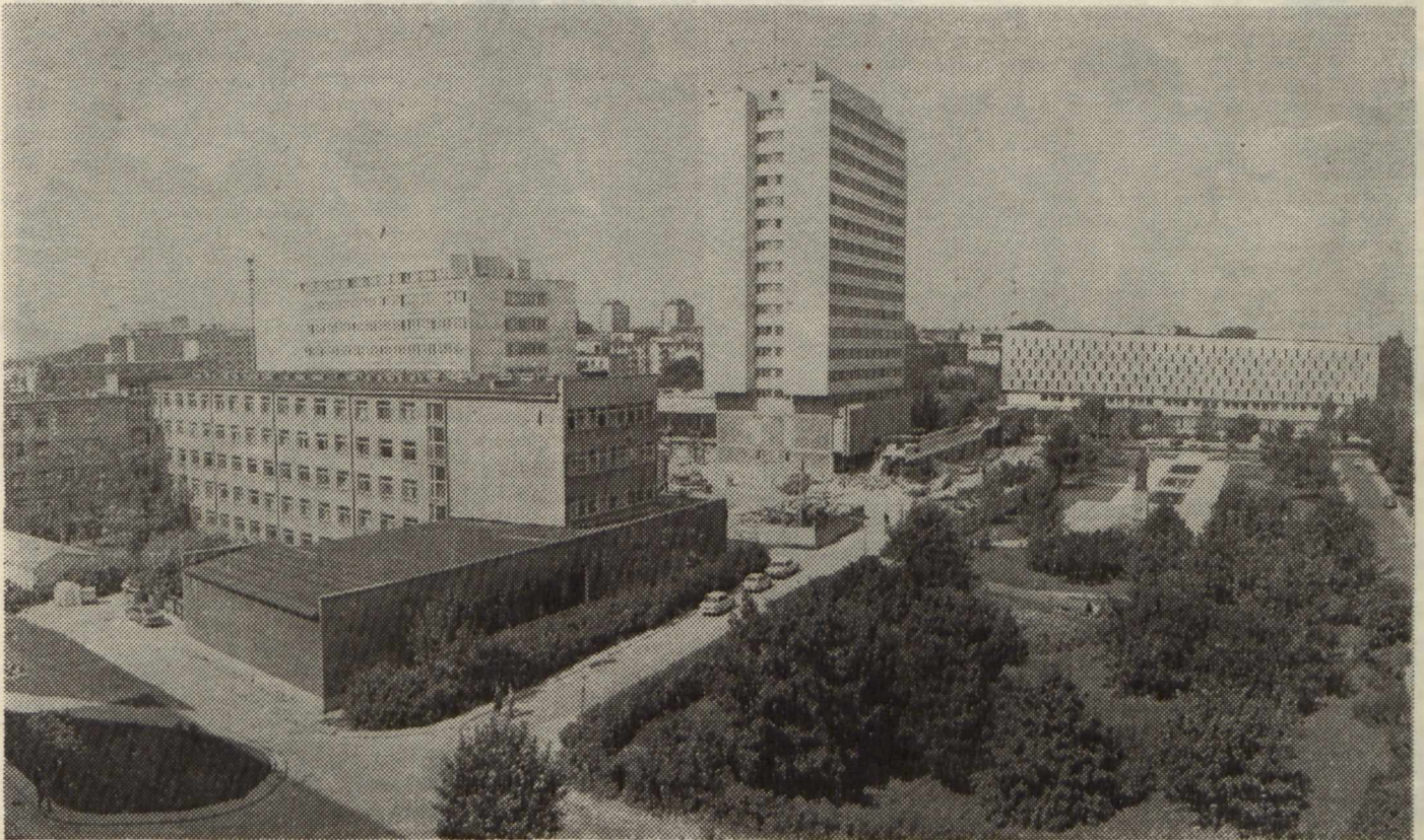
Fragment dzielnicy uniwersyteckiej z nowym budynkiem Wydziału Ekonomicznego i Rektoratu.