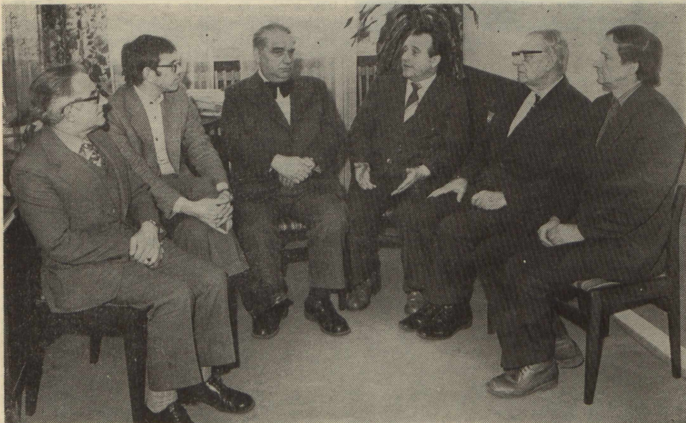
Dziekan Wydziału Ekonomicznego na uroczystym spotkaniu