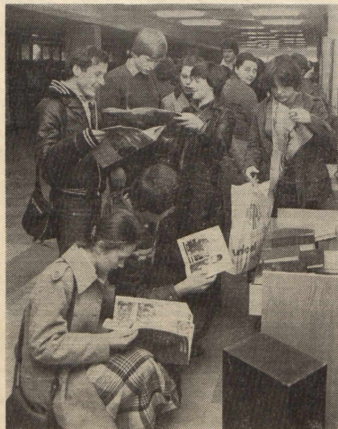
Prasa bułgarska zainteresowała lubelskich studentów