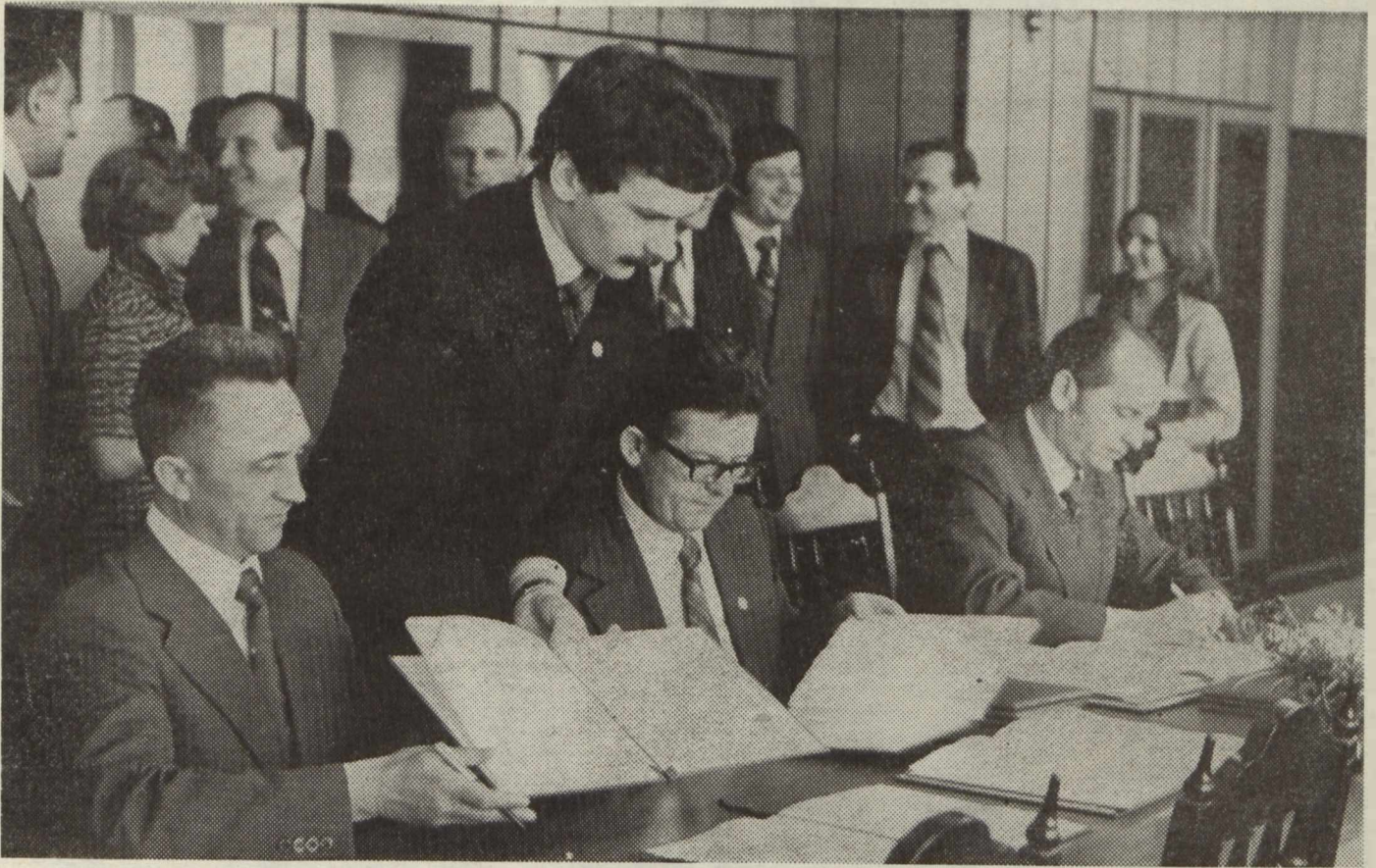
Podpisanie umowy UMCS z Instytutem Nawozów Sztucznych i Zakładami Przemysłu Nieorganicznego „Permedia”