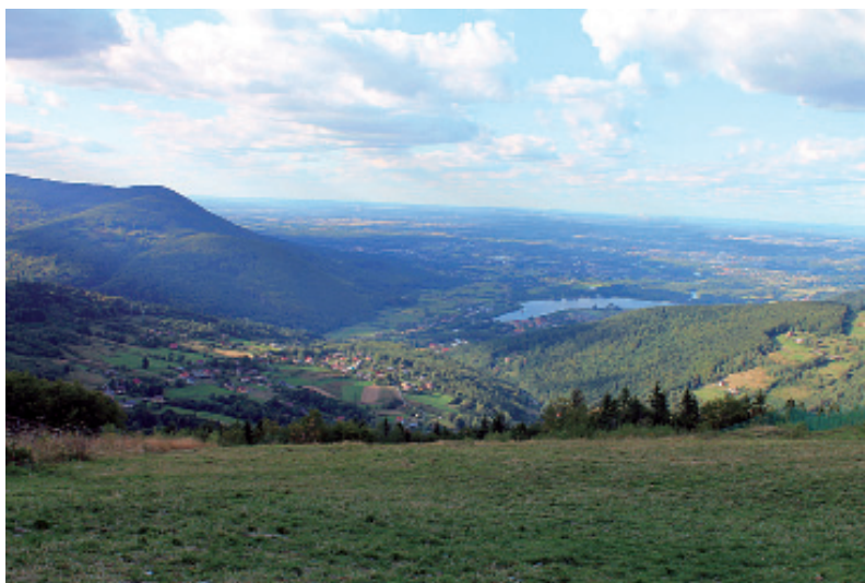
Fot. 3. Krajobraz rolno-pasterski Kozubnika oraz wschodniego grzbietu Hrobaczej Łąki z początku XXI wieku (2013 r.) – widoczny zanik granicy

Photo 2. The agro-pastoral landscape of Kozubnik and the eastern ridge of the Hrobacza Meadow from the 1930s. In the first plan the farming, development of the Kozubnik. In the background pasture glades of Żarnówka Mała, including the glade of Kosarzyska and the glade of Sadliki