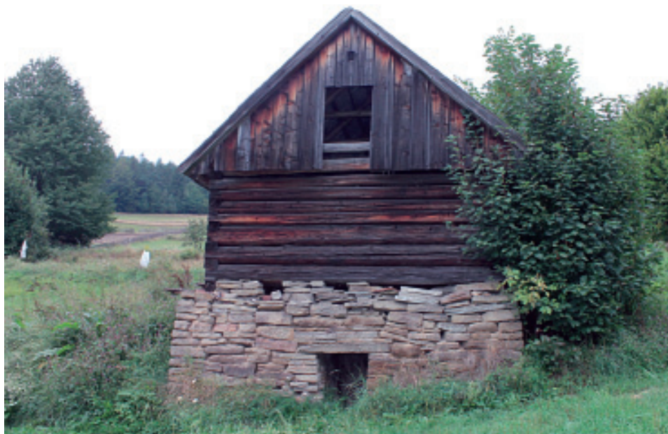
Fot.1. Piwnica konstrukcji kamiennieo-drewnianej w Okrajniku Photo 1. The basement of stone-wooden construction in Okrajnik

Zabudowa gospodarcza. Świadkiem życia pasterskiego jest stuletnia kuźnia w Rzykach Jagódkach, będąca prawdziwą perełką etnograficzną. Do innych budowli związanych z działalnością pastersko-rolniczą należy zaliczyć drewniano-kamienne piwniczki m.in. w Kocierzu Rychwałdzkim oraz Okrajniku (fot.1).