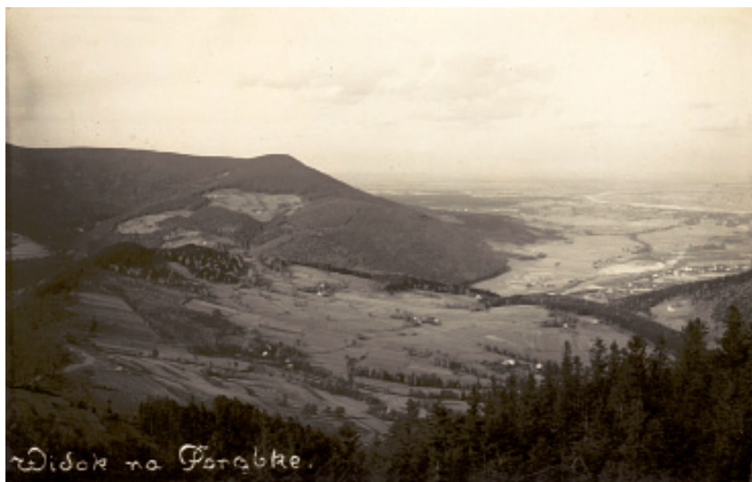
Fot. 2. Krajobraz rolno-pasterski Kozubnika oraz wschodniego grzbietu Hrobaczej Łąki z lat 30. XX wieku. Na pierwszym planie rolnicze zagospodarowanie Kozubnika. W tle pasterskie polany Żarnówki Małej, w tym polana Kosarzyska oraz polana Sadliki

Photo 2. The agro-pastoral landscape of Kozubnik and the eastern ridge of the Hrobacza Meadow from the 1930s. In the first plan the farming, development of the Kozubnik. In the background pasture glades of Żarnówka Mała, including the glade of Kosarzyska and the glade of Sadliki