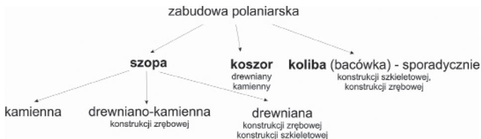
Ryc. 2. Struktura użytkowa i konstrukcyjna zabudowy polaniarskiej regionu Beskidu Małego Fig. 2. Usable and construction structure of the agro-shepherd buildings in the Little Beskid

odpowiednich prac. Jeżeli natomiast okres pobytu trwał kilka tygodni, to warunkiem przebywania na polanie było posiadanie schronienia dla ludzi i zwierząt. Rolę tę pełniła szopa, której towarzyszyła rozbieralna, prymitywna kuchenka, kosor oraz sporadycznie koliba (ryc. 2).