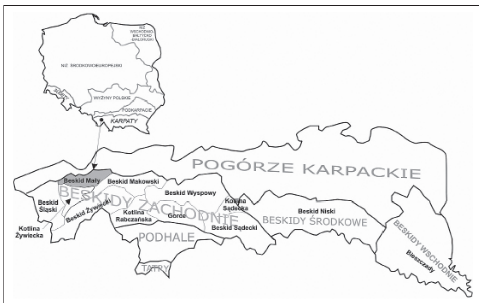
Ryc.1. Lokalizacja obszaru badań. Autor: J. Łach

Beskid Mały jako zwarte pasmo górskie poprzez granice krajobrazowe wyróżnia się spośród pasm Beskidów Zachodnich. Granicą zachodnią jest rzeka Biała i Wilkówka, na południu rzeka Wieśnik i Żylica wpadająca do Jeziora Żywieckiego. Przecinając jezioro, granica biegnie dalej doliną Koszarawy i Pewelki do Przełęczy Hucisko. Z niej wzdłuż doliny Kurówki, Lachówki i Stryszawki do Suchoj Beskidzkiej, skąd doliną Skawy na północ do Wadowic, tworząc wschodnią granicę. Północną granicę stanowi Pogórze Śląskie, z którym tworzy czytelną krawędź morfologiczną (ryc.1).