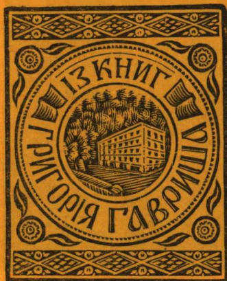
I. Panteluk, drzeworyt

Znaki te pochodzą ze zbioru Zbigniewa Józwicka