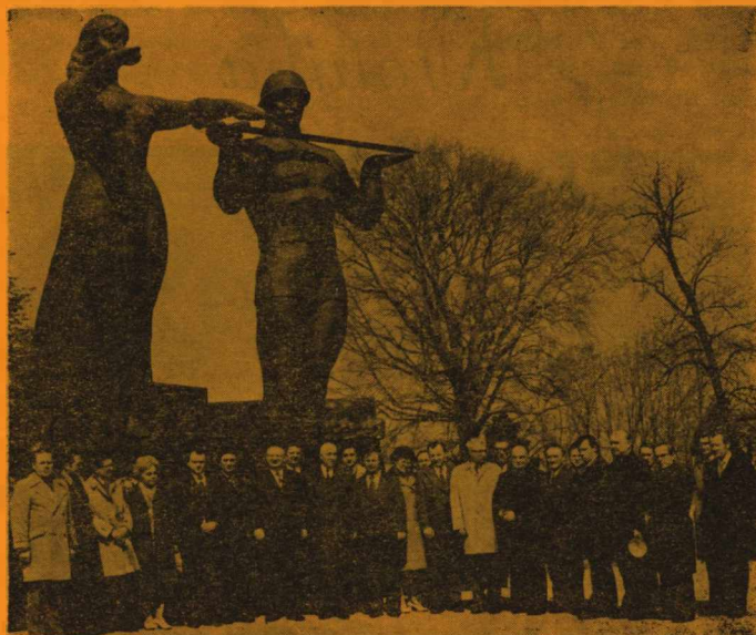
Delegacja UMCS na uroczystościach 30 rocznicy zakończenia Wielkiej Wojny Ojczyźnianej (kwiecień 1975 r.)