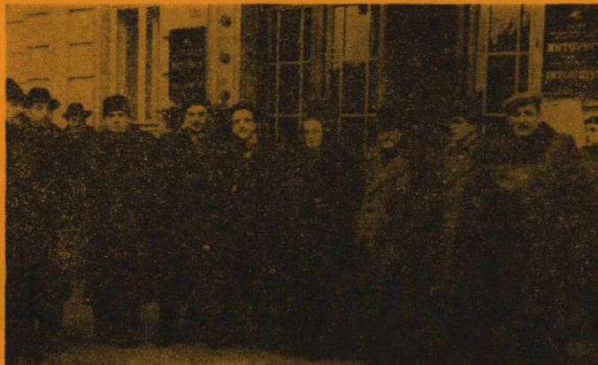
Pierwsza delegacja pracowników UMCS podczas pobytu we Lwowie w roku 1956