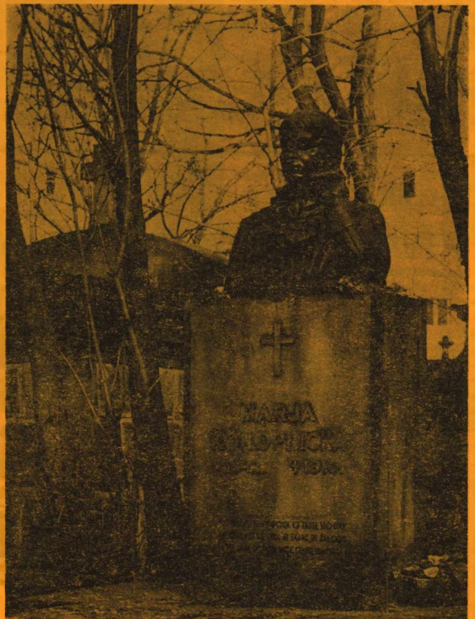
Nagrobek Marii Konopnickiej na lwowskim cmentarzu

Każdego roku grupa 20 studentów ze Lwowa przystępuje do pracy w przedsiębiorstwach budowlanych na terenie Lublina lub województwa.