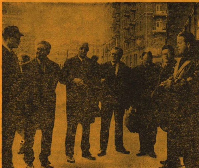
Delegacja pracowników UMCS we Lwowie podczas uroczystości leninowskich (kwiecień 1970 r.)