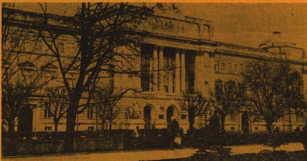
Gmach Uniwersytetu im. Iwana Franki we Lwowie