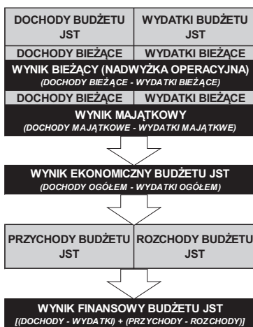
Rys. 1. Elementy równoważenia budżetu JST