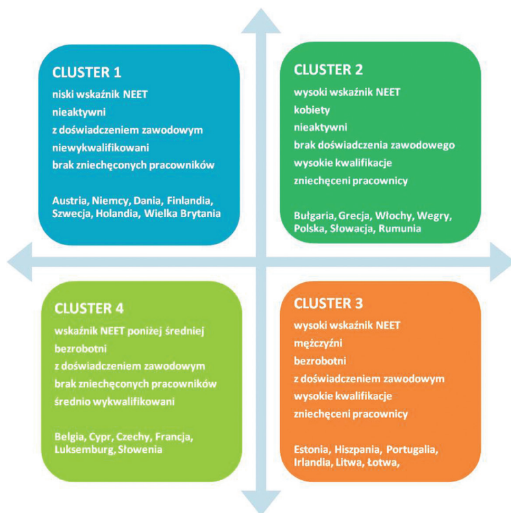
Ryc. 2. Klastry NEET w Europie