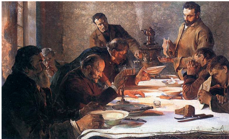
Ilustracja 1. J. Malczewski, Wigilia na Syberii , 1892, wymiary: 81cm x 126cm.

Ten narodowy, fundamentalny dla sztuki Malczewskiego aspekt widzimy również w cyklu obrazów związanych z Syberią – Na etapie. Sybiracy (1890), Sybiracy (1891) i Wigilia na Syberii (1892) 15 . Ostatni z nich zainspiruje Kaczmarskiego.