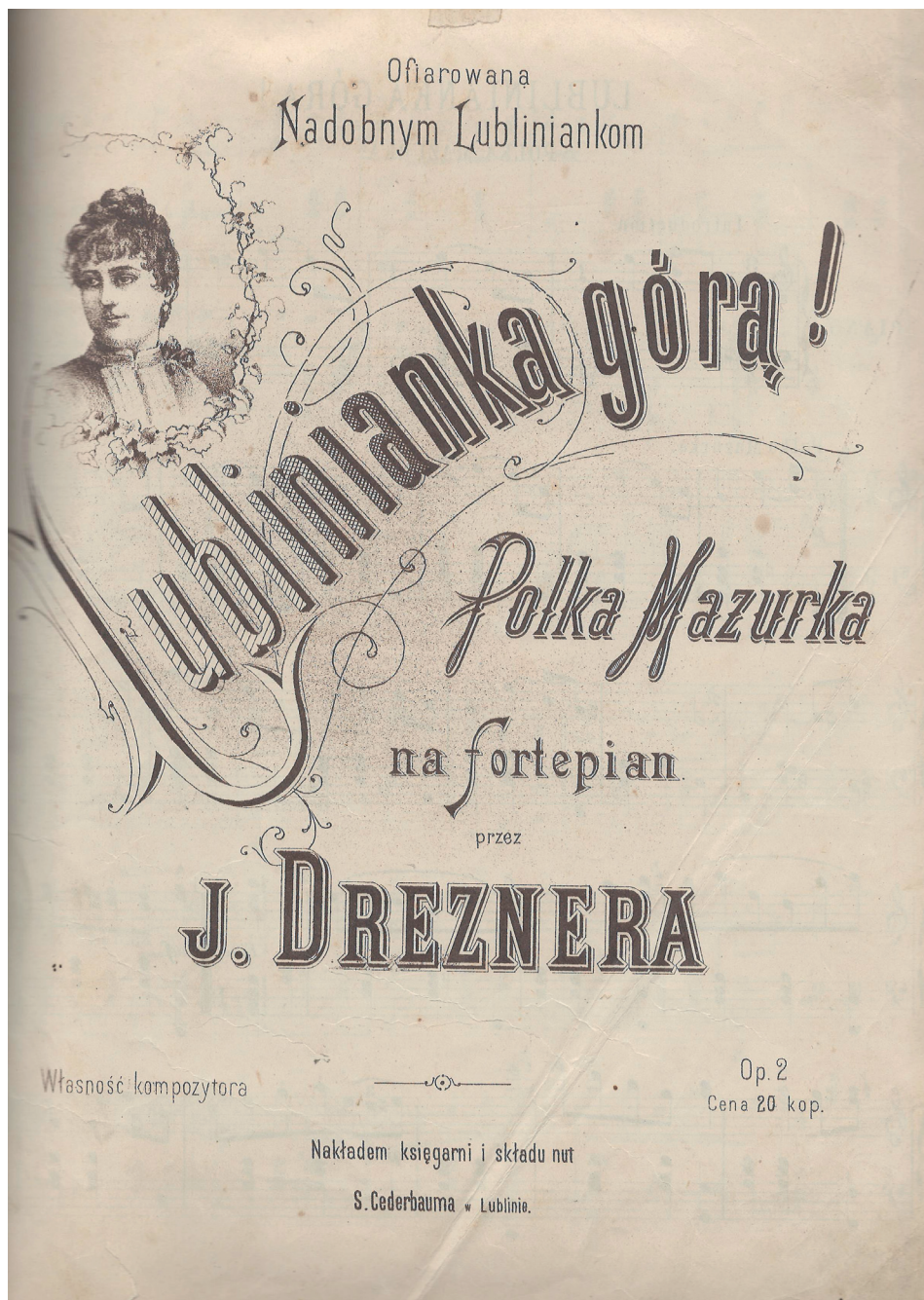
Ilustracja 3. Polka Mazurka „Lublinianka górą!” , muzyka J. Drezner, druk, Warszawa 1890 (lub 1891); cd. na s. 95-96.