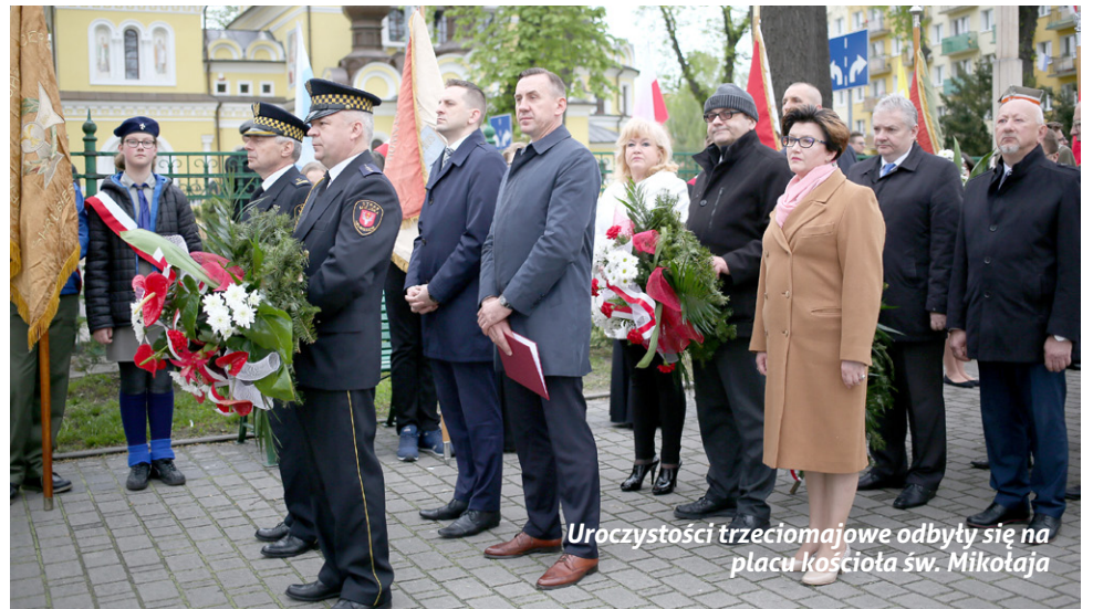
Uroczystości trzeciomałajowe odbyły się na placu kościoła św. Mikołaja