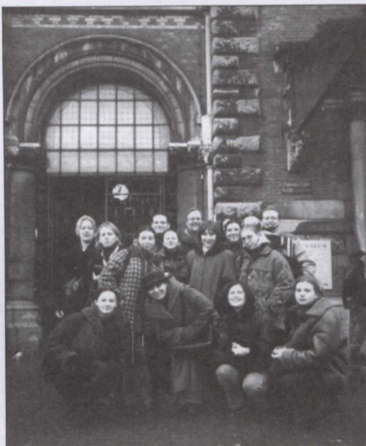
Lubelska grupa w Holandii.

okazją do pogłębienia wiedzy oraz zdobycia doświadczeń w zakresie działalności pedagogicznej. Z wypowiedzi studentek można wnioskować, iż wiele z tego, z czym spotkały się w Holandii, wywarło na nie duże wrażenie oraz dało inspirację do przyszłej pracy.