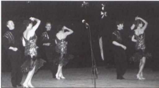
Migawki z koncertu dedykowanego sponsorom kultury studenckiej.

ski wręczał dyplomy absolwentom rocznego Studium „Organizacja Pomocy Społecznej”; jednostka ta prowadzona jest przez Policealną Szkołę Pracowników Służby Społecznej oraz przez nasz Uniwersytet.