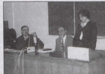
Pierwsze spotkanie odbyło się 19 stycznia w Sali Audytorijnej Wydziału Biologii i Nauk o Ziemi.

Od dwóch lat działa na Uniwersytecie Marii Curie-Skłodowskiej program edukacyjny Unii Europejskiej SOCRATES-ERASMUS . Wspiera on współpracę w zakresie polepszenia jakości kształcenia, a jego celem jest promocja europejskiego wymiaru kształcenia na wszystkich poziomach („uczenie się przez całe życie”). Oferta edukacyjna Programu, bardzo szeroka i interesująca, obejmuje m.in.: kształcenie na poziomie szkolnictwa wyższego poprzez koordynację współpracy między uczelniami, wymianę studentów i pracowników, zawiera ponadto interesujące oferty dla szkolnictwa średniego, promocję naukania języków obcych, kształcenia dorosłych itp. Uczelnia nasza, w