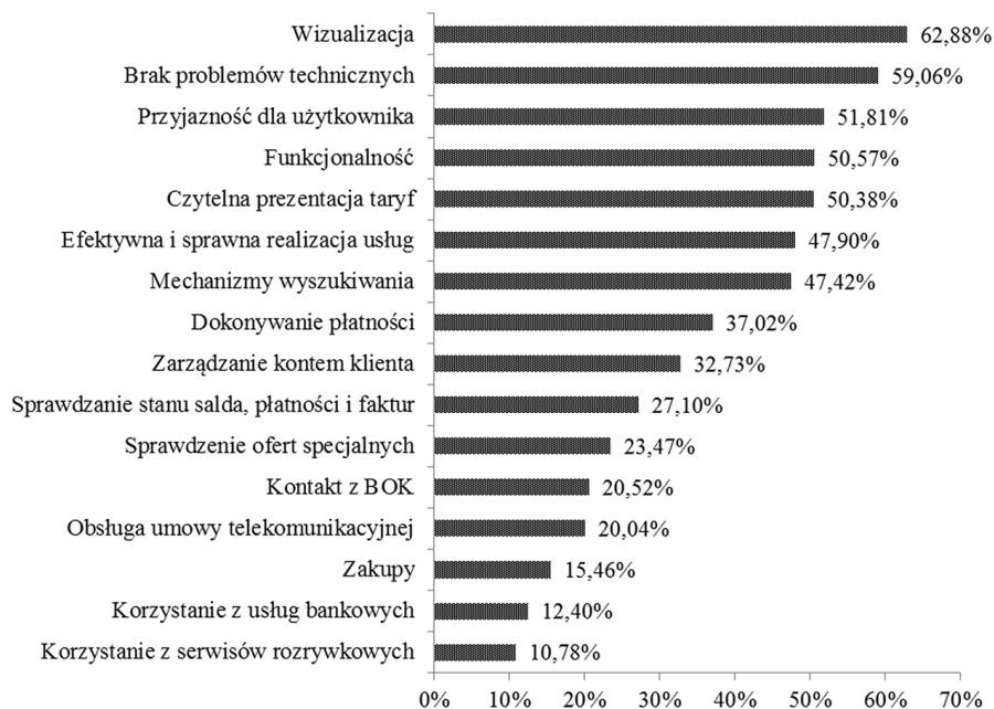
Rys. 2. Uśrednione oceny kryteriów jakości serwisów operatorów telekomunikacyjnych