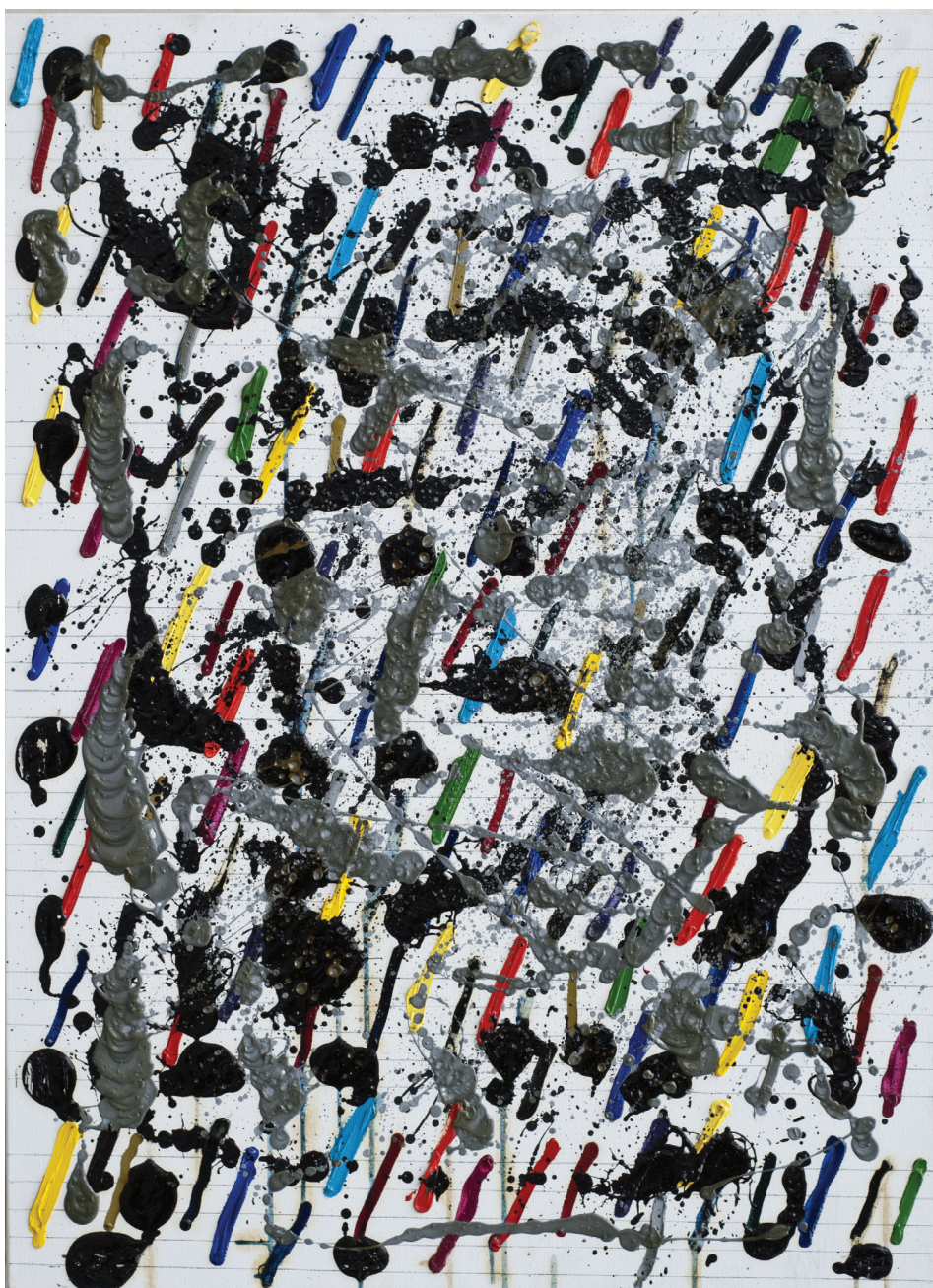
Ilustracja 1. W. Pawlak, Partytura do baletu Sokrates III , 2003, 73x100 cm