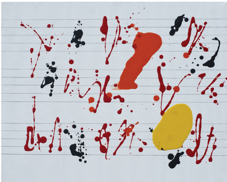
Ilustracja 3. W. Pawlak, Partytura do baletu Sokrates XXXXXXXXXVIII , 2008, 40x50 cm