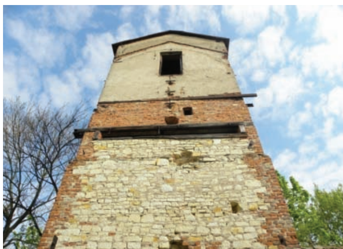
Ilustracja 6. Budynek suszarni chmielu – elewacja południowa, fot. M. Dudkiewicz (2012).

Przeprowadzone analizy wskazują na brak opieki i niszczące zmiany w substancji zabytkowej parku i budynków zespołu dworskiego w Łęcznej. Inwentaryzacja ukazała zarastanie parku krajobrazowego, gdzie drzewa i krzewy tworzą niekontrolowane, przypadkowe skupiska oraz niszczące budynki folwarku. Niewątpliwie jednak obiekt zasługuje na uwagę ze względów historycznych, przyrodniczych oraz jako zabytek sztuki ogrodowej.