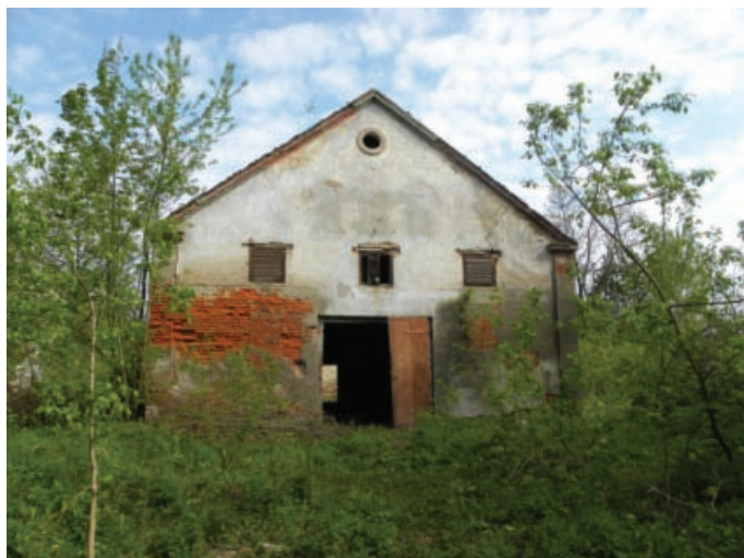
Ilustracja 5. Budynek magazynu – elewacja południowa, fot. M. Dudkiewicz (2012).