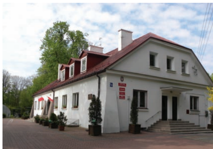
Ilustracja 4. Budynek dworu – elewacja północna, fot. M. Dudkiewicz (2012).