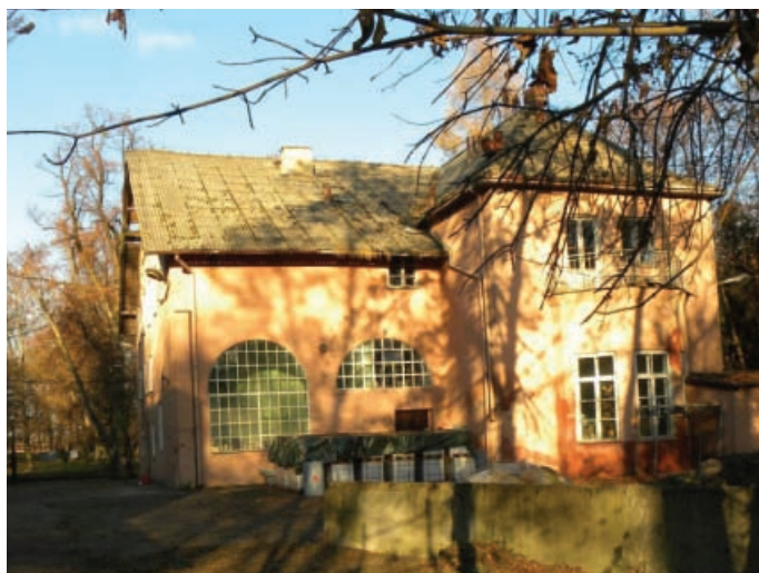
Ilustracja 3. Budynek pałacu – elewacja południowa, fot. M. Dudkiewicz (2012).

Ogólna inwentaryzacja architektoniczna przeprowadzona w 2012 roku (zob. il. 3-6) wykazała, że budynek z roku 1881 jest w stanie ruiny. Obiekt ten był wzniesiony na planie prostokąta, z dachem dwuspadowym, ścianami wykonanym z cegły i opoki wapiennej, naprożami okien ceglanyymi i łukowymi. W sąsiednim budynku – suszarni – jest zachowane deskowanie więźby dachowej, w kształcie koperty, z zewnątrz dach dwuspadowy. W magazynie układ dachu płatwiowo-kleszczowy, kleszcze w przekroju okrągłym, z bali. Strop opiera się na drewnianych słupach, ściany murowane z cegły dziurawki. Dach nakryty eternitem z zaakcentowanymi narożnikami.