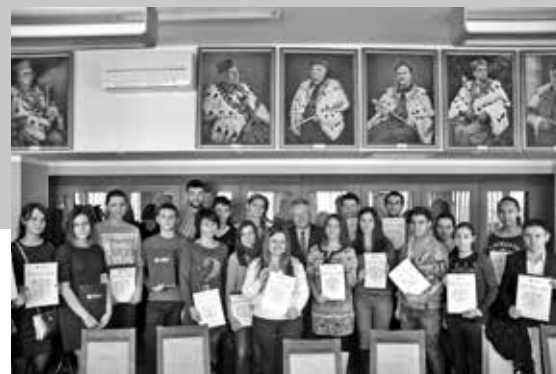
• Wręczenie dyplomów

Tematem spotkania była współpraca środowiska akademickiego Lublina z parlamentarzystami z Lubelszczyzny w celu pozyskiwania środków na rozwój naszego ośrodka akademickiego. ●