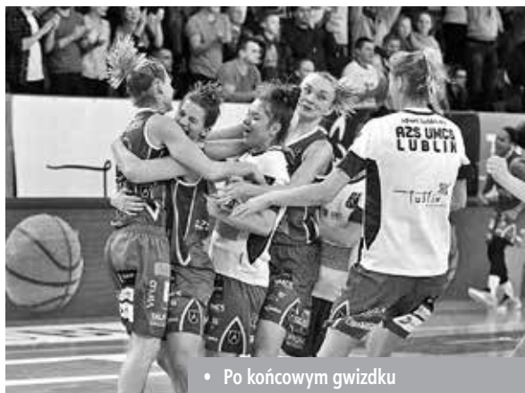
• Po końcowym gwizdku

Sam Final Six Puchar Polski został świetnie przygotowany. Poza bardzo liczną widownią, tak naprawdę każdy mógł znaleźć coś dla siebie. Na górze, ponad trybunami zostały nawet przygotowane specjalne kącki zabaw dla dzieci, żeby mali widzowie mogli zająć się zabawą i różnymi atrakcjami. Oczywiście nie zabrakło