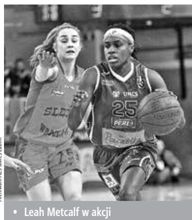
• Leah Metcalf w akcji