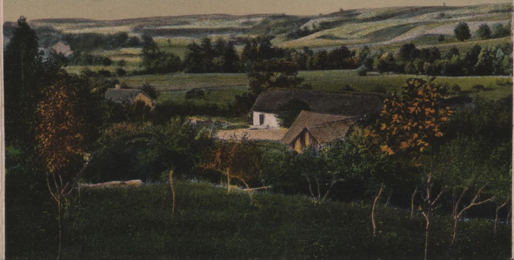
Polanka za Nałęczowem