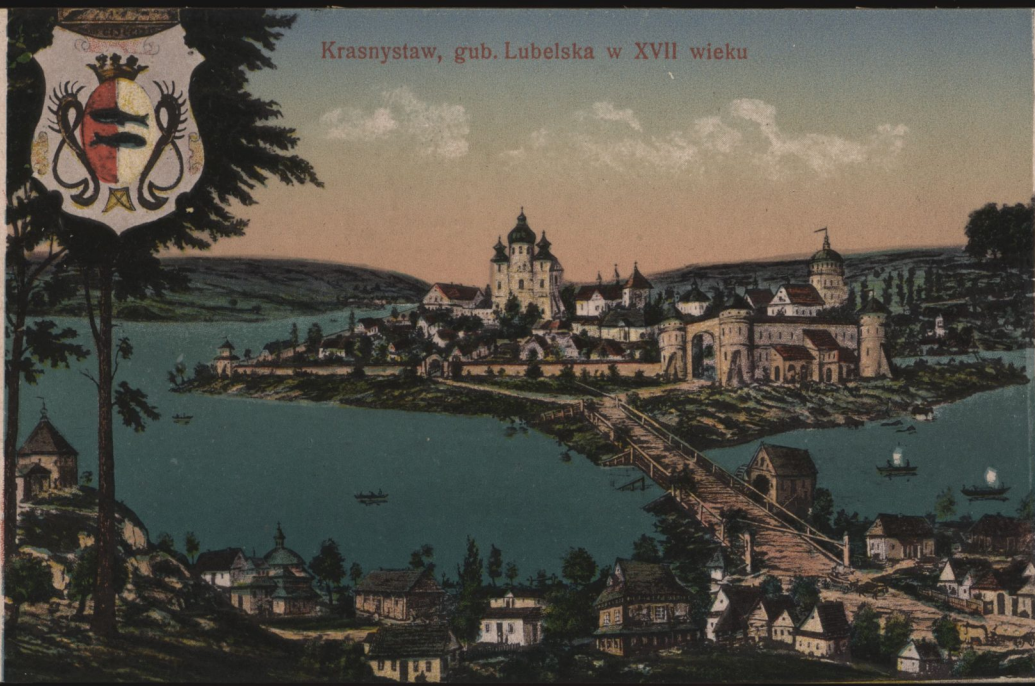
Krasnystaw, gub. Lubelska w XVII wieku